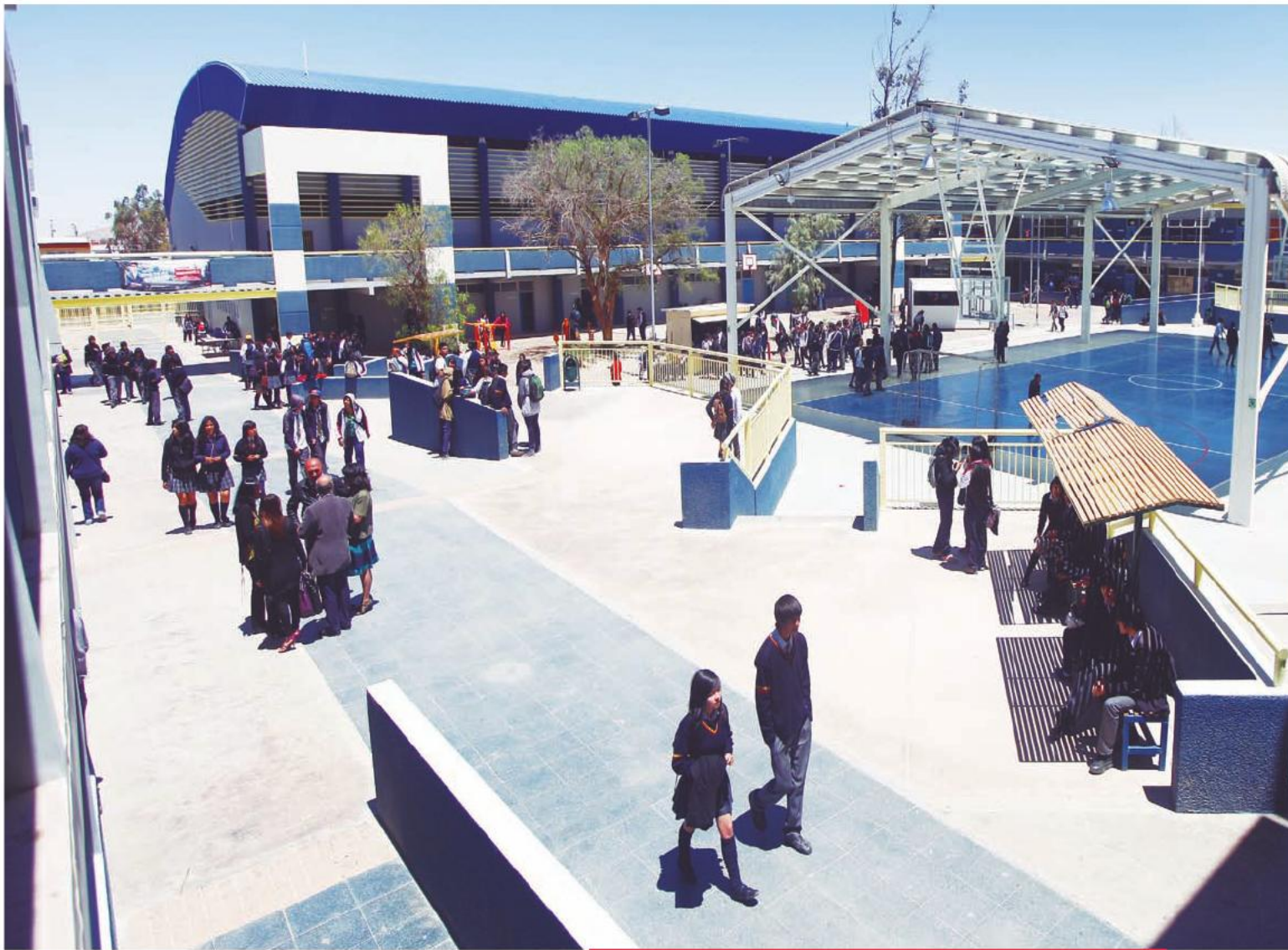
Los alumnos del Liceo B-8 Francisco de Aguirre de Calama iniciarán el año académico 2014 en sus nuevas instalaciones.

una construcción de seis mil 800 metros cuadrados de nuevas instalaciones, además de la reparación del edificio antiguo. Este recinto cuenta con capacidad para mil 480 alumnos y requirió una inversión de cuatro mil 900 millones de pesos. Por otra parte, alrededor de mil 890 alumnos iniciarán su año escolar en el nuevo Liceo Jorge Alessandri Rodríguez. Las obras consistieron en la ampliación en más de seis mil 600 metros cuadrados y la mejora de las instalaciones antiguas. La inversión fue superior a los cinco mil 100 millones de pesos.