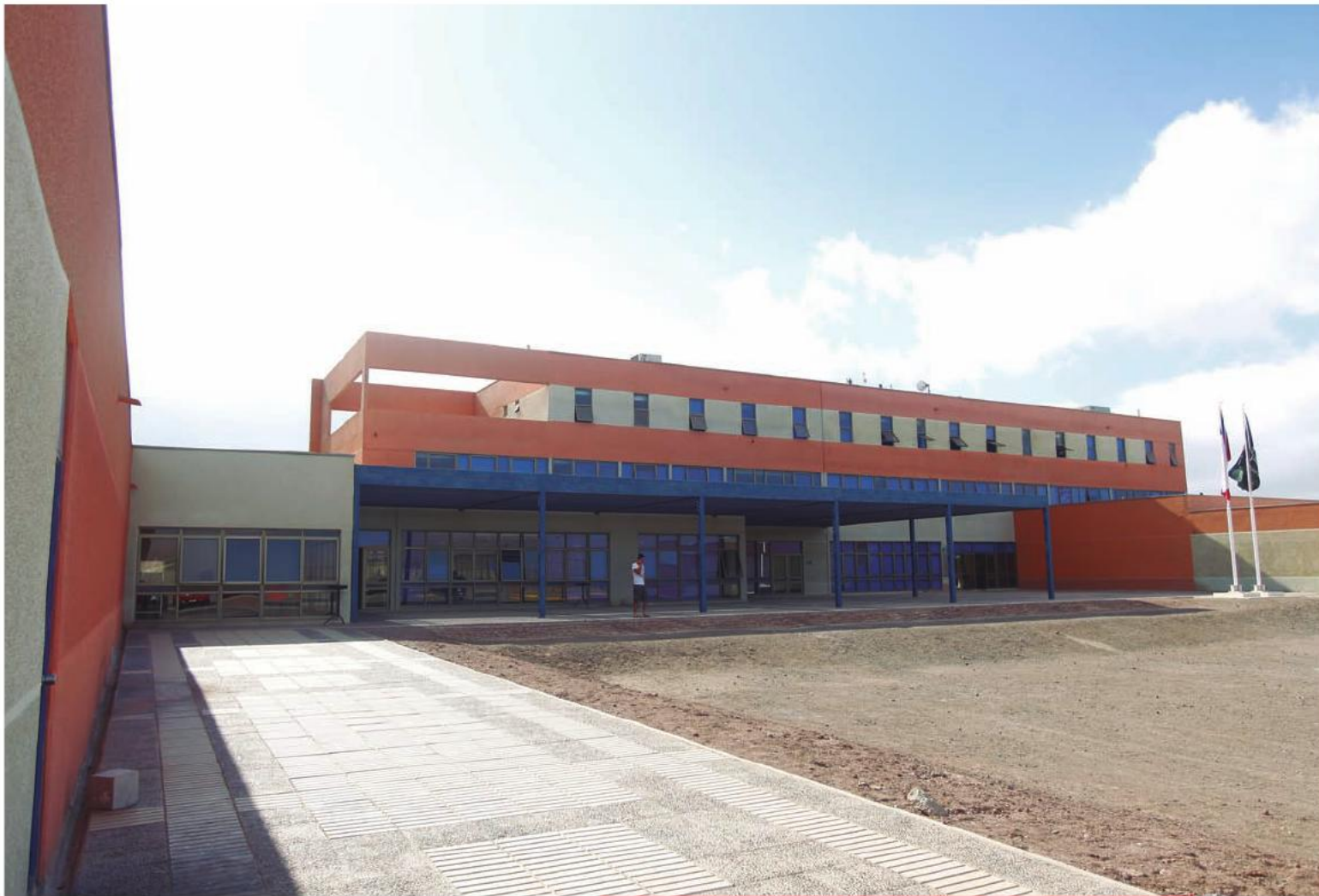
La nueva cárcel concesionada de Antofagasta cuenta con capacidad para mil 160 internos. Fue inaugurada el 30 de agosto de 2013.