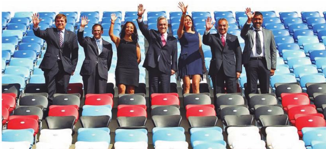
El Presidente Sebastián Piñera, acompañado de ministros de Estado y de la alcaldesa de Antofagasta, Karen Rojo, inauguró el Estadio Regional Calvo y Bascuñán de Antofagasta. 20 de marzo de 2013.

“Hoy día estamos inaugurando este estadio, que sin duda reúne todos los requisitos y todas las condiciones de un estadio moderno, con estándares FIFA. Es un estadio que tiene no solamente una capacidad de más de 21 mil espectadores, sino que, además, tiene la calidad, la seguridad y los servicios de un estadio moderno”.