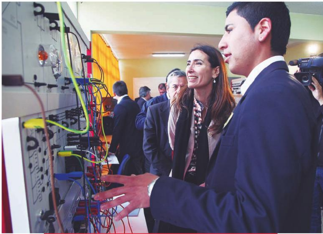
La ministra de Educación, Carolina Schmidt, encabezó la inauguración de las nuevas instalaciones del Liceo Politécnico Arenales de Antofagasta. 10 de octubre de 2013.

En el caso de los resultados de la prueba Simce 2012 para los estudiantes de segundo medio, estos indicaron que la región obtuvo 258 puntos en la prueba de Matemáticas, mientras que en la de Lenguaje, 255 puntos, destacando el aumento de doce y cuatro puntos, respectivamente, en comparación a la medición de 2008.