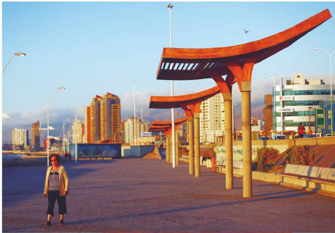
Las obras de remodelación del Paseo del Mar, o borde costero de Antofagasta, fueron inauguradas en junio de 2013.

sarrollo de la capital regional. En junio de 2013 se inauguraron las obras de remodelación del Paseo del Mar de Antofagasta, que une la playa El Cable con el balneario municipal. Estas obras contaron con una inversión de dos mil 900 millones de pesos. Asimismo, se abrió al público el Parque Gran Avenida, que abarca un total de mil 700 metros, divididos en espacios comunitarios y áreas verdes, contemplando una inversión de tres mil 700 millones de pesos.