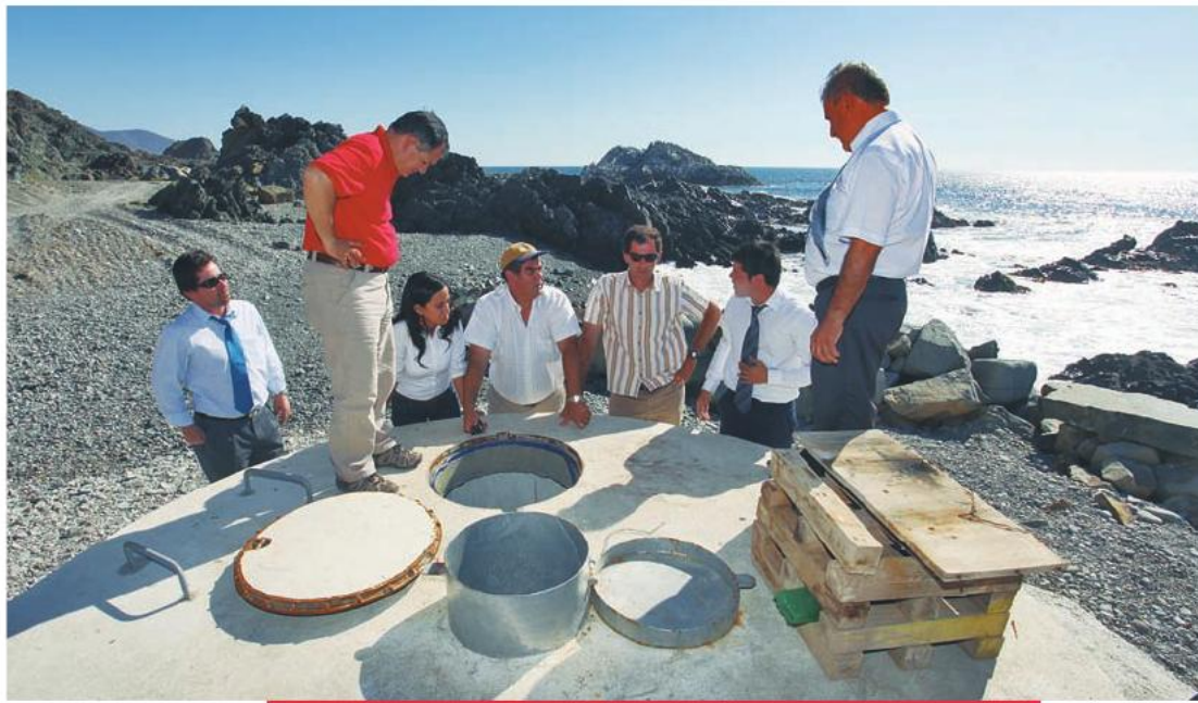
Visita de las obras del futuro Sistema de Agua Potable Rural de Caleta Paposo en Taltal, inaugurado el 9 de noviembre de 2013.