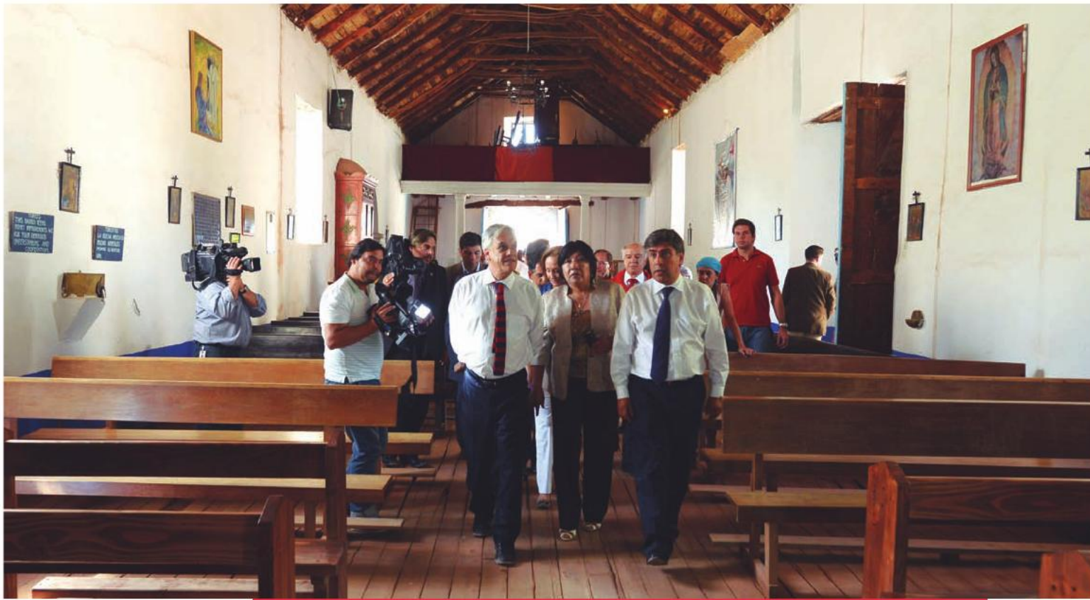
El Presidente Sebastián Piñera, visitó el Templo de San Pedro de Atacama, en el que se realizan obras de restauración en el marco del Programa Puesta en Valor del Patrimonio. 12 de marzo de 2013.

“Vamos a desarrollar con mucha fuerza el turismo de los pueblos del norte, como el pueblo aymará, diaguita, de los molles, y de esa manera, junto con lo que podemos hacer en el sur, con los pehuenches, los mapuches, generar una nueva fuente, un nuevo motor del turismo”.