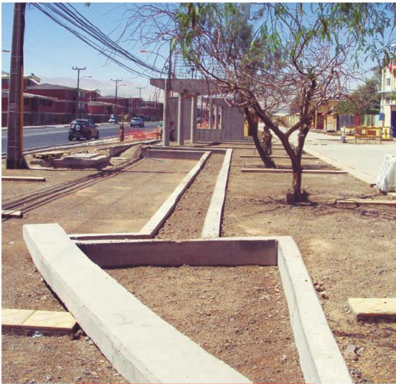
Obras del futuro Paseo Granaderos de Calama.