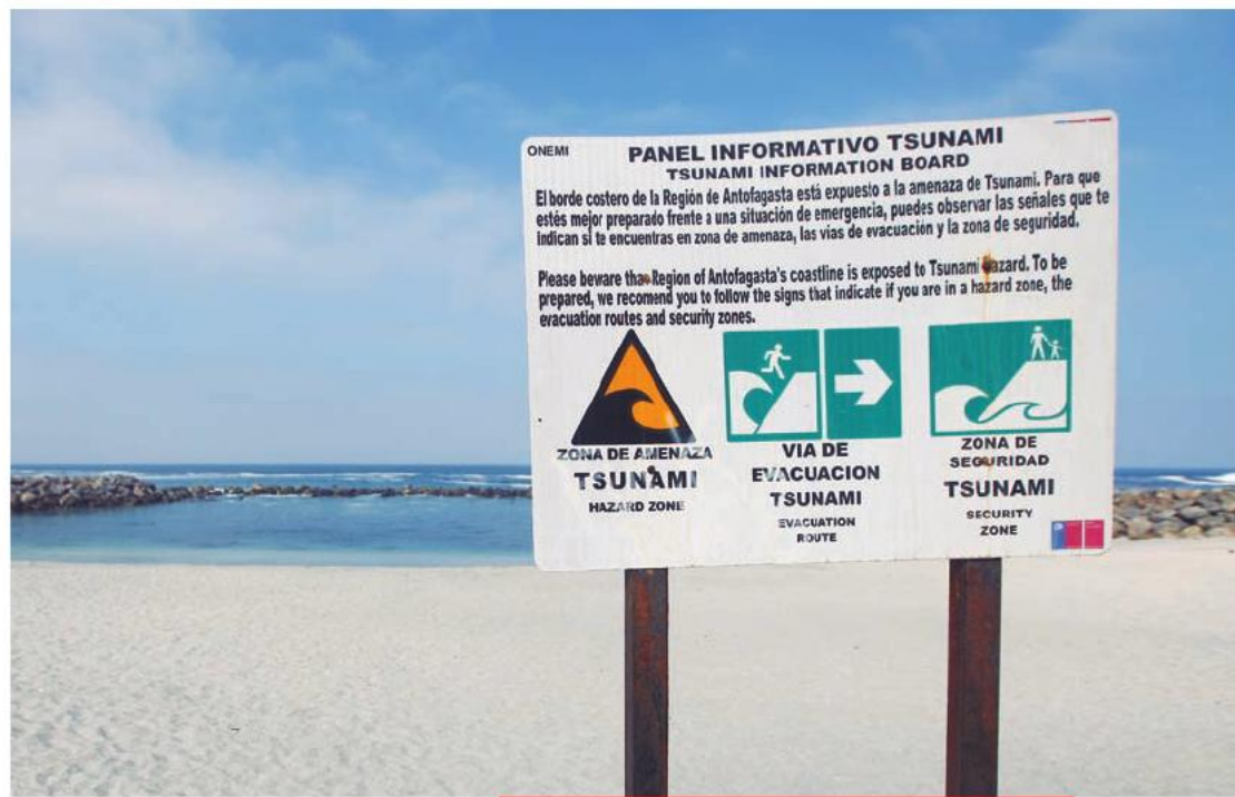
Nueva Señalética de información preventiva ante emergencia por tsunami en Tocopilla.