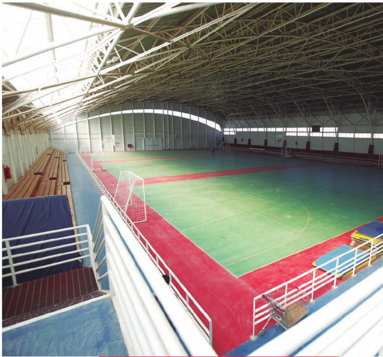
Nuevo Polideportivo Alemania de Calama, inaugurado el 25 de enero de 2012.

dad para trece mil personas, con estándares FIFA. Además, contará con butacas en tribunas Andes, Pacífico y un sector VIP, además de instalación y equipos de megafonía, pantalla LED, equipo electrógeno de emergencia e iluminación de ocho torres, lo que significará una inversión de once mil 500 millones de pesos.