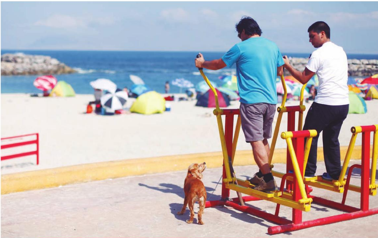
Mejoramiento de la nueva playa Trocadero de la ciudad de Antofagasta, que contempla áreas peatonales, áreas verdes y áreas deportivas, entre otras. 3 de octubre de 2012.

En este mismo sentido se creó el programa de capacitación llamado Mujer Minera, que busca que mil 600 mujeres de todo el país sigan carreras y oficios relacionados con la minería. El 25 de septiembre de 2012 se graduaron las 143 primeras mujeres de la región.