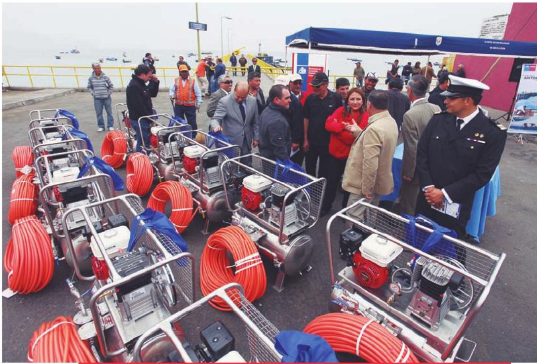
Entrega de equipos de buceo a pescadores de Mejillones, que forma parte del convenio de cooperación entre el Gobierno Regional de Antofagasta y el Fondo de Fomento para la Pesca Artesanal. 22 de agosto de 2013.