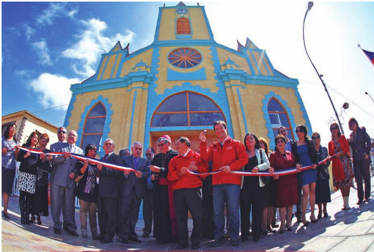
Inauguración de la Iglesia San Francisco de Taltal. La ceremonia fue presidida por el ex intendente de Antofagasta Pablo Toloza, y por el subsecretario de Obras Públicas, Lucas Palacios. 18 de abril de 2013.