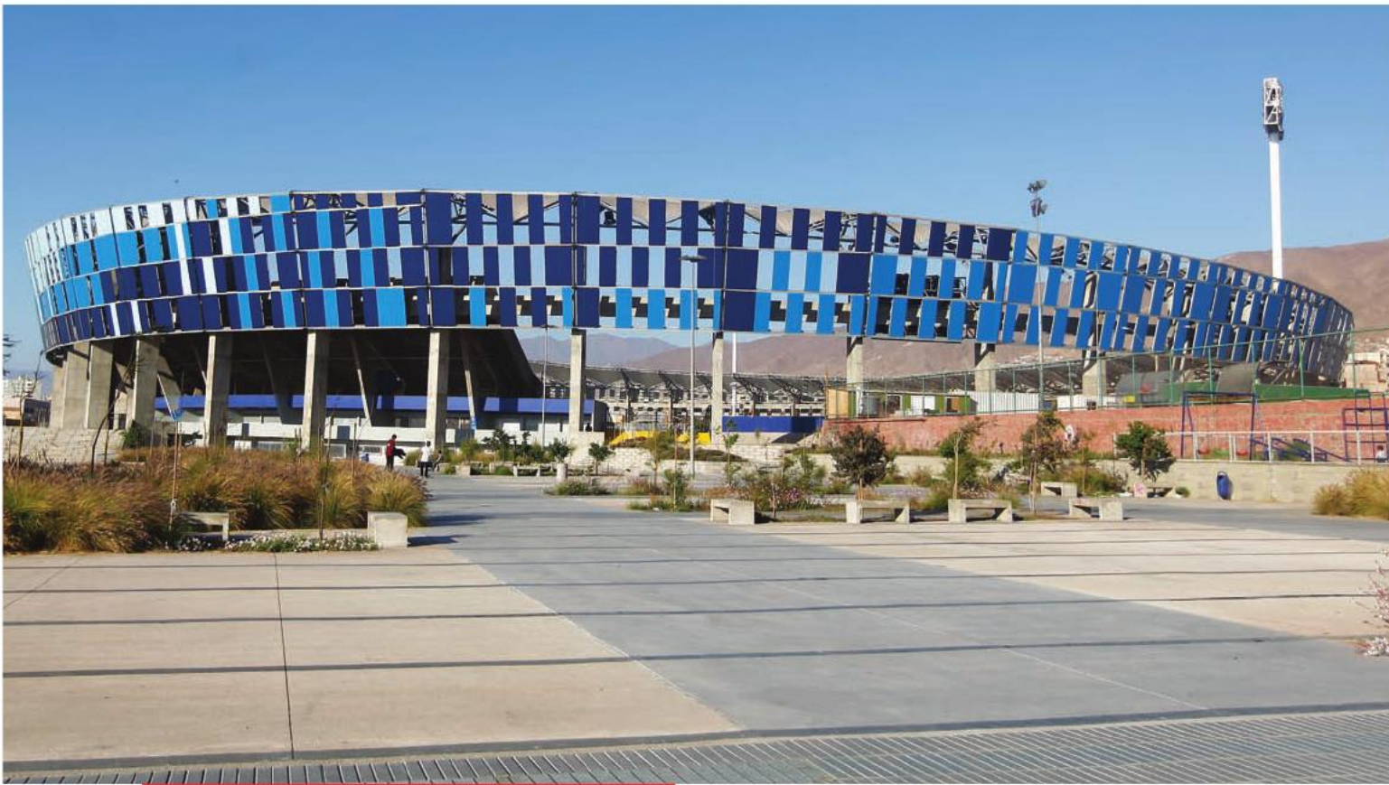
Nuevo Estadio Regional Calvo y Bascuñán de Antofagasta