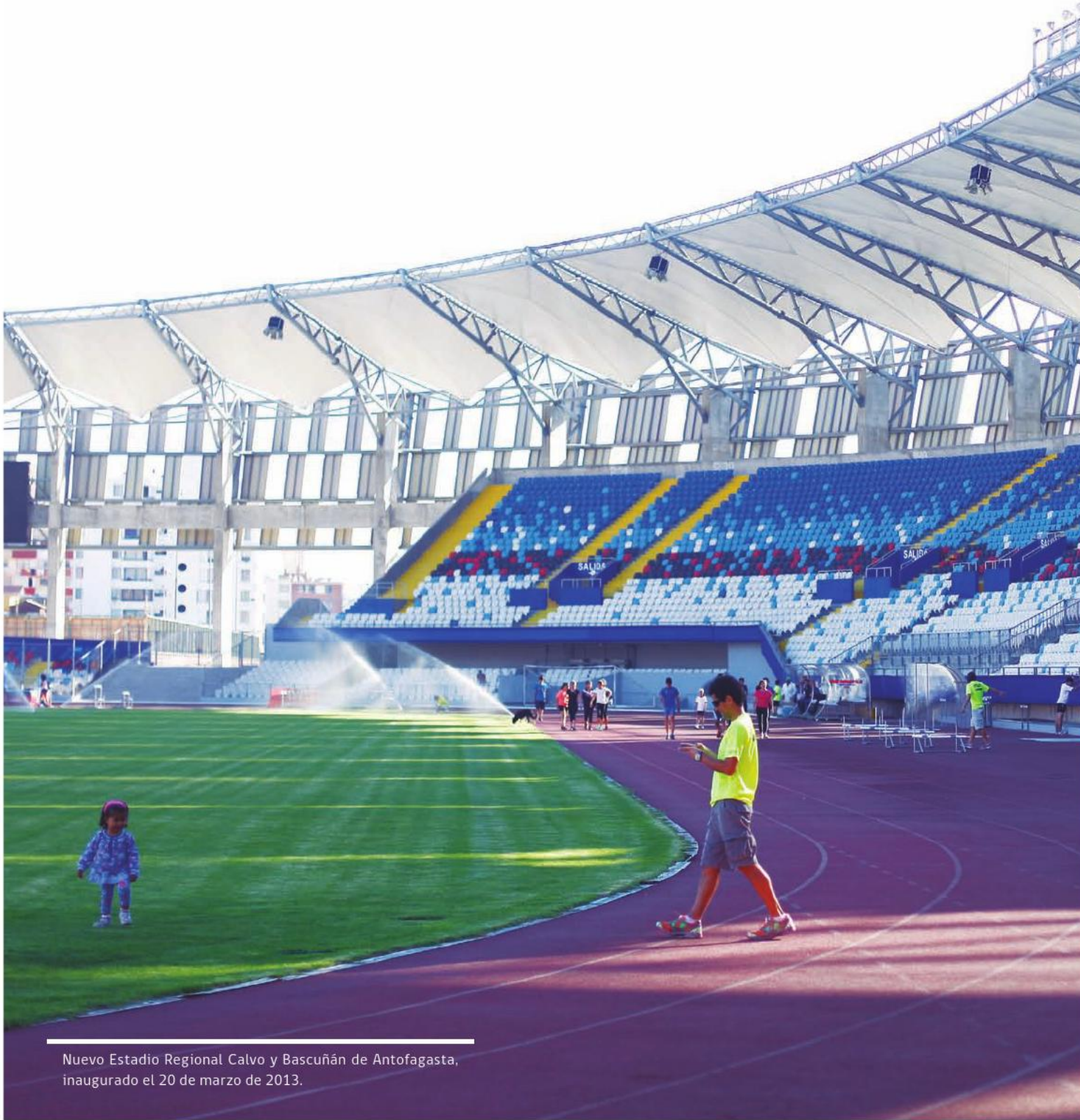
Nuevo Estadio Regional Calvo y Bascuñán de Antofagasta, inaugurado el 20 de marzo de 2013.