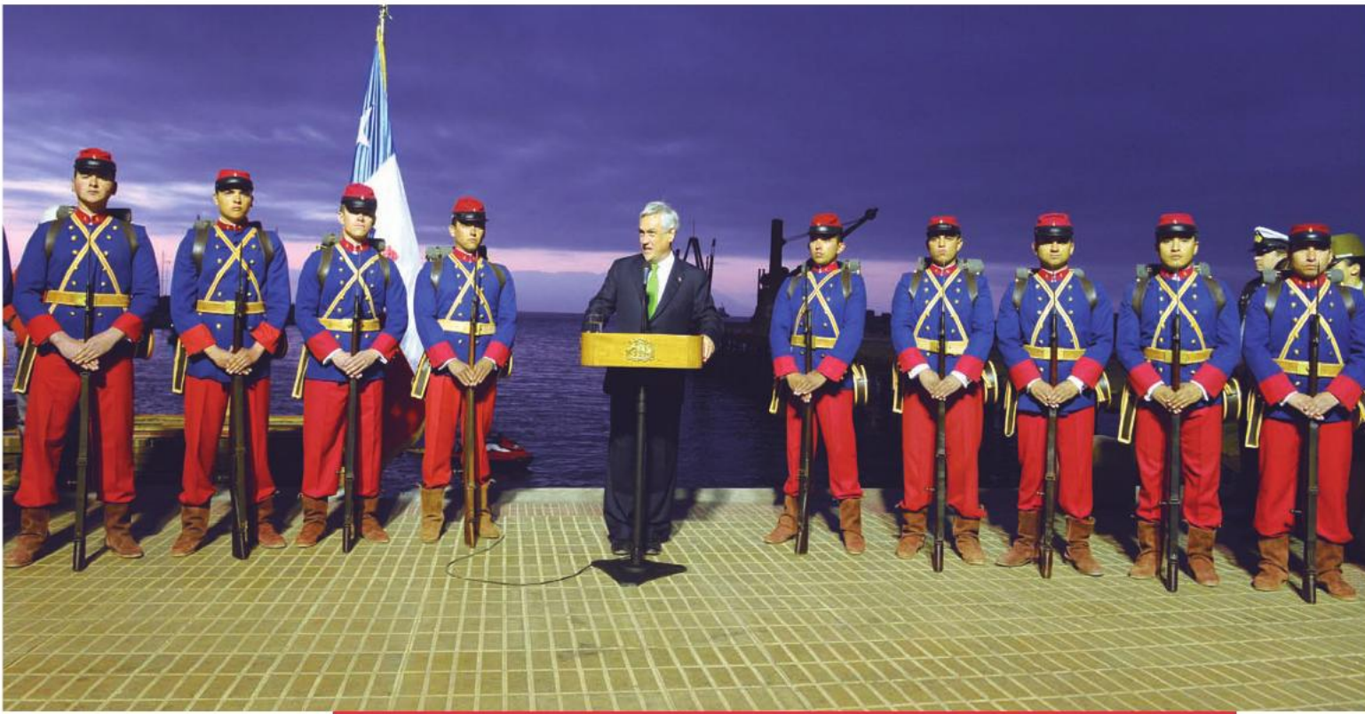
El Presidente de la República, Sebastián Piñera, visitó el inicio de las obras de restauración del Muelle Salitrero Melbourne & Clark, que forma parte del Legado Bicentenario. 23 de julio de 2013.

“Este muelle es parte de nuestra historia, es parte de nuestra identidad y estaba muy deteriorado. Por esa razón, como parte del Legado Bicentenario, lo vamos a recuperar, vamos a recuperar su estructura básica, su superficie, y vamos a proveerlo de mobiliario urbano”.