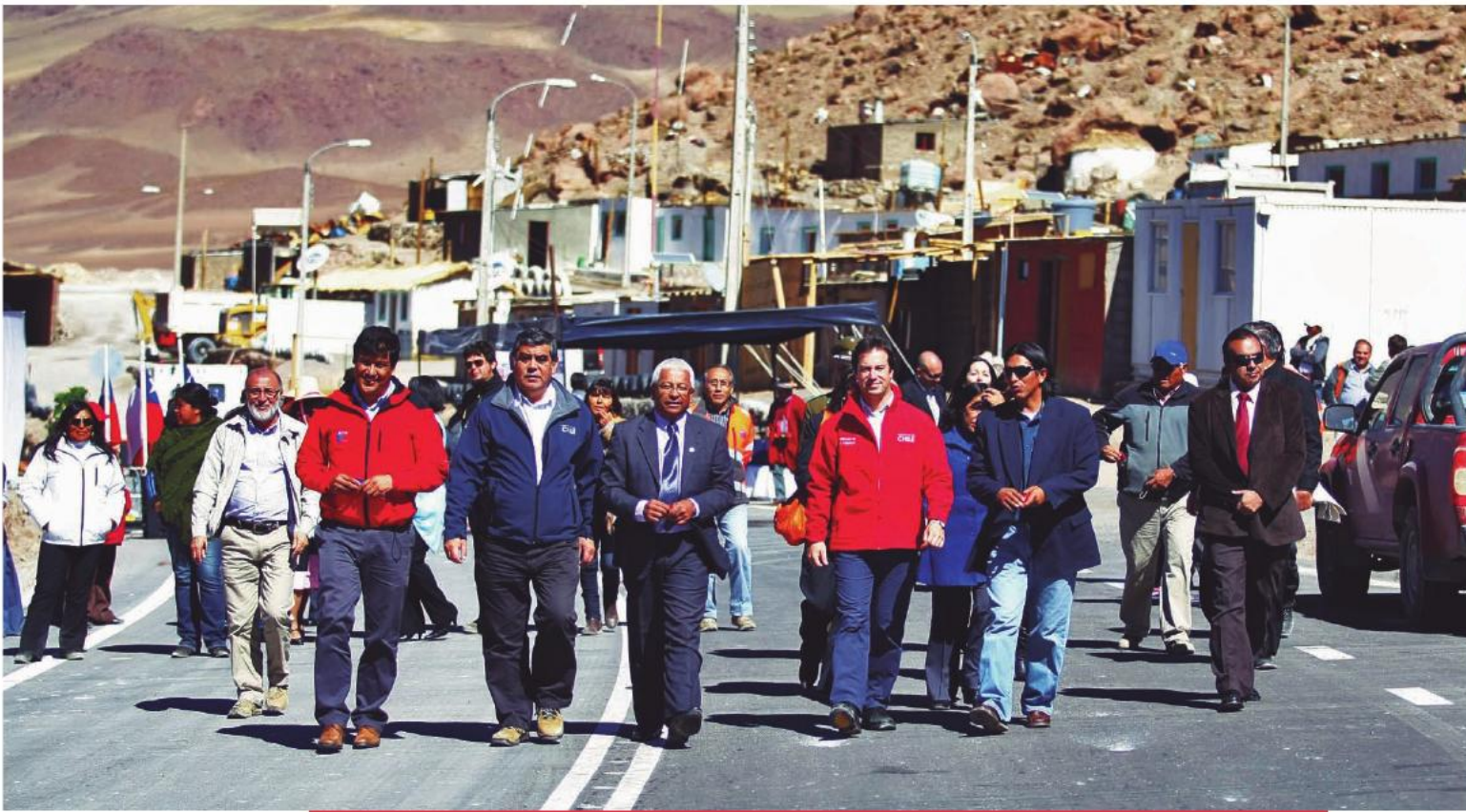
El subsecretario de Obras Públicas, Lucas Palacios, junto al alcalde de Ollagüe, Carlos Reigada, inauguran la pavimentación de 22 kilómetros de la Ruta 21-CH, que une el pueblo de Ascotán con la ciudad de Ollagüe, permitiendo una mejor conectividad en esta zona extrema de nuestro país. 7 de mayo de 2013.

go. Esta obra requirió una inversión de trece mil millones de pesos. También fue reparada la Ruta 5, en el sector que une la localidad de Quillagua con Iberia, en la comuna de María Elena. La obra fue ejecutada en dos etapas, las que contemplaron la intervención de 56 kilómetros y una inversión de trece mil millones de pesos.