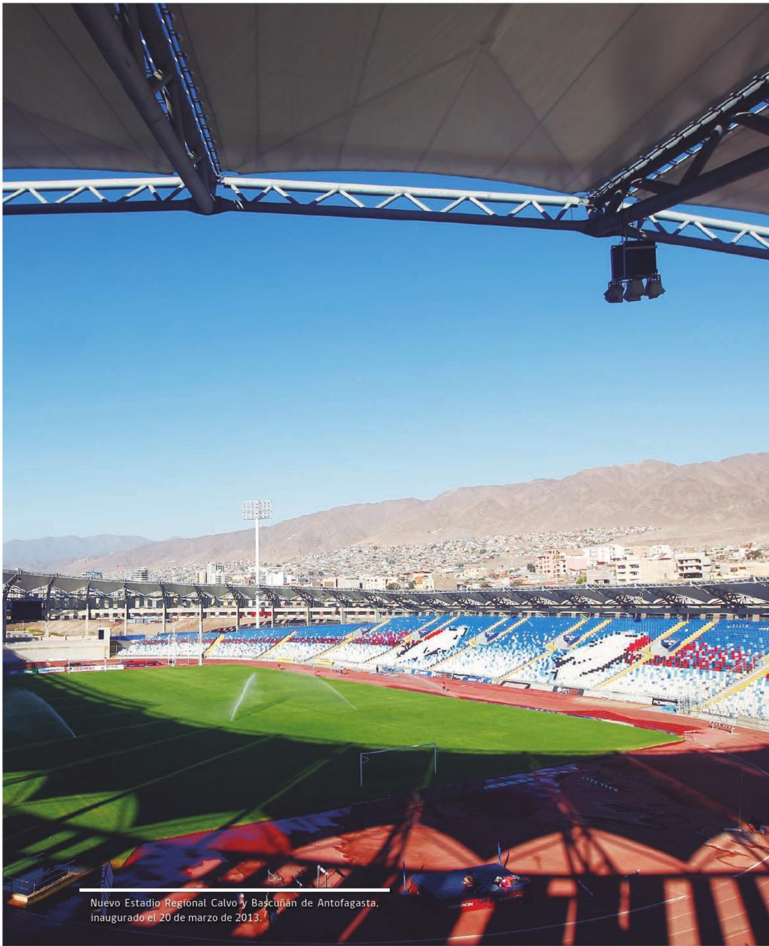
Nuevo Estadio Regional Calvo y Bascañán de Antofagasta, inaugurado el 20 de marzo de 2013.