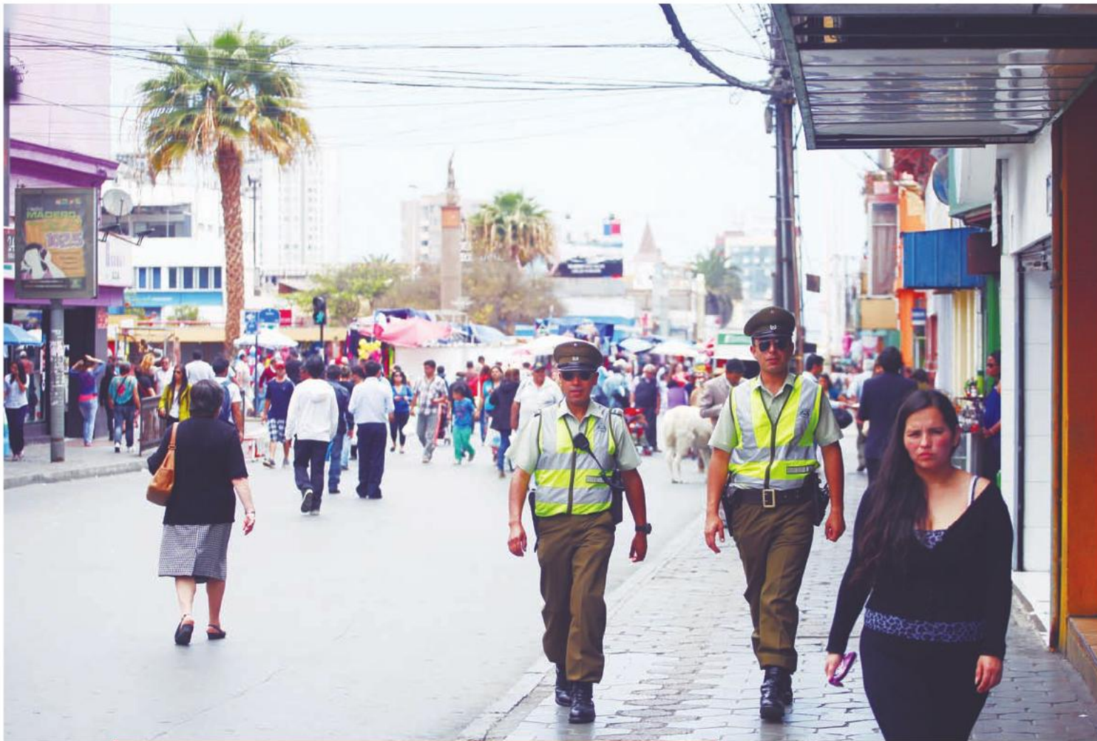
Implementación del Programa Barrio en Paz Comercial en el centro de Antofagasta.