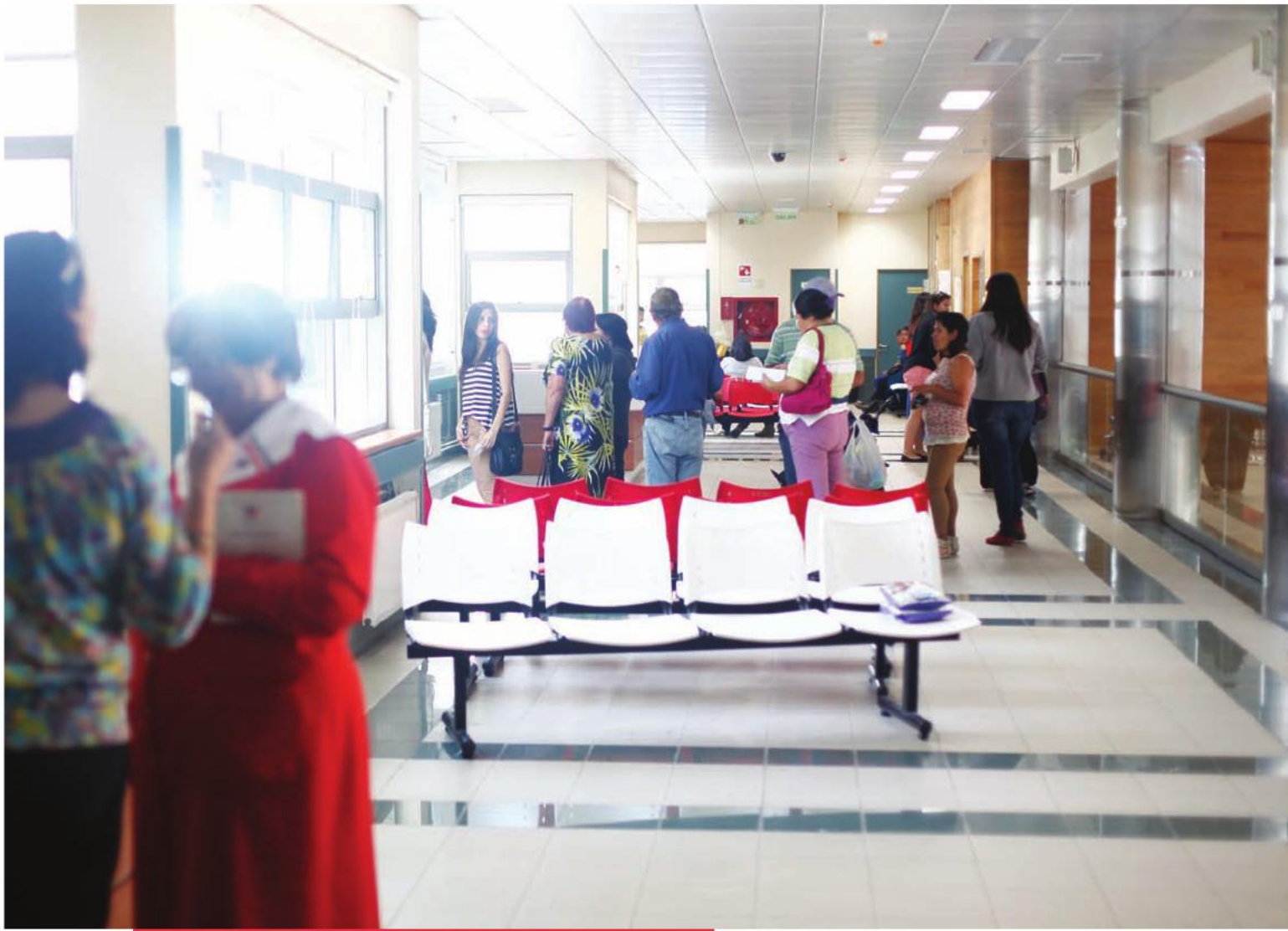
El nuevo Hospital Marcos Macuada de Tocopilla tiene una capacidad de 40 camas y beneficia a más de 32 mil personas.

Una prioridad del Gobierno del Presidente Sebastián Piñera fue aumentar y mejorar la infraestructura hospitalaria. En este sentido, uno de los hechos más importantes fue la colocación de la primera piedra del nuevo Hospital Regional de Antofagasta, la que se llevó a cabo en noviembre de 2013 y que contó con la presencia del ministro de Salud, Jaime Mañalich. La construcción cuenta con una inversión superior a los 119 mil millones de pesos, siendo el hospital concesionado con mayor inversión del país. El recinto dará una solución a todas las necesidades del norte del país, transformándose en un ente autóno-