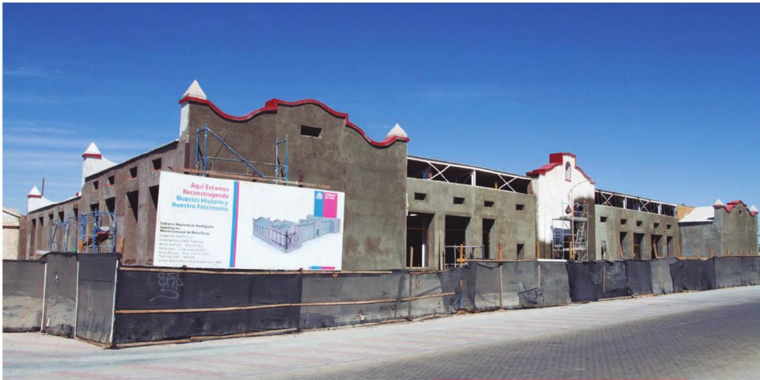
Restauración del Museo Comunal de María Elena.

periódicas, bóvedas de conservación, laboratorios de investigación y áreas académicas. El proyecto se sometió a la participación de la comunidad de San Pedro y tiene el apoyo de la Universidad Católica del Norte.