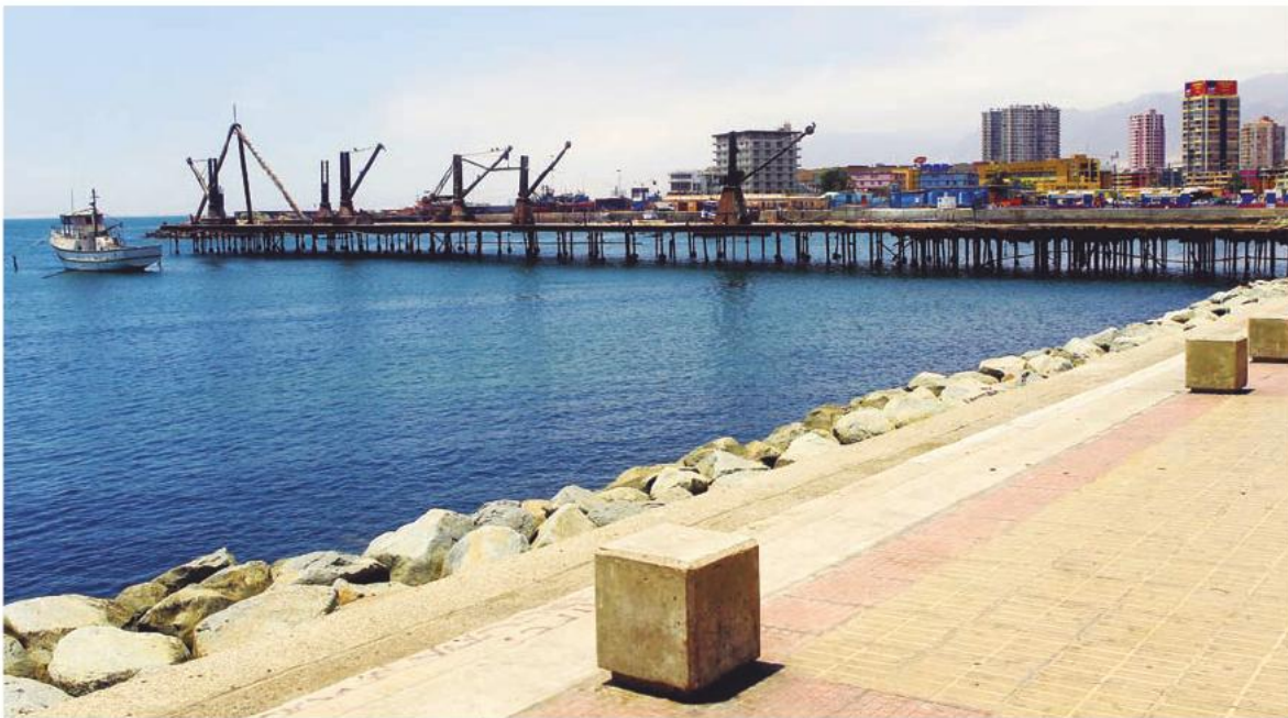
Muelle salitrero Melbourne & Clark de Antofagasta

El nuevo templo se construyó como una réplica del antiguo, pero en lugar de madera se usó hormigón armado. Sólo se realizaron modificaciones mínimas al diseño, con el objetivo de incluir una capilla mortuoria, brindar seguridad a los usuarios y cumplir con la normativa en cuanto a accesos para personas con discapacidad, salidas y equipamiento de emergencia. Las cubiertas metálicas de los techos, las maderas al natural de puertas y ventanas y el color calipso y naranjo claro de sus muros busca también replicar los diseños originales del querido templo.