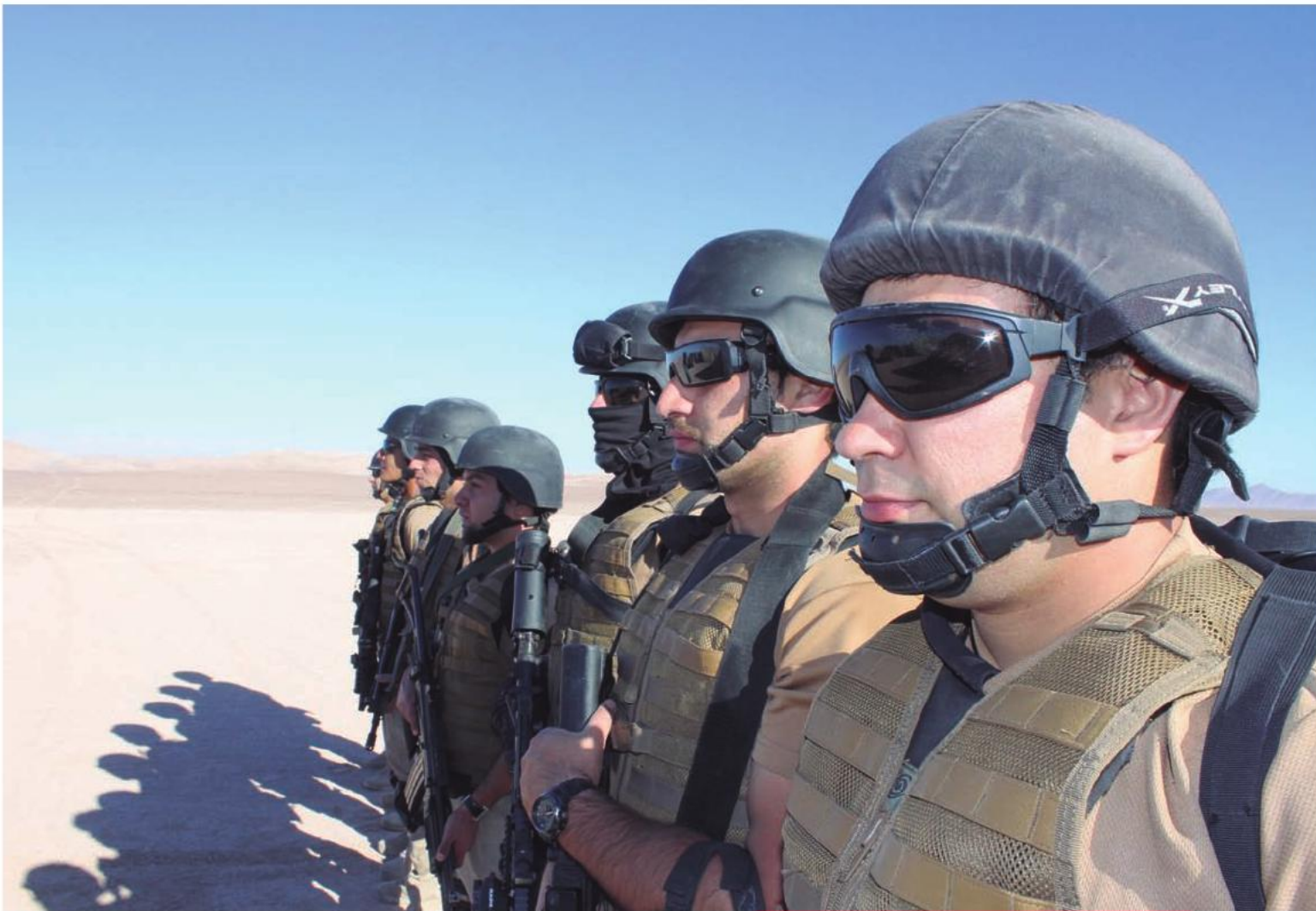
Plan Frontera Norte en la Región de Antofagasta.

nen como finalidad fortalecer las instalaciones, procurando un control de frontera más eficiente y eficaz, pero que al mismo tiempo posea las condiciones laborales adecuadas para el trabajo del personal de Carabineros, Policía de Investigaciones (PDI), Servicio Agrícola y Ganadero (SAG) y Aduanas. Los trabajos consideran una inversión de más de 700 millones de pesos y se contempla que estén terminados en los primeros meses de 2014.