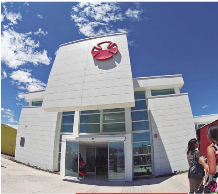
Nuevo Centro Teletón de Calama, inaugurado el 24 de septiembre de 2013.