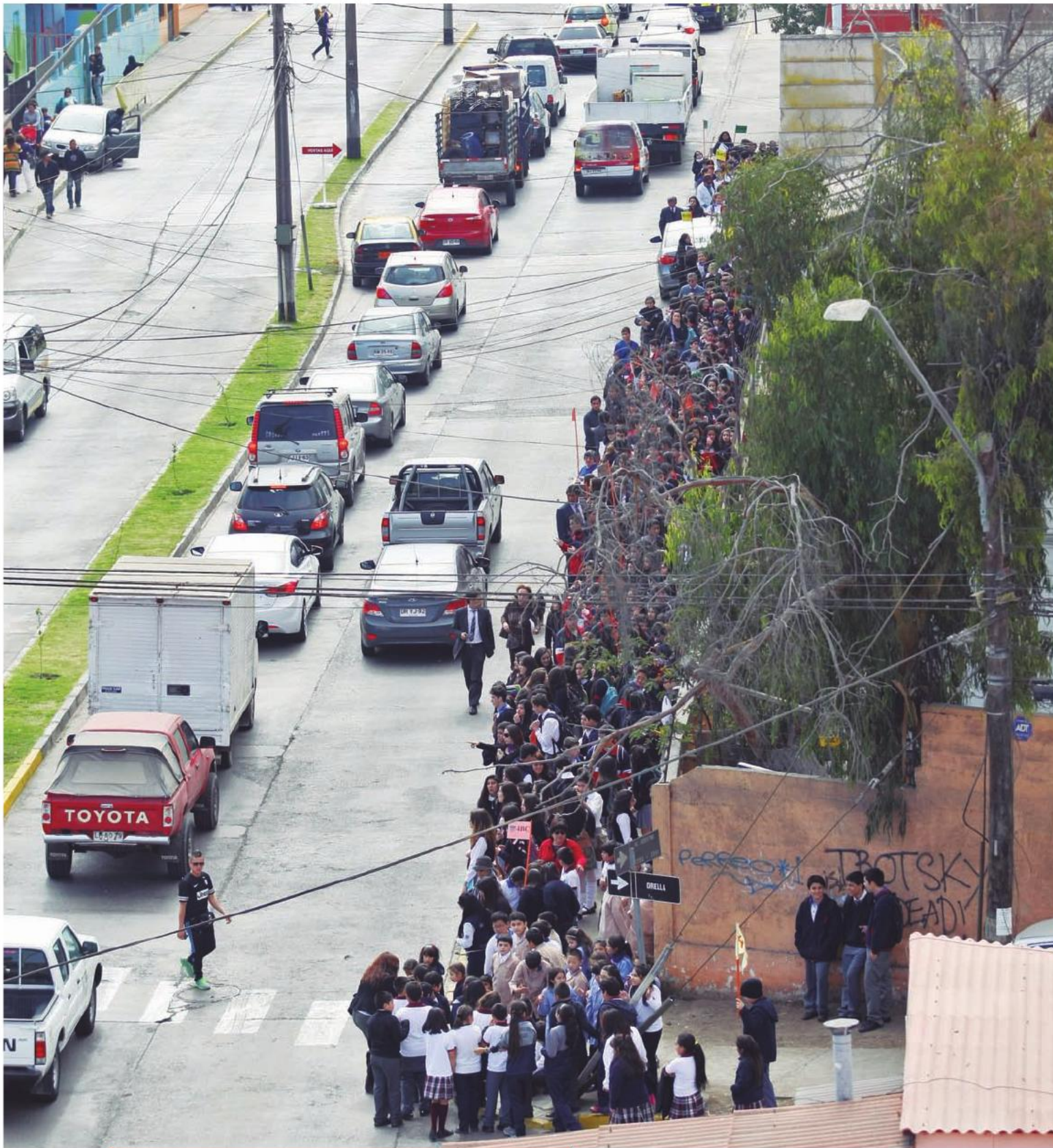
Más de 100 mil personas participaron del simulacro de terremoto y tsunami en la Región de Antofagasta. 8 de agosto de 2013.