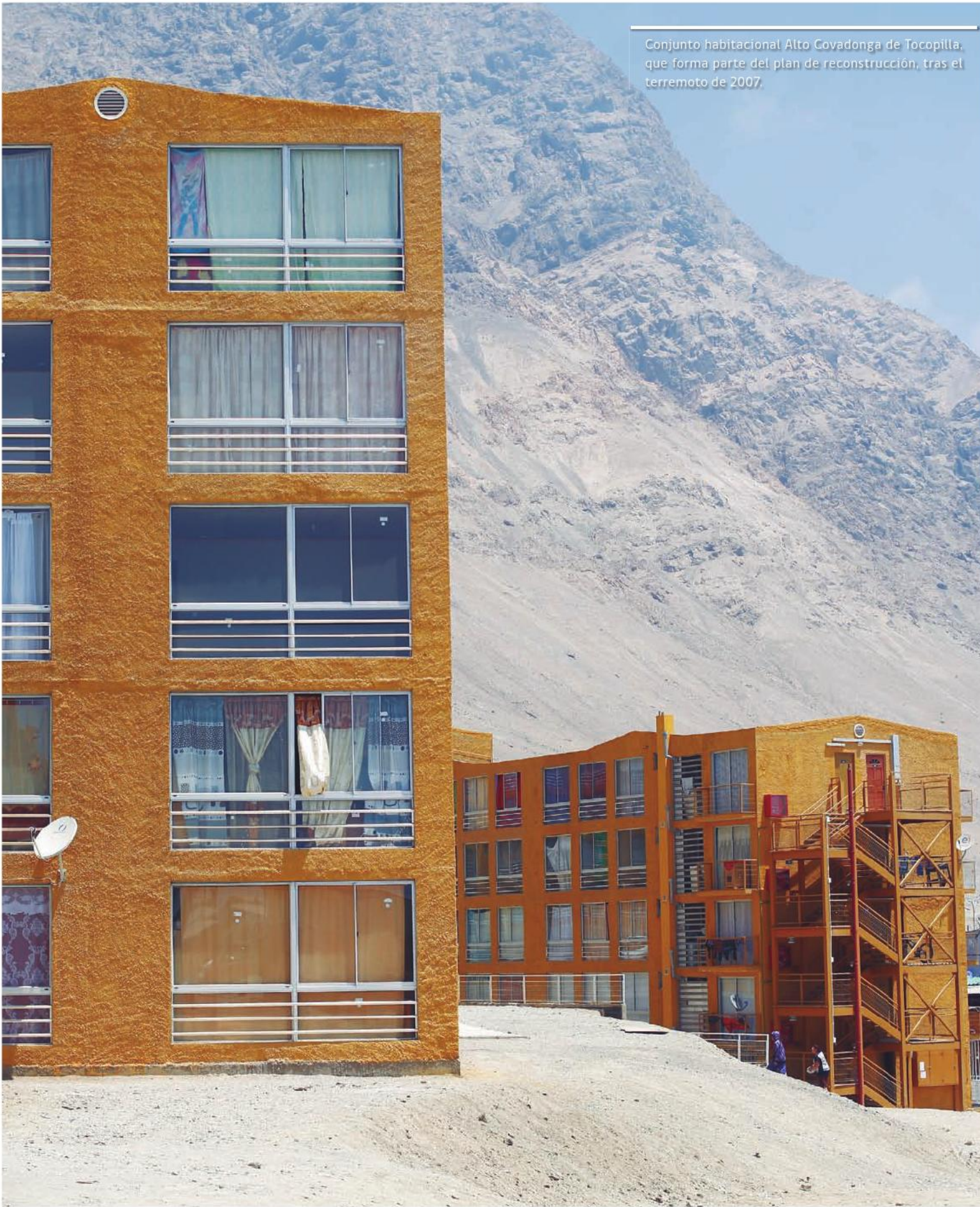
Conjunto habitacional Alto Covadonga de Tocopilla, que forma parte del plan de reconstrucción, tras el terremoto de 2007.