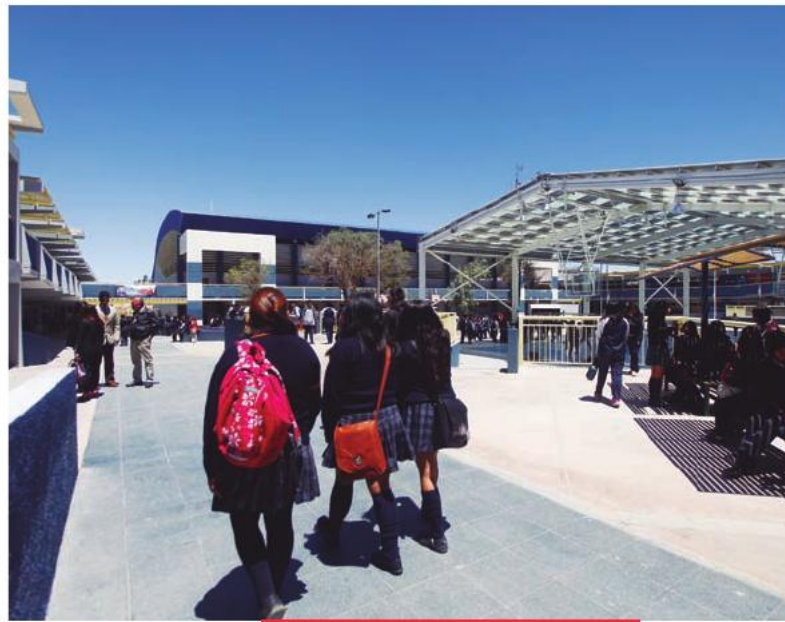
Nuevas instalaciones del Liceo B-8 Francisco de Aguirre de Calama.