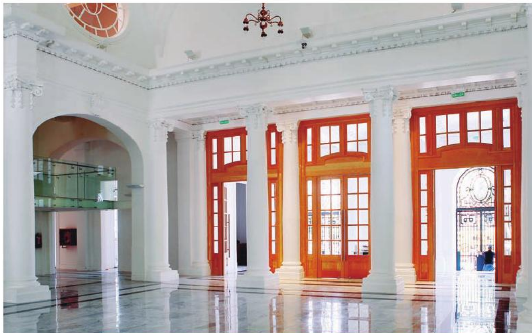
Biblioteca Regional de Antofagasta, uno de los edificios remodelados en el marco del Programa Legado Bicentenario.

invierno altiplánico. A eso se suma que sus instalaciones eléctricas y sanitarias no están debidamente normalizadas, lo que potencia el riesgo de incendios.