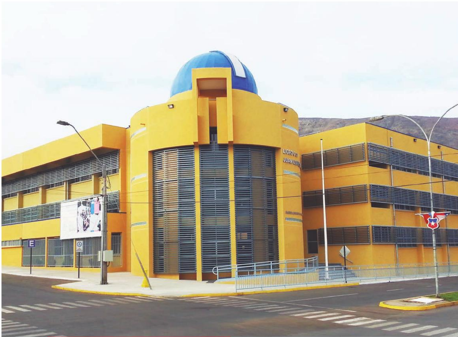
Nuevo Liceo C-21 Juan Cortés Monroy de Taltal, cuyas obras finalizaron en diciembre de 2013.

Asimismo, en la misma ciudad se construyó la nueva infraestructura para el Liceo La Chimba, inaugurado en julio de 2012, y que contó con una inversión de tres mil 820 millones de pesos y que tiene una capacidad para recibir a mil 350 alumnos.