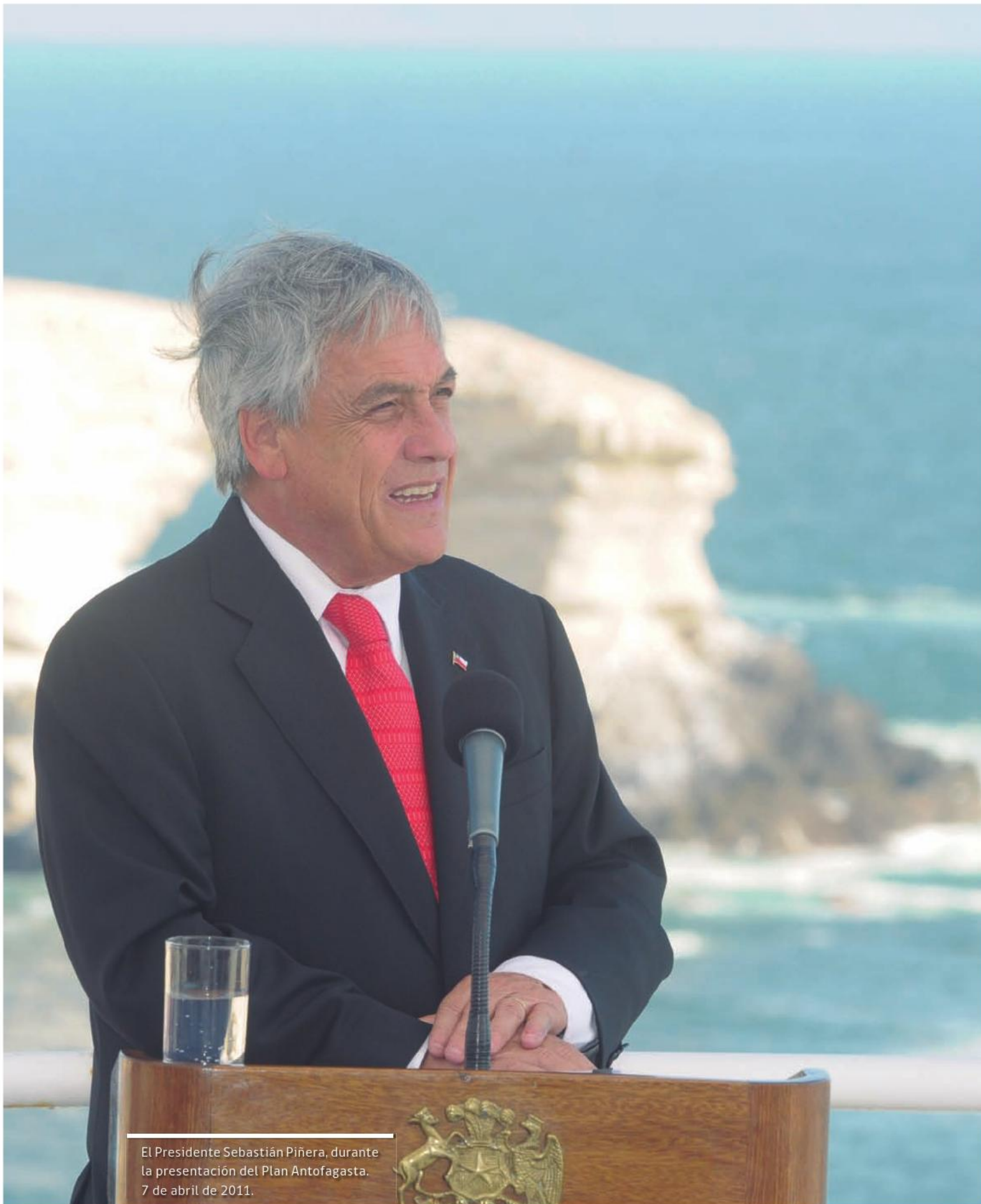
El Presidente Sebastián Piñera, durante la presentación del Plan Antofagasta. 7 de abril de 2011.