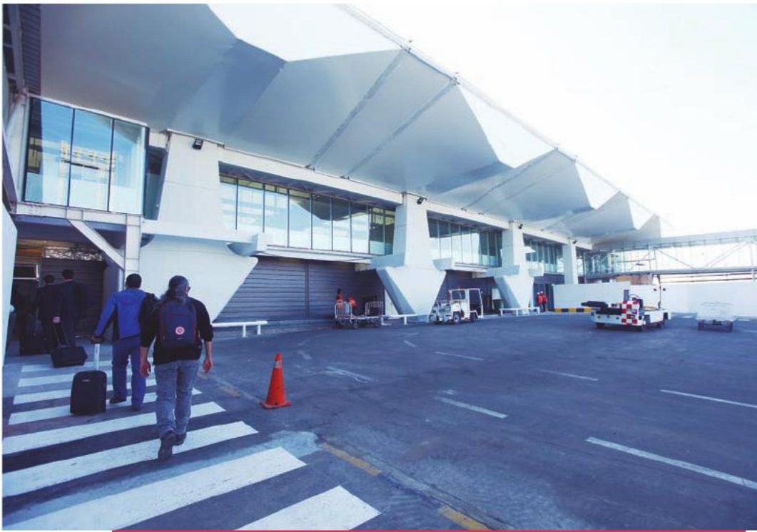
El nuevo edificio del terminal de pasajeros del Aeropuerto Cerro Moreno de Antofagasta aumentará su capacidad de atención, de 278 a 422 viajeros por hora.

2014. También se encuentran en ejecución las obras del nuevo Puente Coviefi en Avenida Argentina, que unirá la Ruta 28 con el sector de Jardines del Sur. Esta obra será entregada durante 2015 y contempla una inversión de ocho mil millones de pesos.