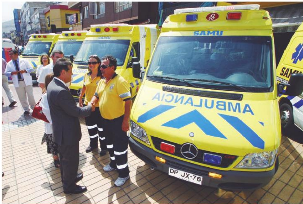
El Gobierno Regional de Antofagasta financió la entrega de doce nuevas ambulancias, destinadas a Taltal, Mejillones, Calama, Antofagasta y Tocopilla. 29 de febrero de 2012.

A su vez, se encuentran en ejecución los Cesfam Central de Calama y Valdivieso Norte en Antofagasta. Ambos contemplan 21 boxes multipropósito, tres ginecológicos, seis dentales y sala de rehabilitación y estimulación temprana, contando, también, con sala de urgencias. Estos Cesfam deben ser entregados durante el primer trimestre de 2014.