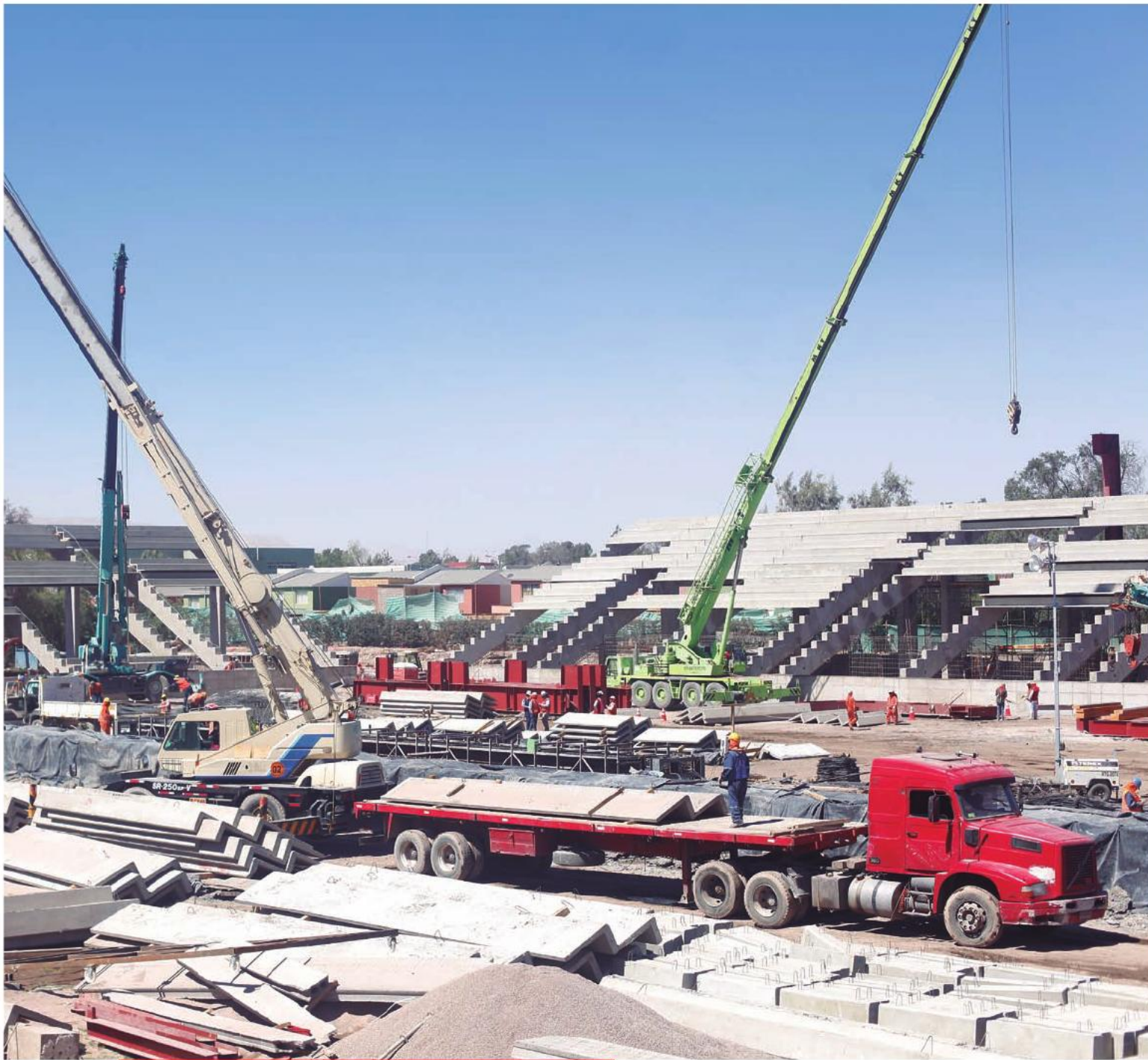
Obras del nuevo Estadio Municipal de Calama, cuya inauguración está contemplada para marzo de 2014.