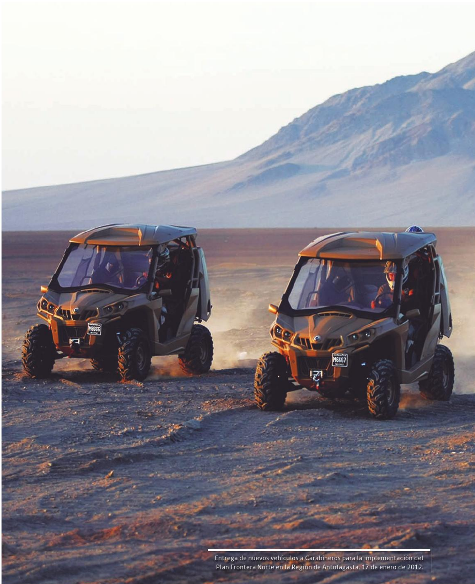
Entrega de nuevos vehículos a Carabineros para la implementación del Plan Frontera Norte en la Región de Antofagasta, 17 de enero de 2012.