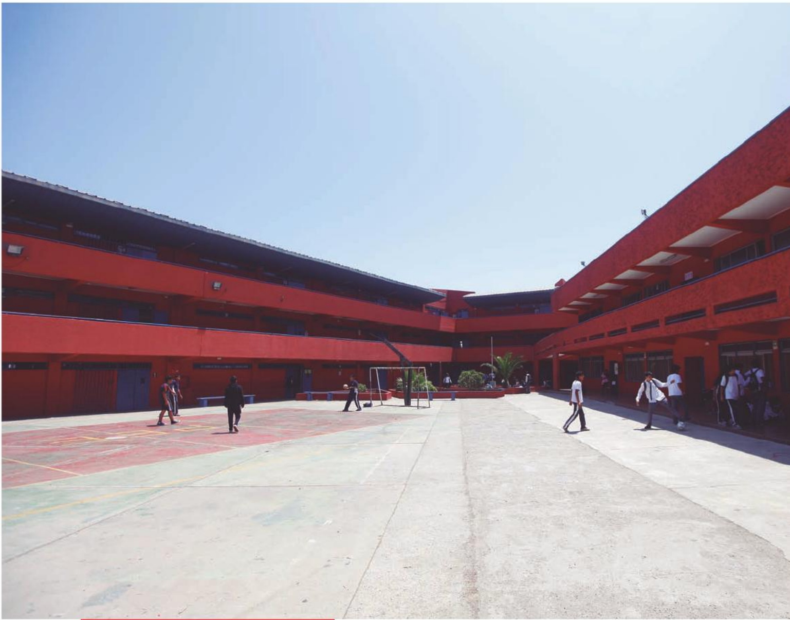
Nuevo Liceo Bicentenario de Excelencia Andrés Sabella de Antofagasta.

“En los últimos tres años el presupuesto público de educación pasó de ocho mil 900 a 13 mil 100 millones de dólares. En dólares, un incremento cercano al 50 por ciento. Y en los últimos tres años hemos hecho profundas reformas a la gestión de nuestro sistema educacional, para que esa combinación de más recursos y mejor gestión permita alcanzar la meta de garantizarles a nuestros niños y jóvenes una educación de calidad”.