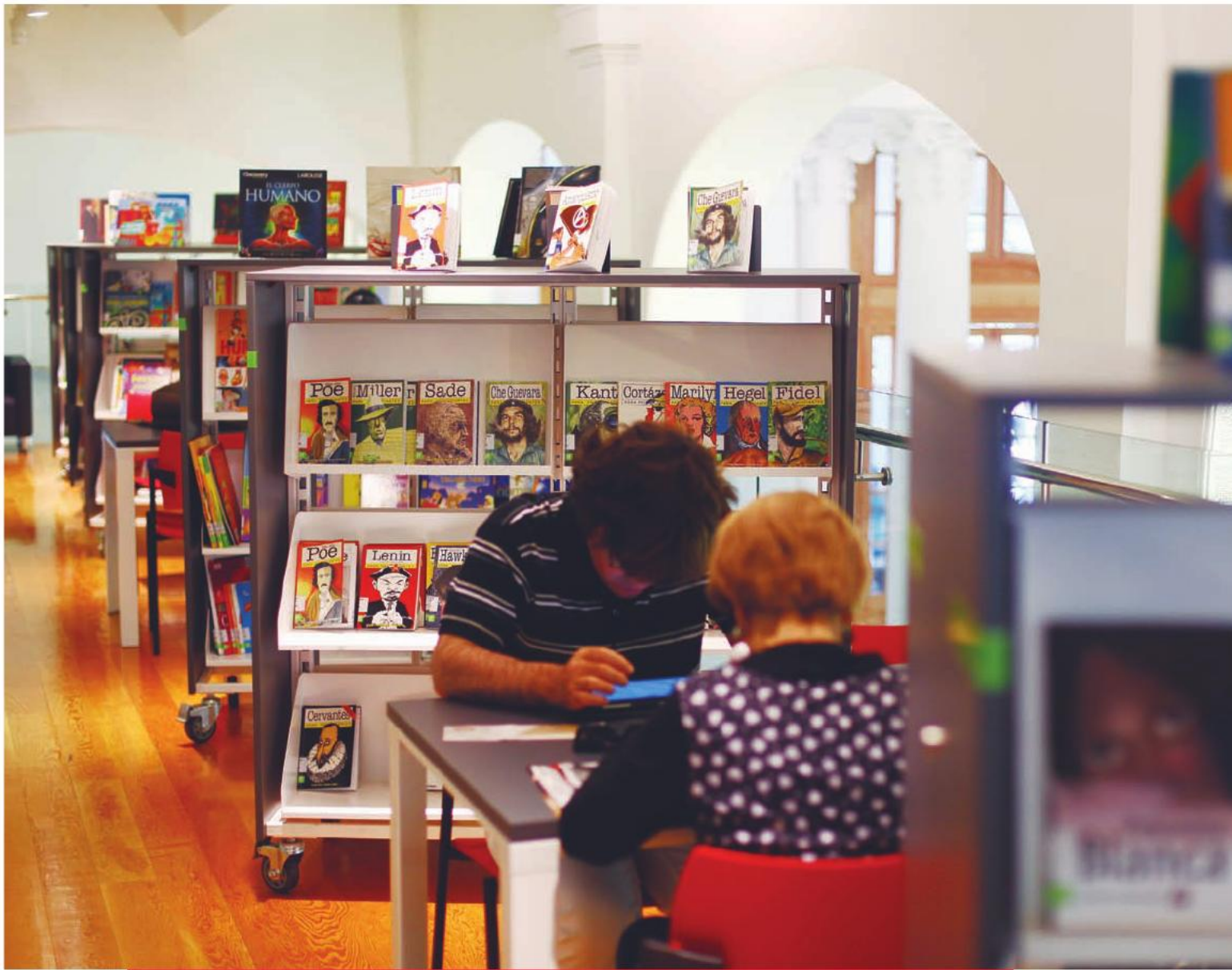
La restaurada Biblioteca Regional de Antofagasta, que también forma parte del Programa Legado Bicentenario, fue reinaugurada el 14 de noviembre de 2013.

Esta bella estructura patrimonial, que representa un orgullo para la región, fue recuperada luego de dos años de trabajo y su intervención implicó la protección del valor arquitectónico y patrimonial del inmueble, potenciándolo como uno de los sitios más hermosos de la ciudad. Contempla un espacio de tres mil 250 metros cuadrados, que se distribuyen en tres pisos, donde se almacenan las distintas colecciones dirigidas a todo tipo de público. Esta biblioteca se trata de la más grande y moderna del país, y sus instalaciones cuentan con sala infantil, sala juvenil, sala de la memoria, sala de literatura y de colecciones generales, además de áreas de exposiciones y auditorio.