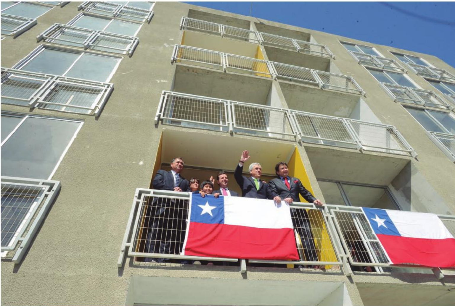
El Presidente Sebastián Piñera, al entregar 440 departamentos en el sector Fertilizantes, de Mejillones. 23 de julio de 2013.

“Estos nuevos condominios, además de viviendas, tienen áreas deportivas, una sede social y áreas verdes, porque más importante que las 440 viviendas que hoy estamos inaugurando, son las familias que van a formar un nuevo hogar”.