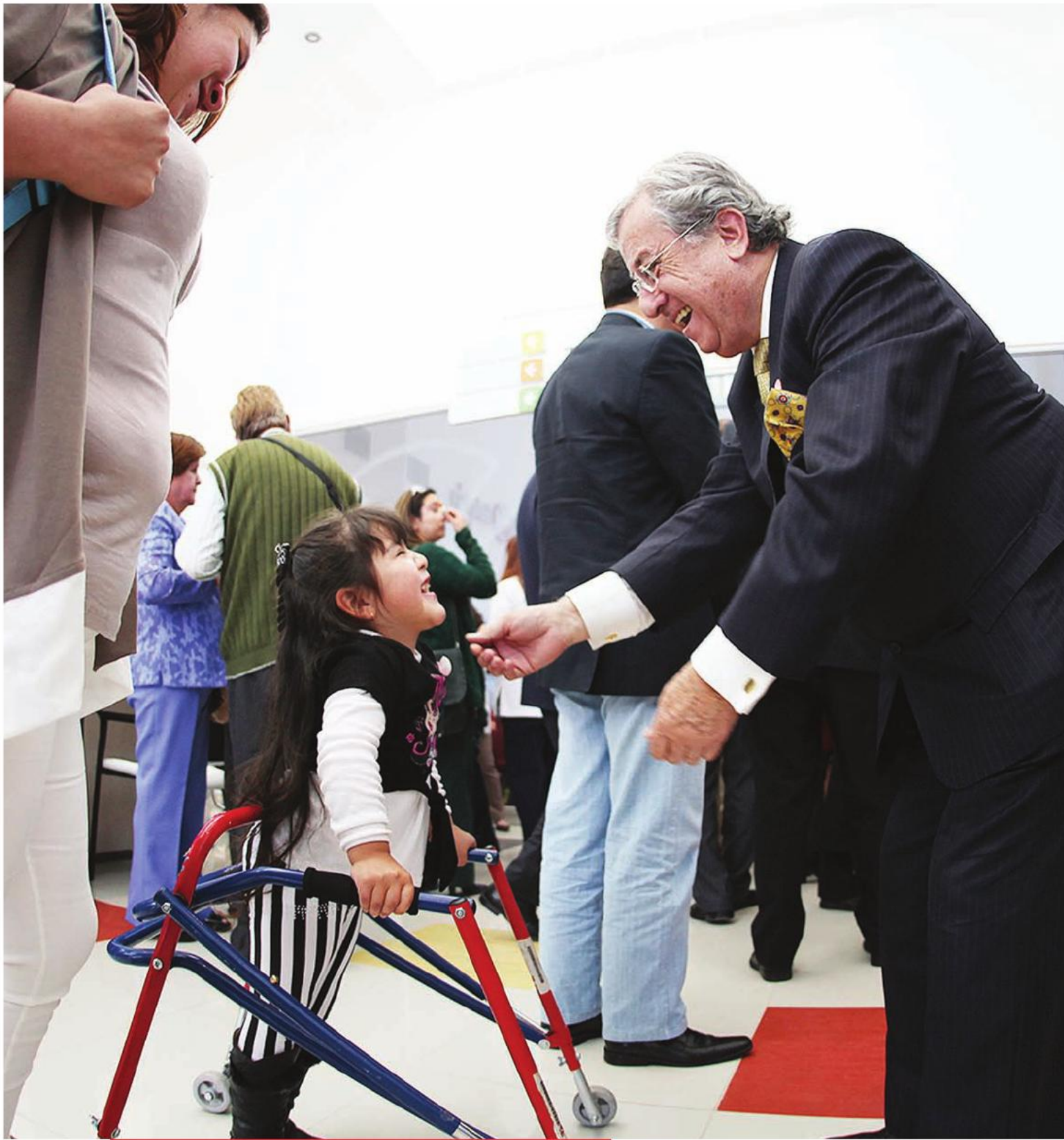
El intendente regional Waldo Mora encabezó la inauguración del nuevo Centro Teletón de Calama. 24 de septiembre de 2013.