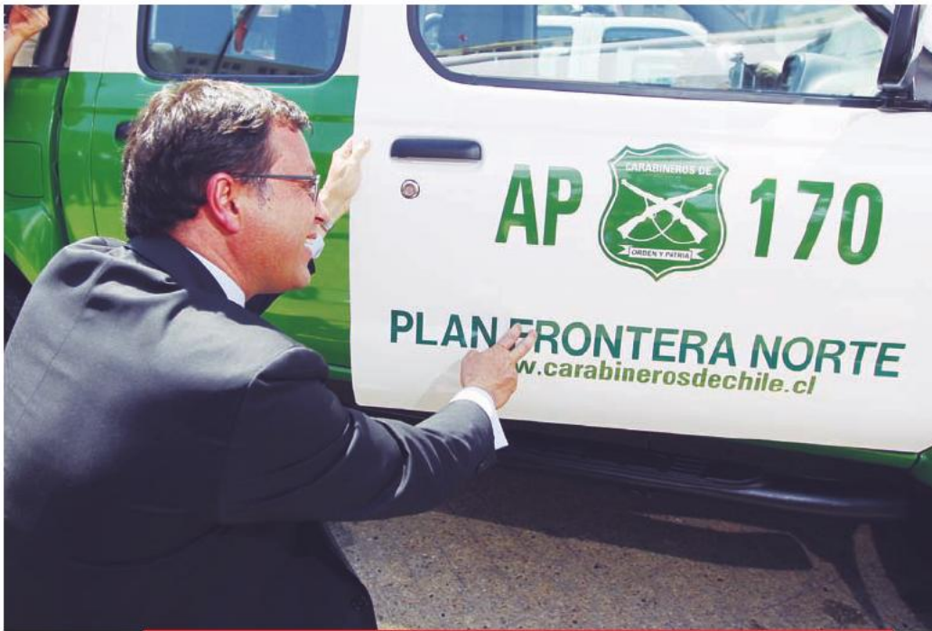
El entonces ministro del Interior y Seguridad Pública, Rodrigo Hinzpeter, encabezó la ceremonia de entrega de implementos a Carabineros, en el marco del Plan Frontera Norte. 28 de diciembre de 2011.

“La misión del Plan Frontera Norte es simple pero muy importante: combatir el crimen organizado y el narcotráfico. El objetivo es evitar que ingrese droga a nuestro país, evitar que salga de nuestros puertos, el contrabando de bienes robados en nuestras fronteras y evitar que de nuestro país salgan precursores químicos que permitan la elaboración de las drogas en países vecinos”.