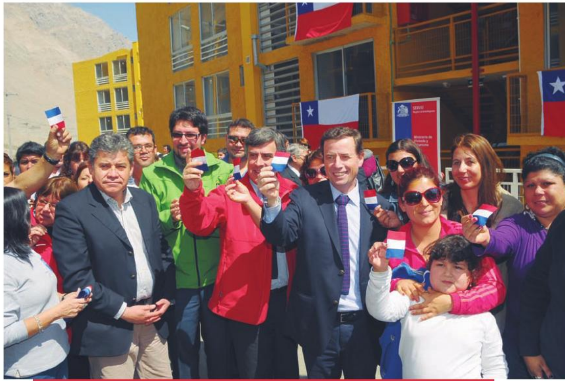
El Ministro de Vivienda y Urbanismo, Rodrigo Pérez, durante la entrega de 150 departamentos del proyecto habitacional Alto Covadonga. 26 de agosto de 2013.

la creación de un total de 500 departamentos de 55 metros cuadrados y 120 de estas viviendas adicionales, destinadas para los allegados regulares de los barrios transitorios.