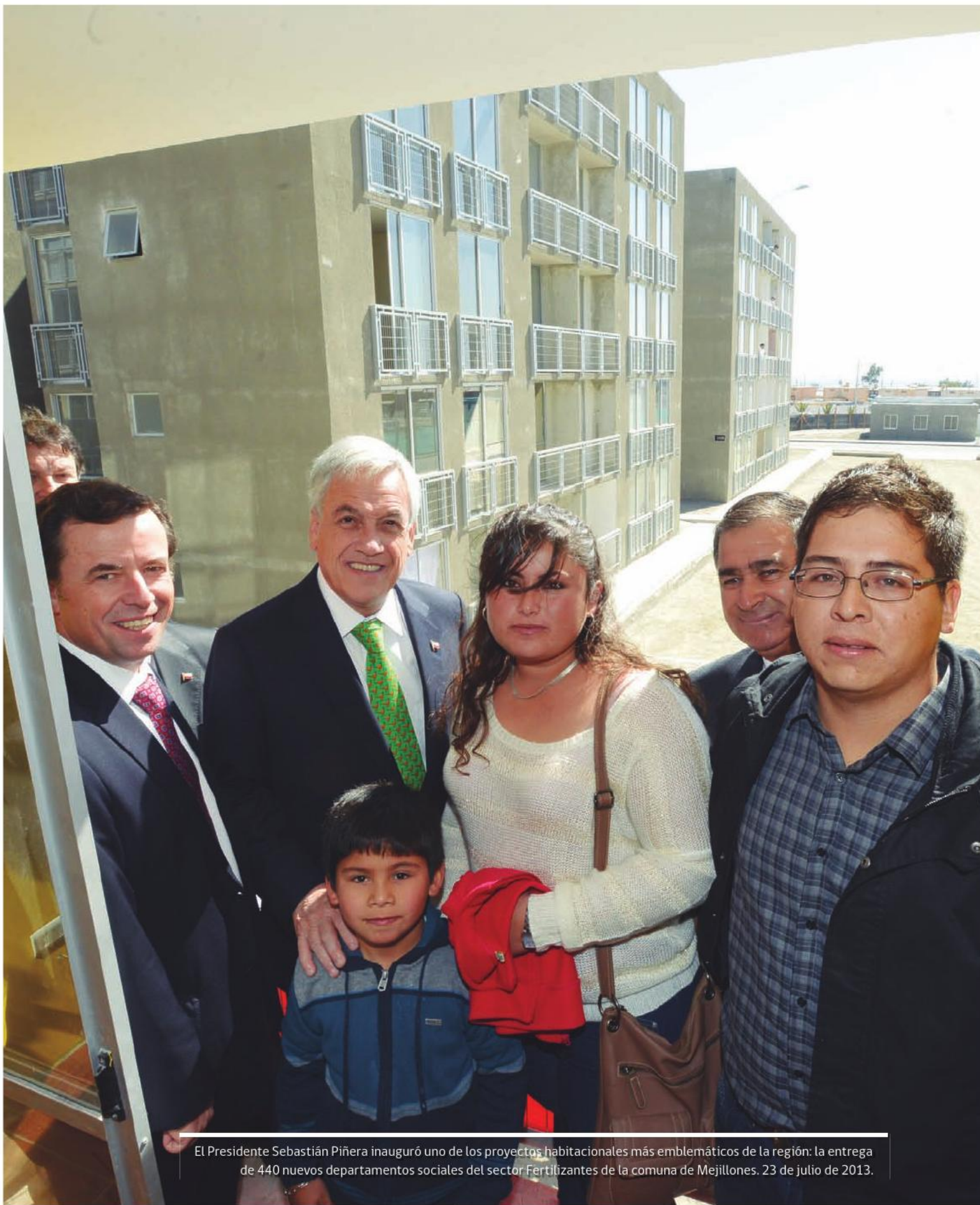
El Presidente Sebastián Piñera inauguró uno de los proyectos habitacionales más emblemáticos de la región: la entrega de 440 nuevos departamentos sociales del sector Fertilizantes de la comuna de Mejillones. 23 de julio de 2013.