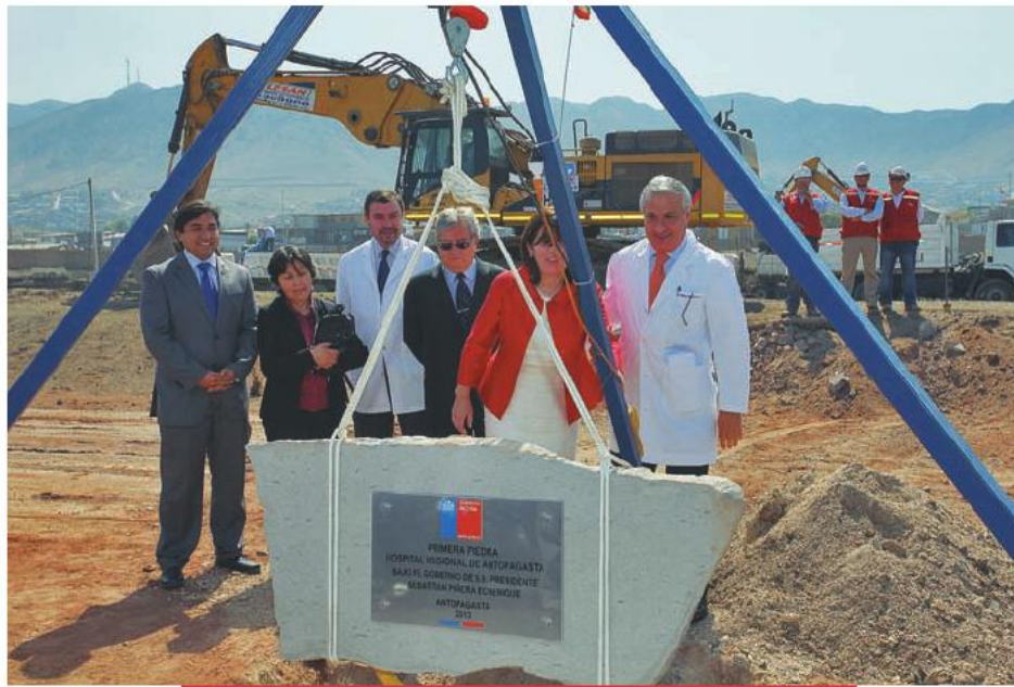
El ministro de Salud, Jaime Mañalich; el intendente regional, Waldo Mora, y autoridades locales, durante la ceremonia de instalación de la primera piedra del nuevo Hospital Regional de Antofagasta. 12 de noviembre de 2013.

“Este hospital debe inaugurarse en el primer semestre de 2017; la inversión comprometida se acerca a los 300 millones de dólares, con un recinto de aproximadamente 120 metros cuadrados, que da una solución global a todas las necesidades del norte del país, transformándose en un ente autónomo donde se pueden hacer tratamientos de cáncer, neurocirugía, cardiocirugía y neonatología de alto nivel, y se integrará a la red de atención primaria de la región y a los otros hospitales que se han inaugurado o están construyéndose en la región”.