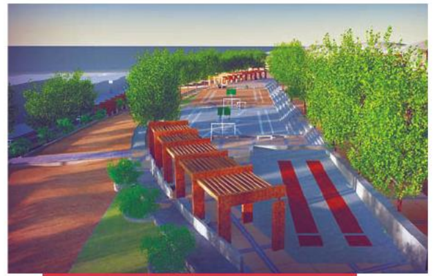
Diseño del nuevo Centro Recreacional Villa Esperanza de Antofagasta.