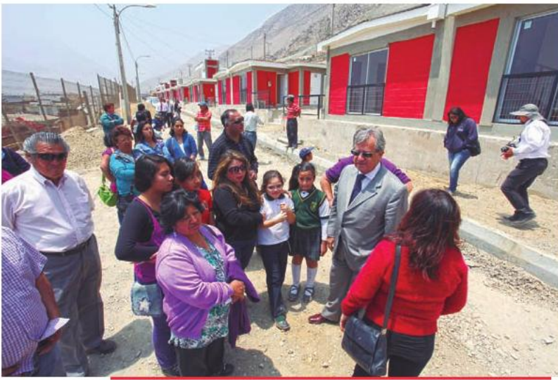
El intendente de Antofagasta, Waldo Mora, realiza la entrega de viviendas del conjunto habitacional Huella Tres Puntas de Tocopilla. 21 de octubre de 2013.

“Estoy feliz, imagínese todo lo que hemos esperado y luchado por el departamento, ahora nos podremos ir a vivir con mi hijo y hacer una nueva vida. Se nos hizo realidad el sueño de la casa propia, estamos muy agradecidos de este gobierno”.