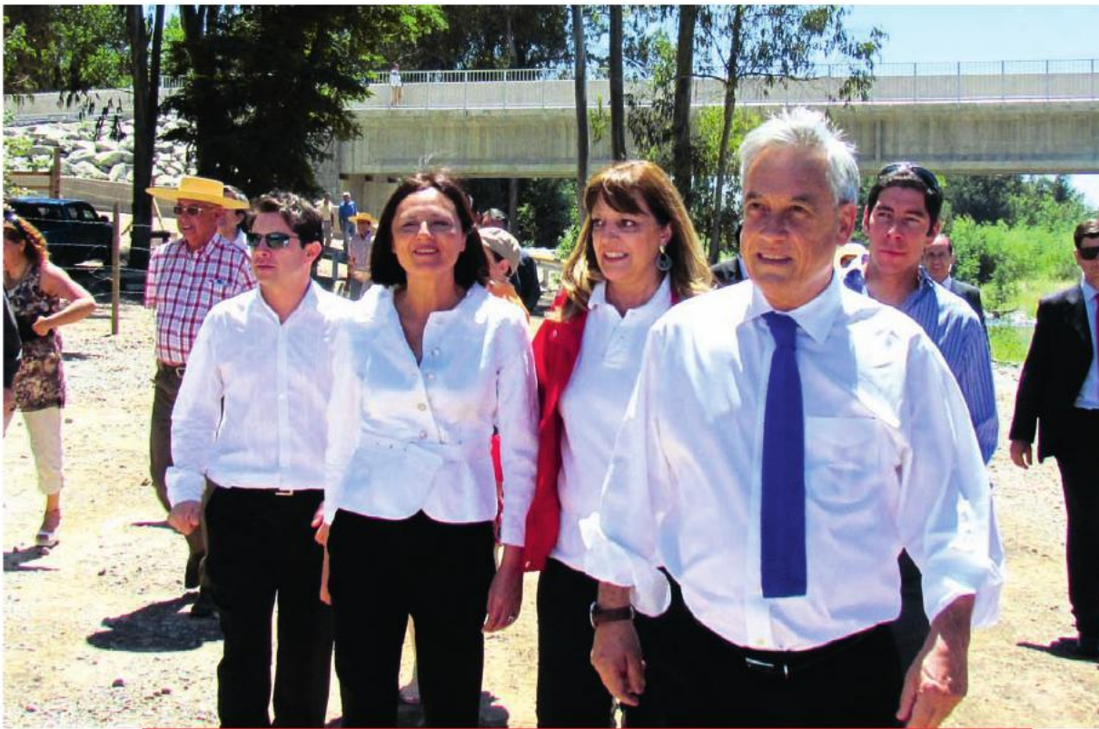
El Presidente de la República, Sebastián Piñera, junto a la ministra de Obras Públicas, Loreto Silva, encabezó la ceremonia de inauguración del nuevo puente San Camilo. 9 de enero de 2013.

“Estamos orgullosos de que este nuevo puente San Camilo no solamente sea una obra más, sino que sea el reflejo de un real cambio en la calidad de vida de todos los que viven en este sector”.