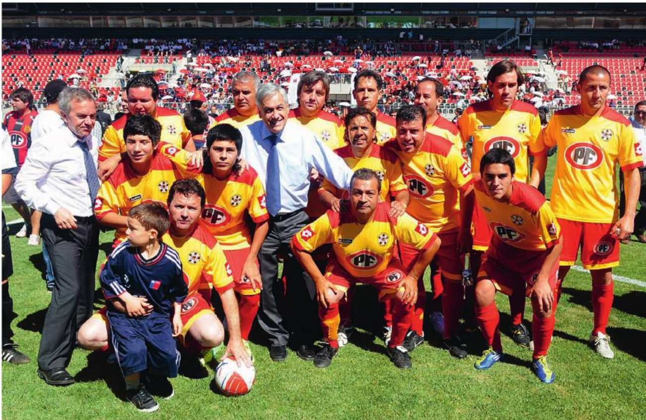
Nuevo estadio Fiscal de Talca, inaugurado por el Presidente Sebastián Piñera. 20 de diciembre de 2011.

“Para nosotros, el hacer de Chile un país de deportistas es tan importante como lograr que Chile sea un país desarrollado, porque al fin y al cabo lo importante no es solamente el crecimiento económico, lo importante es el desarrollo integral”.