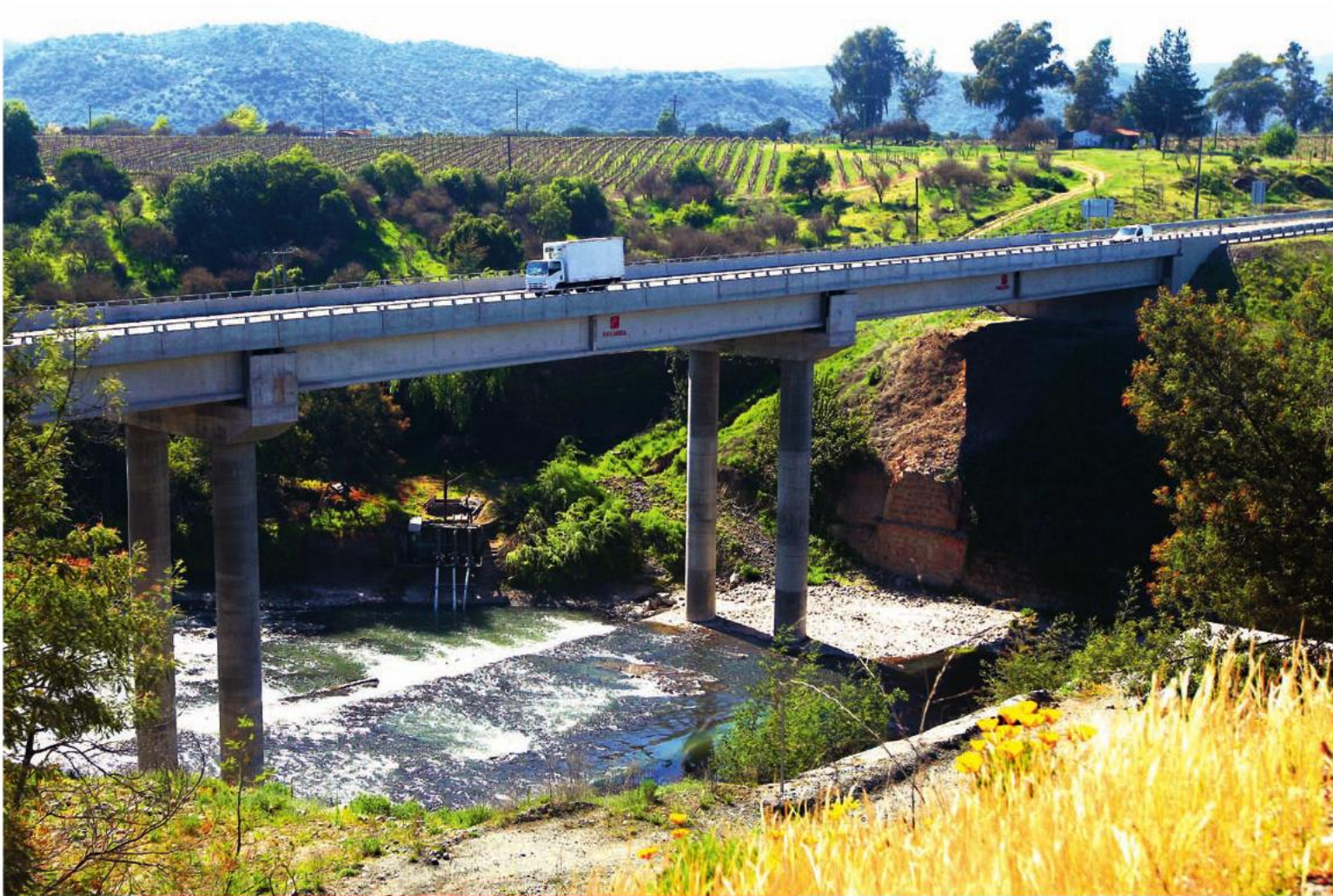
Vista del nuevo puente sobre el río Claro, inaugurado el 1 de junio de 2012.