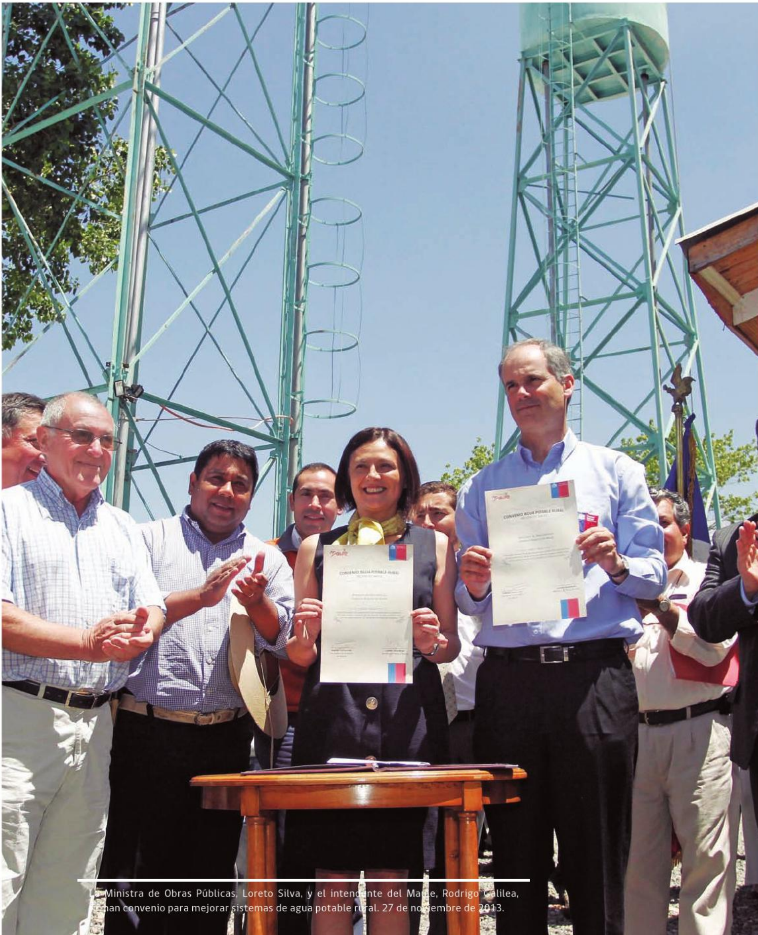
La Ministra de Obras Públicas, Loreto Silva, y el intendente del Maipo, Rodrigo Calilea, firman convenio para mejorar sistemas de agua potable rural. 27 de noviembre de 2013.