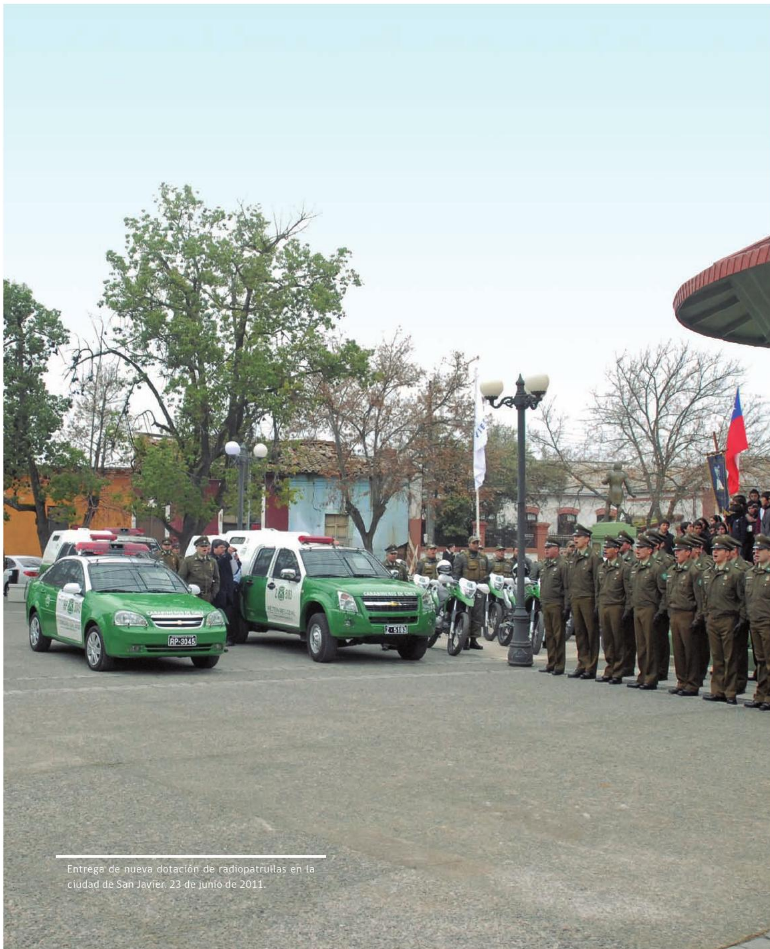
Entrega de nueva dotación de radiopatrullas en la ciudad de San Javier. 23 de junio de 2011.