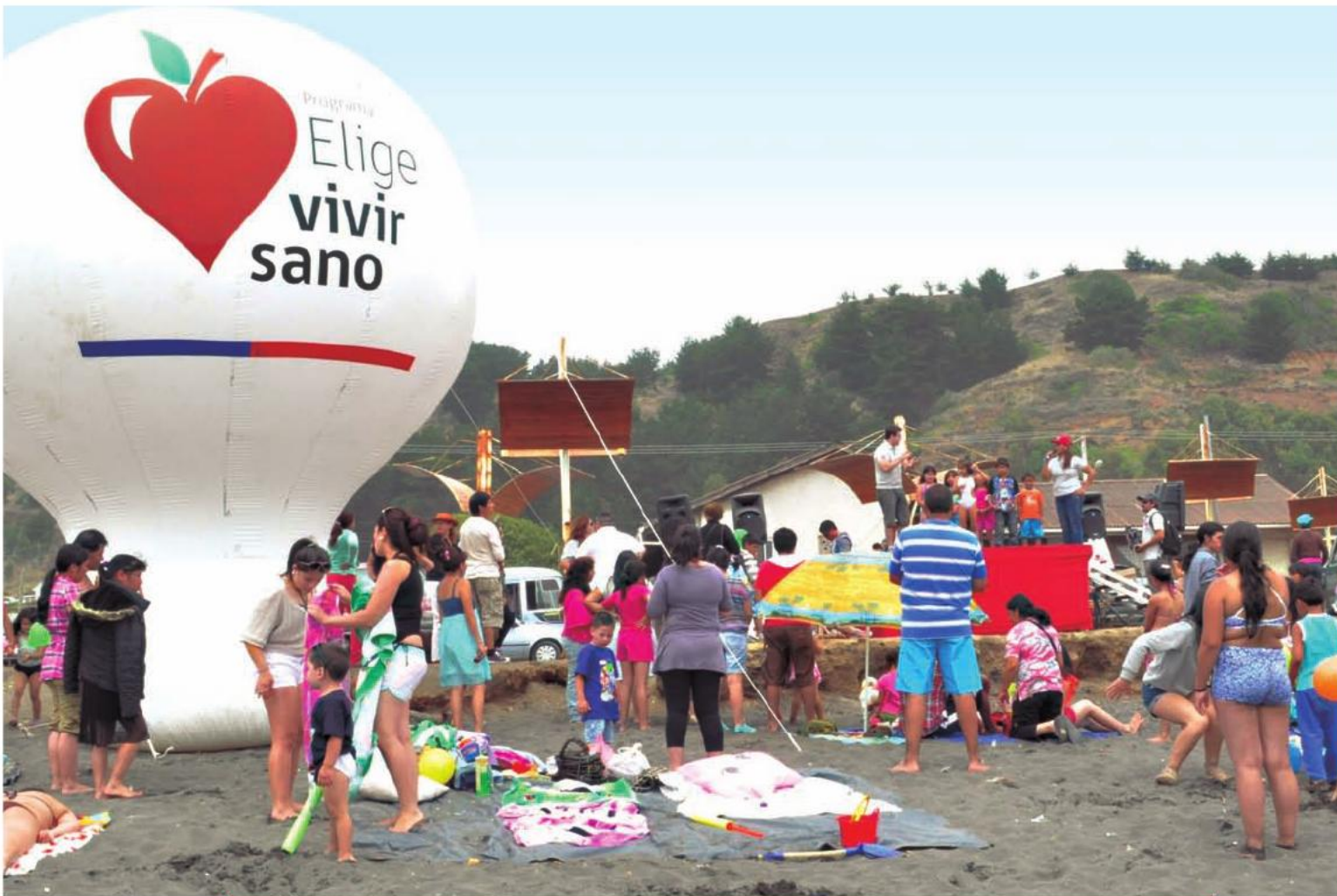
Gracias al Programa Elige Vivir Sano, miles de veraneantes disfrutaron con las actividades que la Seremi de Salud realizó en las playas de Constitución, Iloca y Pelluhue. 30 de enero de 2013.

“Mejorar la salud y los hábitos de vida de los chilenos fue uno de nuestros grandes objetivos, pasar desde una cultura del sedentarismo y la enfermedad a una cultura de la vida sana y la prevención. Con este mensaje llegamos a cada rincón de Chile, recorrimos el país de norte a sur y los chilenos supieron hacerlo suyo. Hoy son más las personas que se alimentan mejor, hacen actividad física, disfrutan del aire libre y de sus familias, en un camino que espero se profundice con el tiempo”.