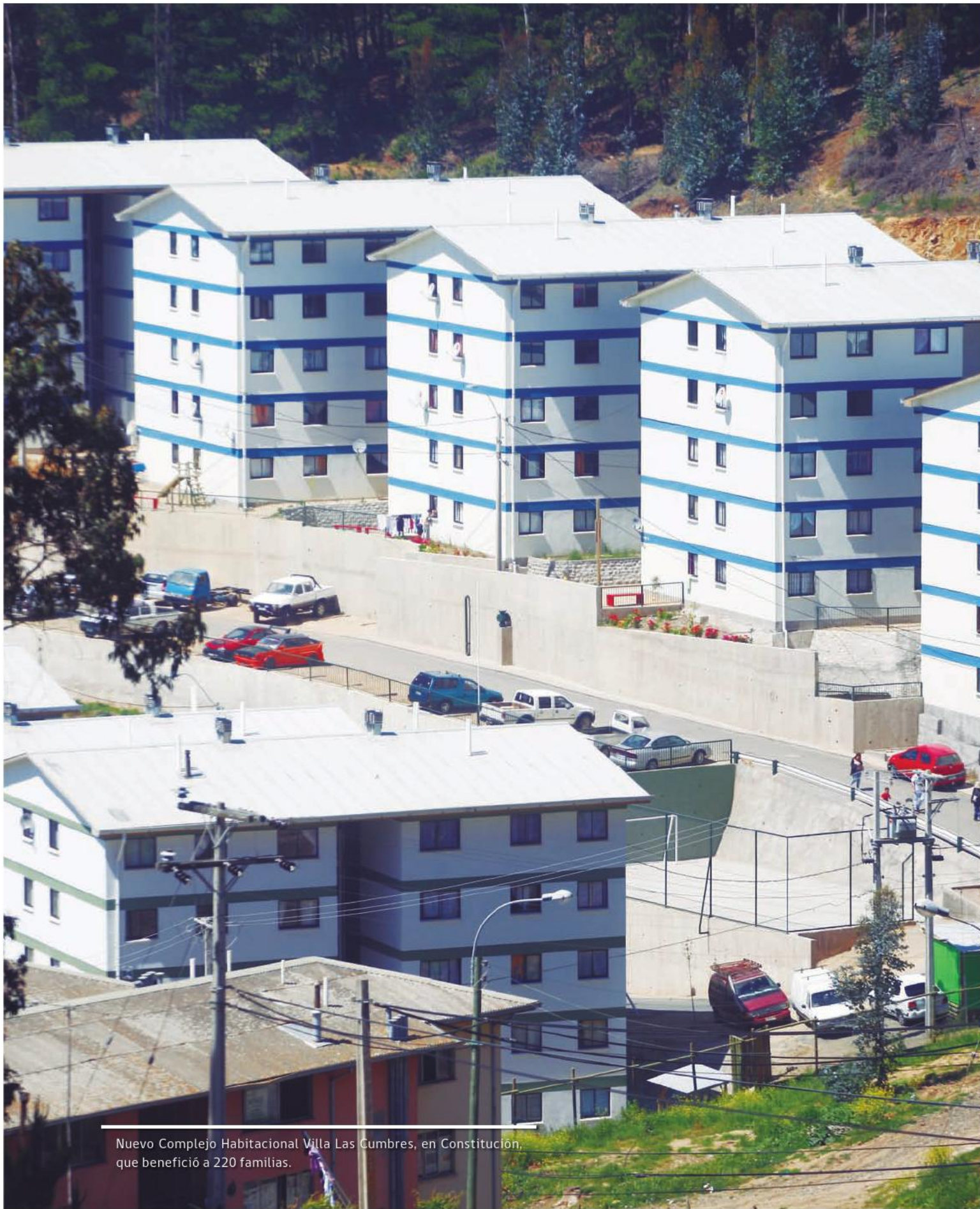
Nuevo Complejo Habitacional Villa Las Cumbres, en Constitución, que benefició a 220 familias.