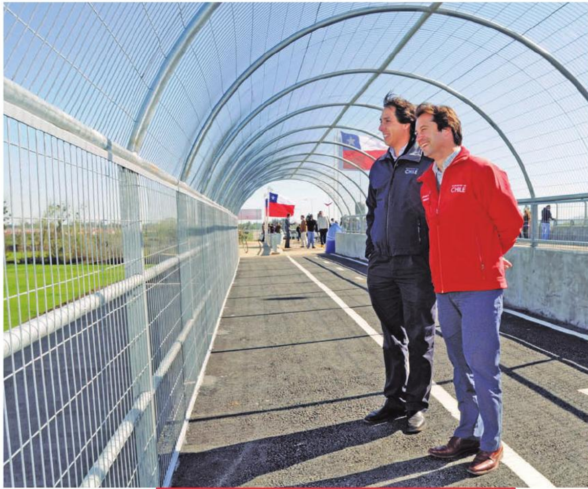
El subsecretario de Obras Públicas, Lucas Palacios, inauguró la nueva circunvalación exterior norte de Linares. 12 de septiembre de 2013.

“Esta nueva circunvalación cumple con lo que nos ha pedido el Presidente Piñera, entregar una solución vial que les mejorará la calidad de vida a los más de 90 mil habitantes de Linares”.