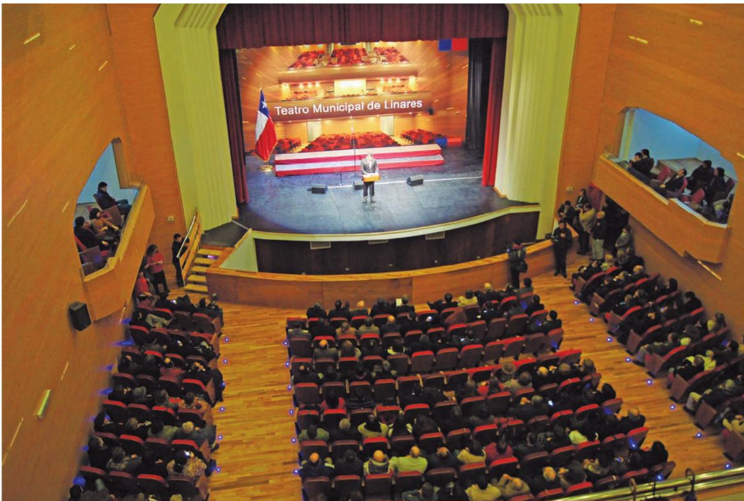
El remodelado Teatro Municipal de Linares tiene capacidad para 702 espectadores. 5 de julio de 2013.

“La Región del Maule está empeñada en tener una muy buena red de teatros. Y así como tenemos el Teatro Regional en Talca, el de San Javier, el de Parral y el de Molina, y vamos a iniciar los de Constitución y de Curicó, hoy hemos reinaugurado el Teatro Municipal de Linares, que cuenta con todas las condiciones para que se puedan desarrollar espectáculos de primer nivel”.