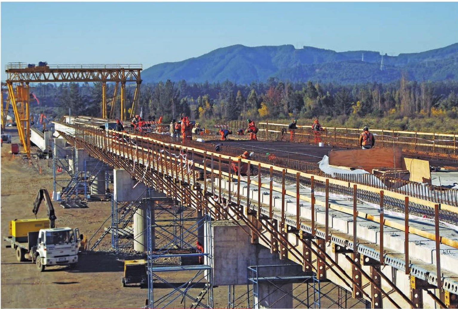
Trabajos de construcción del nuevo puente sobre el río Maule, cuya entrega se proyecta para el segundo semestre de 2014.

Este corredor bioceánico conlleva positivas consecuencias para el desarrollo de la región. Uno de los principales atractivos de contar con un paso internacional pavimentado y con características de ruta de alto estándar vial, es el aumento de turistas, lo que permite un mayor desarrollo para la industria del sector a nivel regional.