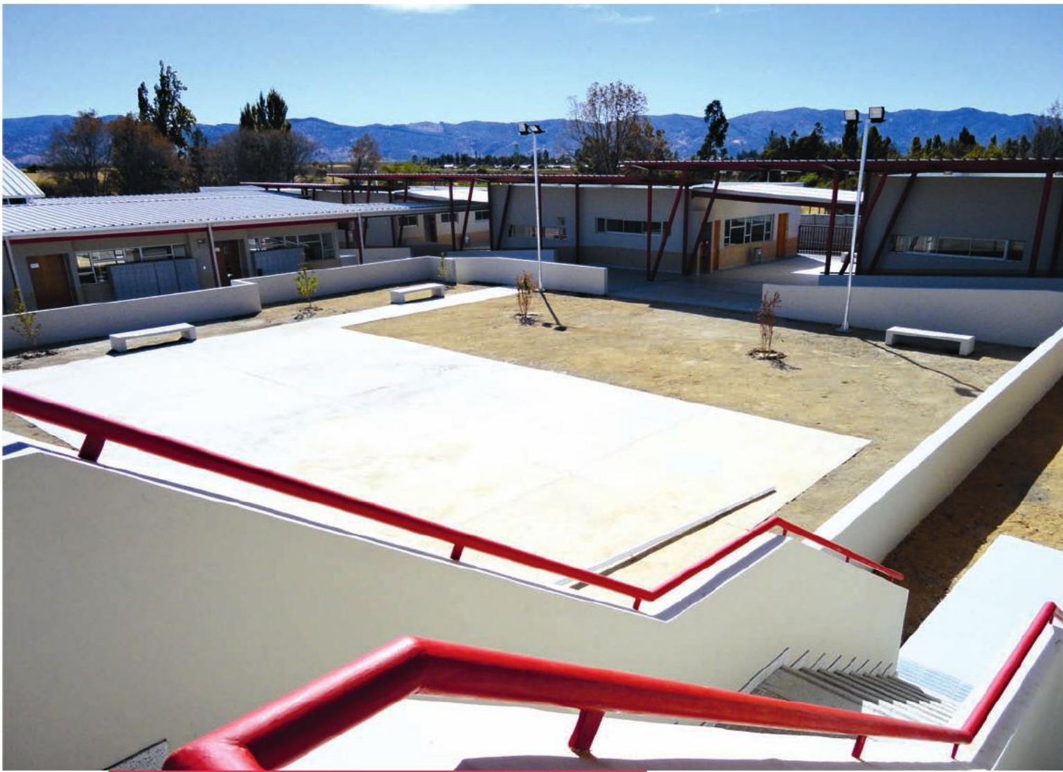
El Complejo Educacional Péncahue formó parte del proceso de reposición de establecimientos de la Región del Maule, tras el terremoto de 2010.

en comparación con la misma prueba de 2008. Los resultados del Simce de segundo medio de 2012 indican que la región tuvo un promedio de 259 puntos en la prueba de Matemáticas, lo que representó un aumento de 13 puntos respecto de 2008, y un promedio de 257 puntos en la prueba de Lenguaje, un aumento de siete puntos respecto de 2008.