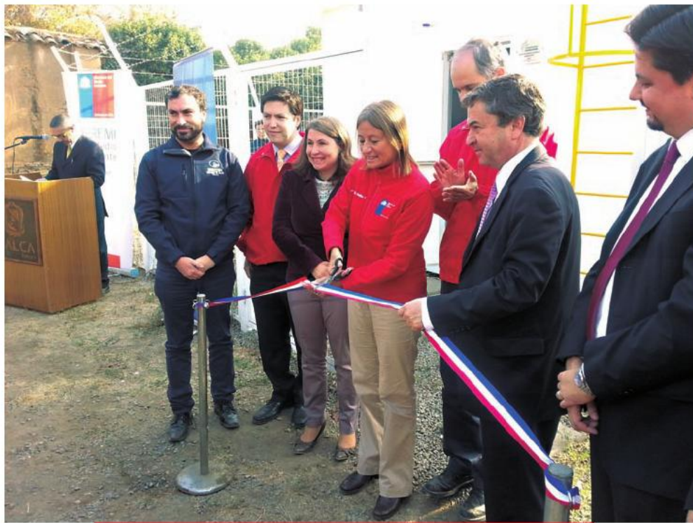
La ministra de Medio Ambiente, María Ignacia Benítez, inaugurando la nueva estación de monitoreo en Talca. 25 de abril de 2013.

Finalmente, no basta sólo con edificios y equipamientos de última generación. Esto debe ir acompañado con un mejoramiento del nivel profesional de estos recintos, lo que implica renovación, capacitación y formación permanente en diferentes ámbitos de la atención y posibilidades de desarrollo para los profesionales. En ese sentido, el 10 de mayo de 2013 se llevó a cabo el lanzamiento de un proyecto de formación de especialistas médicos en la región, elaborado por la Universidad Católica del Maule, el Servicio de Salud del Maule y la Corporación de Desarrollo Productivo. Esta iniciativa contempla formar a 100 especialistas médicos entre 2013 y 2018 exclusivamente para la región, considerando una inversión aproximada de 11 mil 500 millones de pesos.