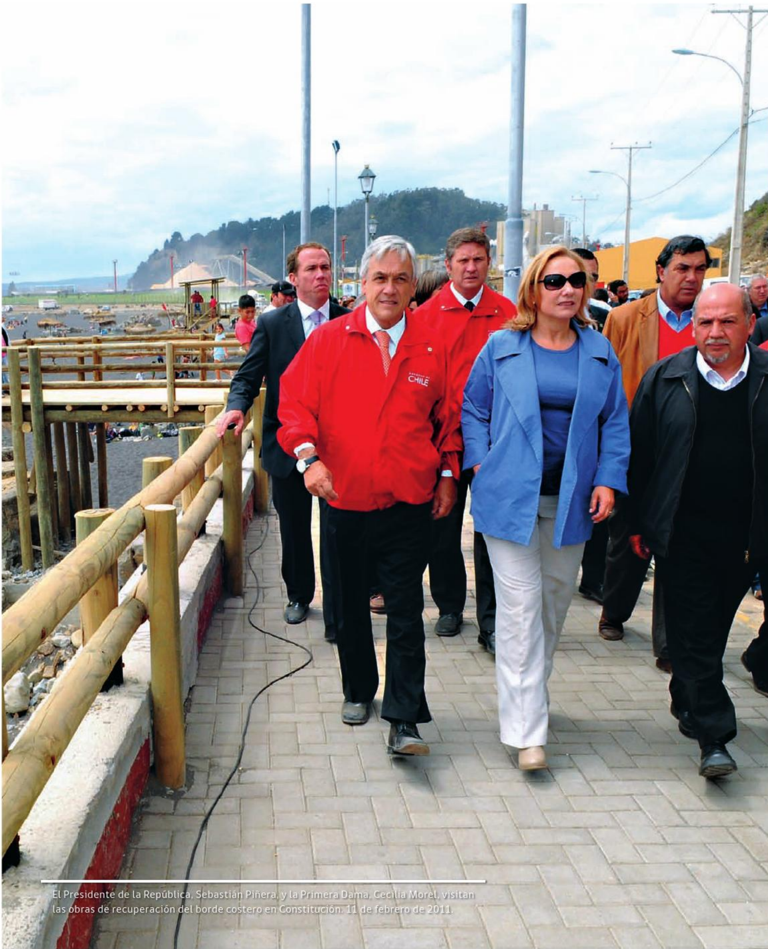
El Presidente de la República, Sebastián Piñera, y la Primera Dama, Cecilia Morel, visitan las obras de recuperación del borde costero en Constitución. 11 de febrero de 2011.