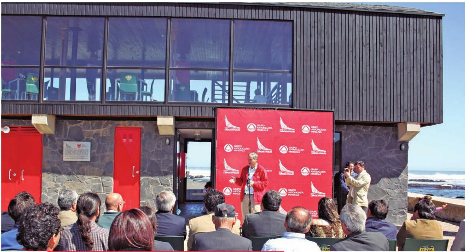
El intendente del Maule, Rodrigo Galilea, durante la inauguración de la nueva caleta Pellines, parte del proyecto Ruta Caletas del Maule, obra del Programa Legado Bicentenario. 21 de abril de 2011.