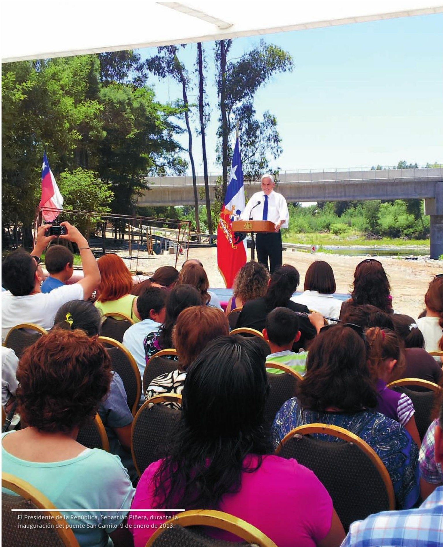
El Presidente de la República, Sebastián Piñera, durante la inauguración del puente San Camilo. 9 de enero de 2013.