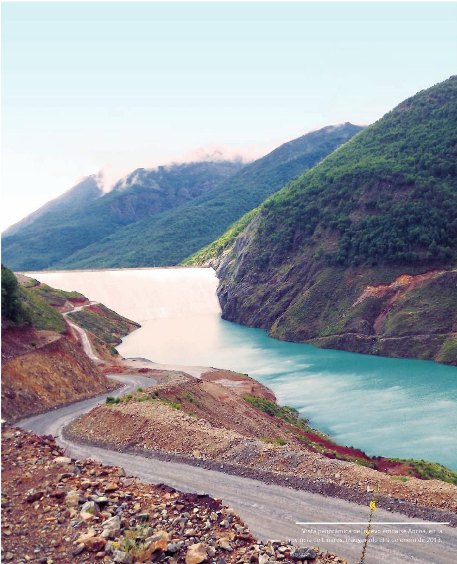
Vista panorámica del nuevo embalse Ancoa, en la Provincia de Linares, inaugurado el 9 de enero de 2013.