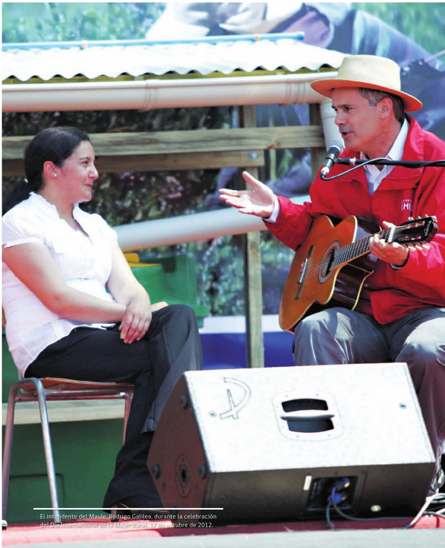
El intendente del Maule, Rodrigo Galilea, durante la celebración del Día Internacional de la Mujer Rural, 17 de octubre de 2012.