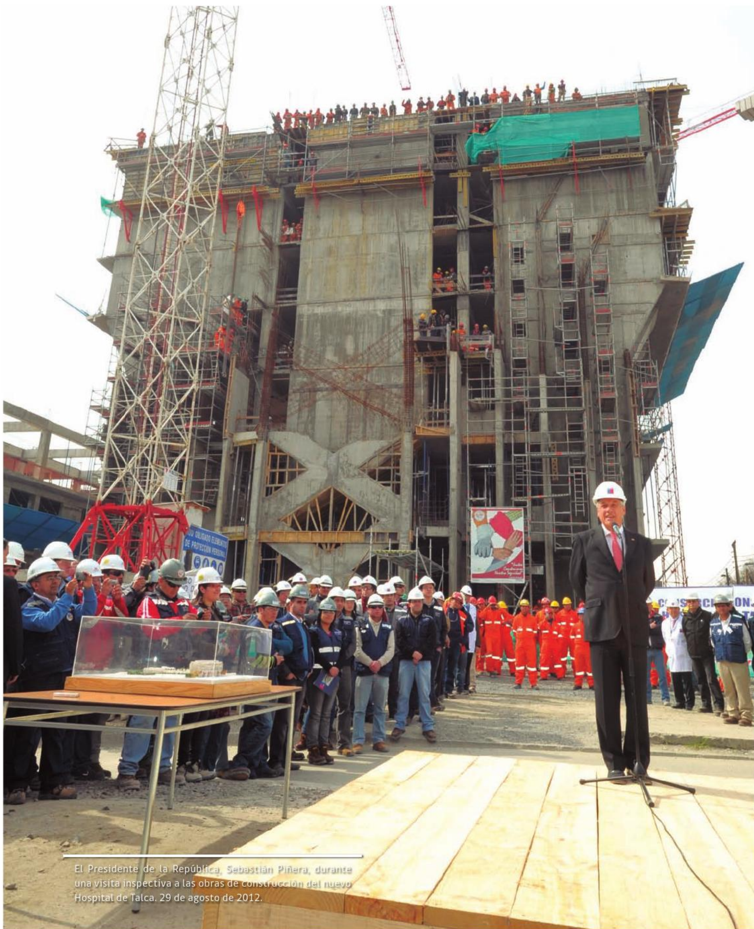
El Presidente de la República, Sebastián Piñera , durante una visita inspectiva a las obras de construcción del nuevo Hospital de Talca. 29 de agosto de 2012.