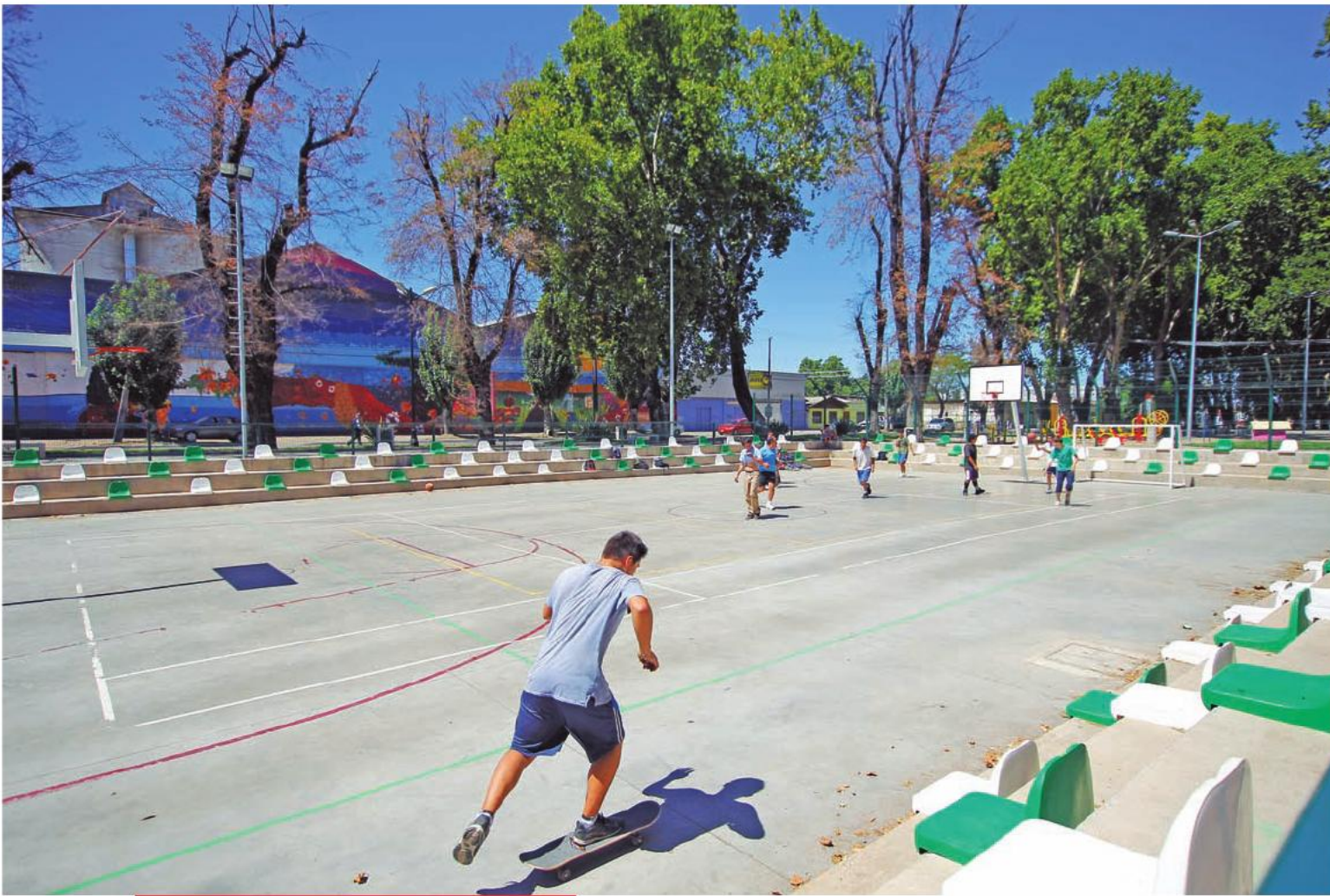
Alameda Manso de Velasco de Curicó, que forma parte del Programa Legado Bicentenario.