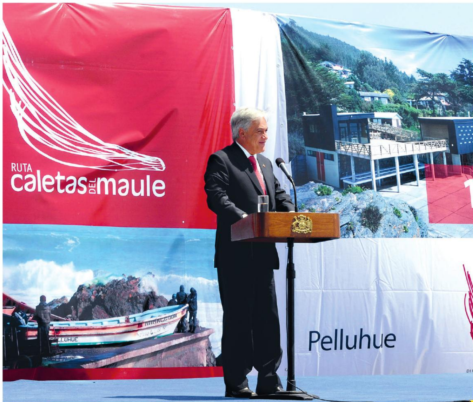
El Presidente de la República en la presentación del proyecto Ruta de las Caletas del Maule, obra del Programa Legado Bicentenario. 24 de octubre de 2011.

“Cuidar estas obras, rescatarlas y darles una nueva cara para el futuro es la mejor forma que tenemos de hacer justicia a estos millones de chilenos que trabajaron duramente por hacer de Chile el país que tenemos hoy”.