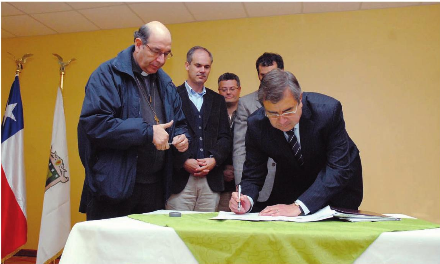
Ceremonia de firma de traspaso de cuatro hectáreas, por parte de la Congregación Salesiana a la Universidad de Talca, para la creación del Campus Linares. 23 de junio de 2012.