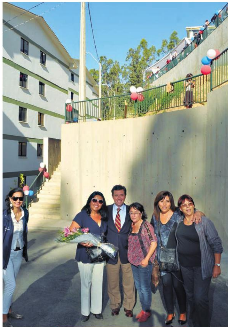
El ministro de Vivienda y Urbanismo, Rodrigo Pérez, entregó en Constitución el nuevo conjunto habitacional Villa Las Cumbres. 14 de marzo de 2013.

hemos abordado la reconstrucción de manera integral y hemos trabajado con el sentido de urgencia que amerita esta catástrofe, con el foco puesto en las personas, en las familias y con la misión de transformar este desastre en una oportunidad para reconstruir el Maule”.