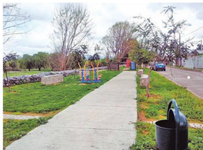
Futuro Parque Guaiquillo, que busca recuperar el borde norte del río del mismo nombre.