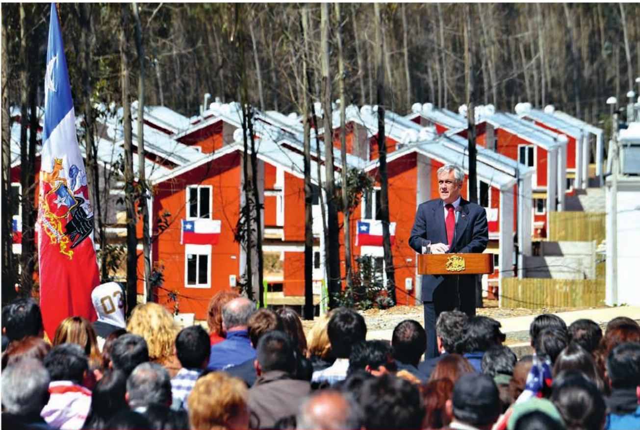
El Presidente Sebastián Piñera inauguró el nuevo conjunto habitacional Villa Verde, en el marco del Plan de Reconstrucción de la ciudad de Constitución. 27 de septiembre de 2013.

“Una de las grandes alegrías como Presidente es que durante nuestro Gobierno tres millones de chilenos van a haber cumplido el sueño de la casa propia. Y ese es un sueño por el cual vale la pena trabajar y comprometerse”.