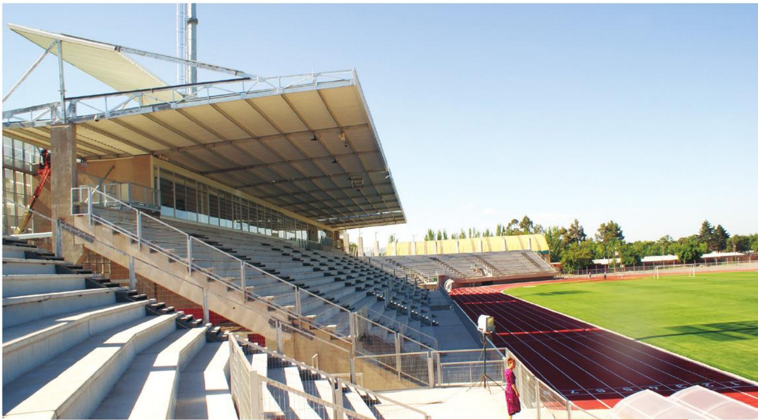
Así luce el remodelado estadio La Granja de Curicó, inaugurado en octubre de 2011.

mos mantener la remodelación, porque queríamos dar un mensaje al país: 'Queremos hacer de Chile un país de deportistas'. La inauguración tiene ese significado".