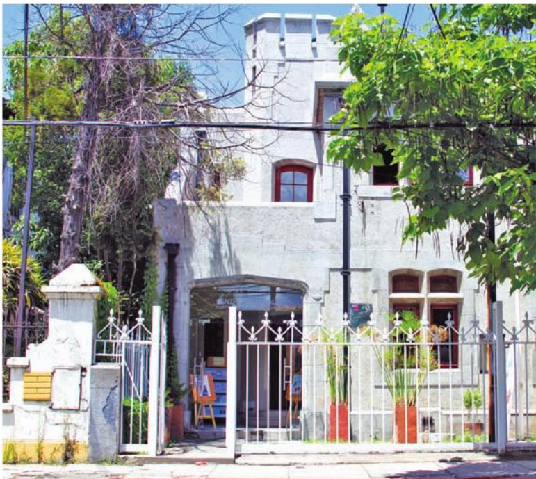
El refaccionado edificio del Centro Cultural de Talca, es utilizado para la realización de distintos talleres, entre ellos, el tejido a telar. Inaugurado el 20 de diciembre de 2012.