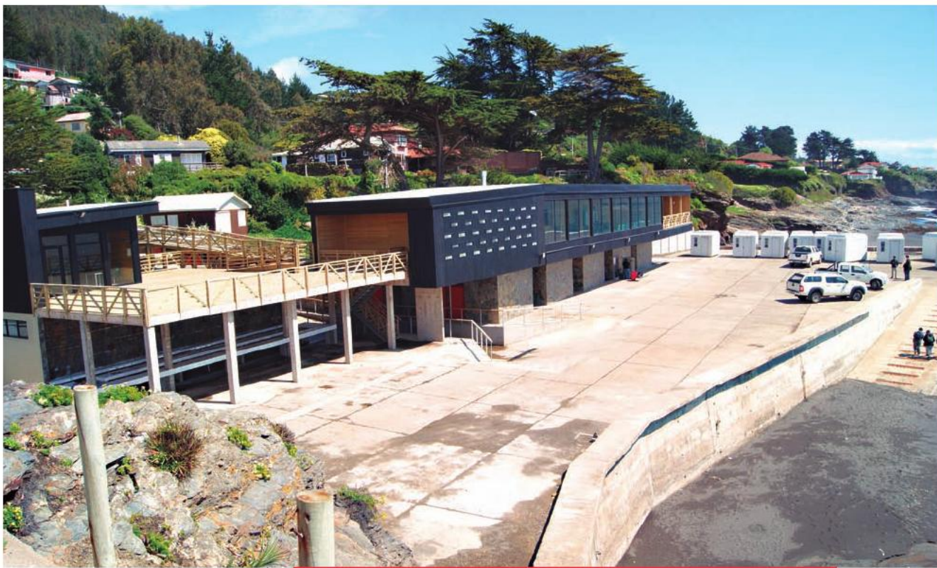
Así luce la nueva caleta de Pelluhue, una de las seis nuevas infraestructuras construidas para reimpulsar el turismo de la zona. 24 de octubre de 2011.