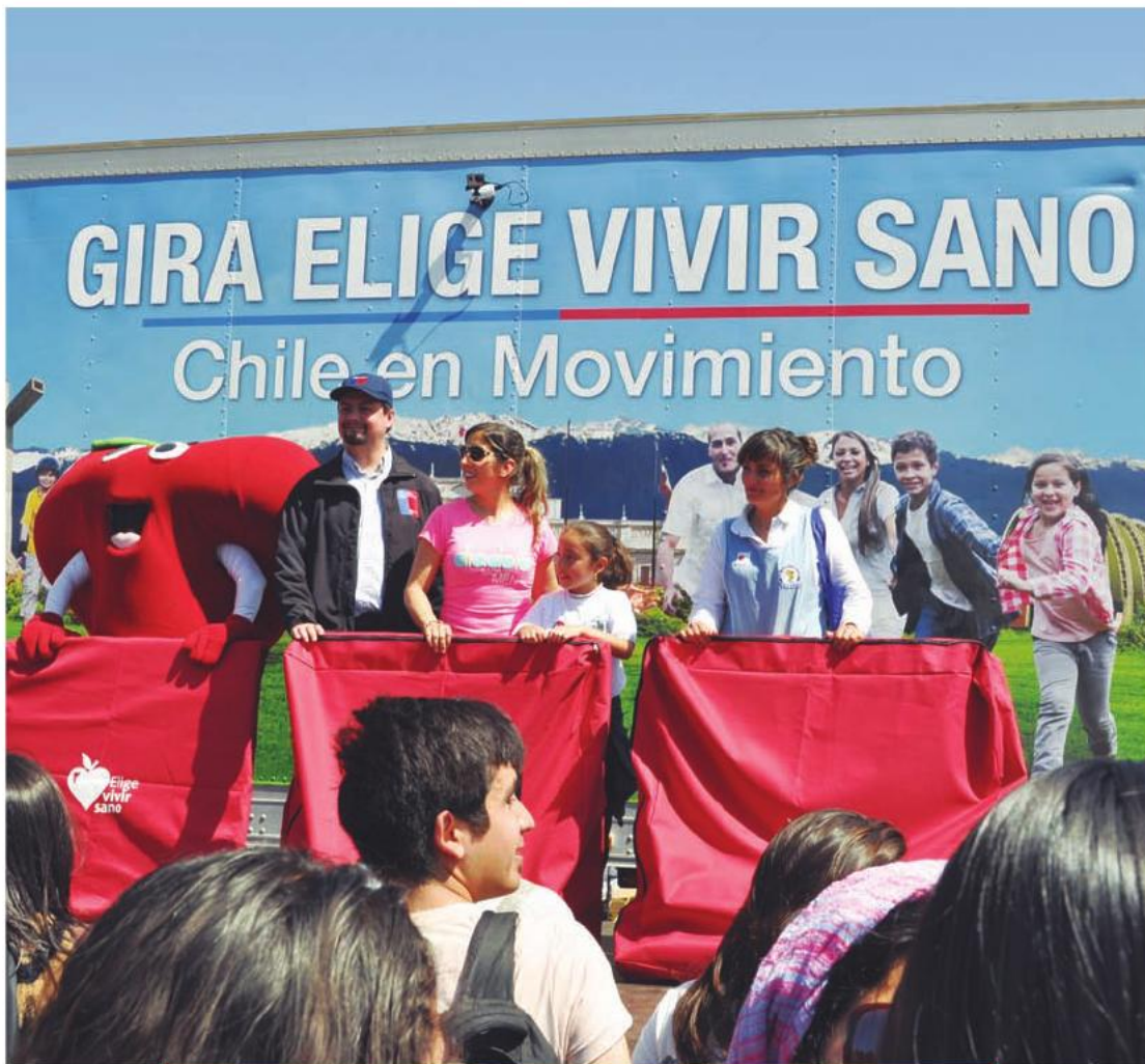
Cientos de talquinos disfrutaron con la "Gira Elige Vivir Sano" que se desarrolló en el Campus Lircay de la Universidad de Talca. 23 de octubre de 2013.