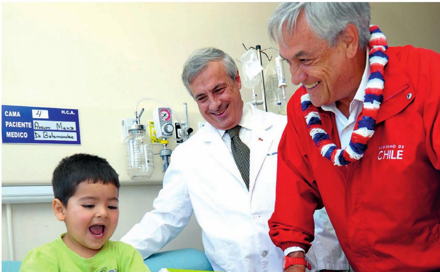
Sebastián Piñera, Presidente de la República, durante la inauguración del Hospital modular de Curicó. 22 de febrero de 2012.