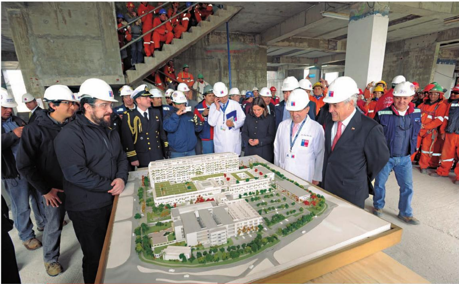
Visita inspectiva del Presidente Sebastián Piñera al nuevo Hospital Regional del Maule. 29 de agosto de 2012.

Sin embargo, la mayor infraestructura de salud llevada adelante en el Maule durante el Gobierno del Presidente Piñera ha sido el Hospital Regional de Talca, el que considera una inversión en obras y equipamiento de más de 110 mil 200 millones de pesos. Su infraestructura, de 85 mil metros cuadrados, incluye un sistema de aislación térmica con dispensadores de energía, 471 camas básicas, 132 críticas y 42 de pensionado, 18 pabellones quirúrgicos, servicios de urgencia, seis salas de parto, 27 boxes de emergencia, áreas de paciente crítico infantil, además de 450 estacionamientos y un helipuerto, entre otros servicios clínicos. Estas mejoras entregarán dignidad a trabajadores y a usuarios, permitiendo una mejor atención de salud a pacientes y familiares que buscan con urgencia una respuesta a sus problemas. Las obras comenzaron el 16 de mayo de 2011, por lo que se proyecta su puesta en marcha para mediados de 2014.