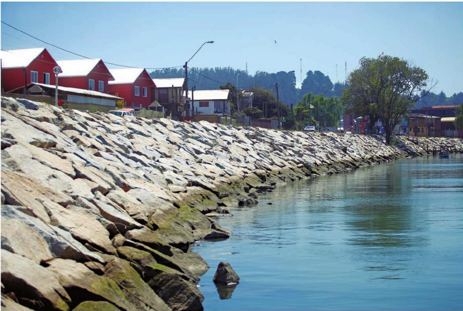
Nuevo Espigón Orrego del borde costero de Constitución, entregado en junio de 2012.

se había soñado y que les permitirá, en base a trabajo e inteligencia, tener un nuevo sustento para sus familias. Ya que acá no sólo se dependerá de lo que entregue el mar, sino que se puede potenciar el rubro gastronómico”.