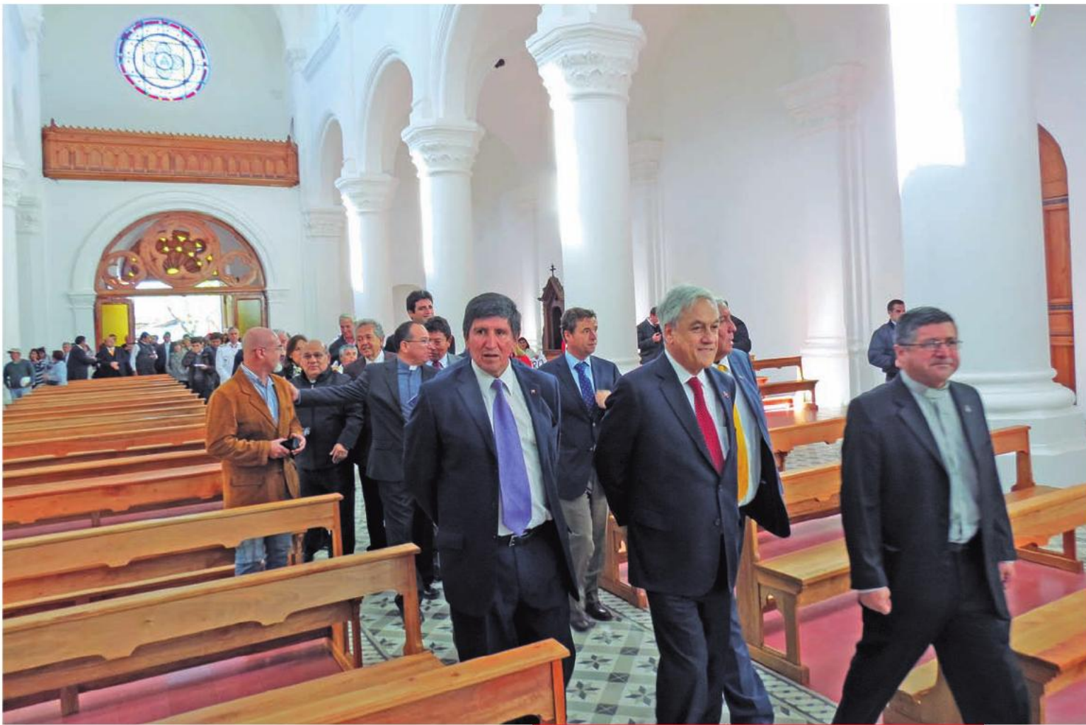
El Presidente Sebastián Piñera visitando la iglesia San Alfonso de Cauquenes, luego de su reparación, obra del Programa Legado Bicentenario. 12 de abril de 2013.

Como parte de la reparación de la infraestructura patrimonial, en abril de 2013 se inauguraron los trabajos de reparación de la Iglesia San Alfonso de Cauquenes, que data de 1840 y que resultó dañada por el terremoto de 2010, y que consideró una inversión de 850 millones de pesos para la ejecución de las obras. A la ceremonia, que se realizó el 12 de abril de 2013, asistió el Presidente Piñera, quien destacó que esta construcción "ha recuperado sus torres, como las tuvo en su concepción original, su dignidad, el simbolismo que esta iglesia representa para Cauquenes, y también los altares, que alguna vez llegaron desde Francia y Bélgica. Y con el trabajo de artesanos chilenos, también ha recuperado los vitraux, que son parte muy importante de ella".