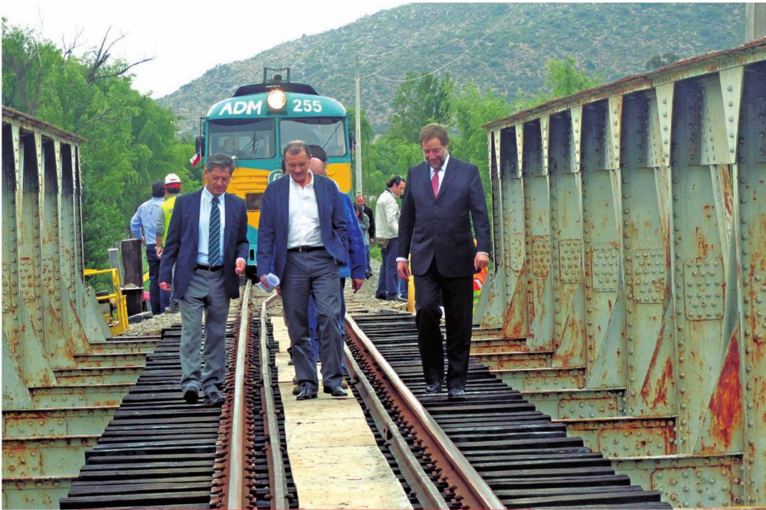
El ministro de Transportes y Telecomunicaciones, Pedro Pablo Errázuriz, durante la entrega de las obras de rehabilitación del Ramal Talca-Constitución, 7 de noviembre de 2013.