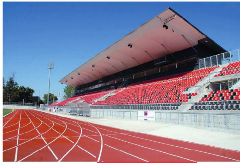
Nuevo estadio Fiscal de Talca, inaugurado el 20 de diciembre de 2011