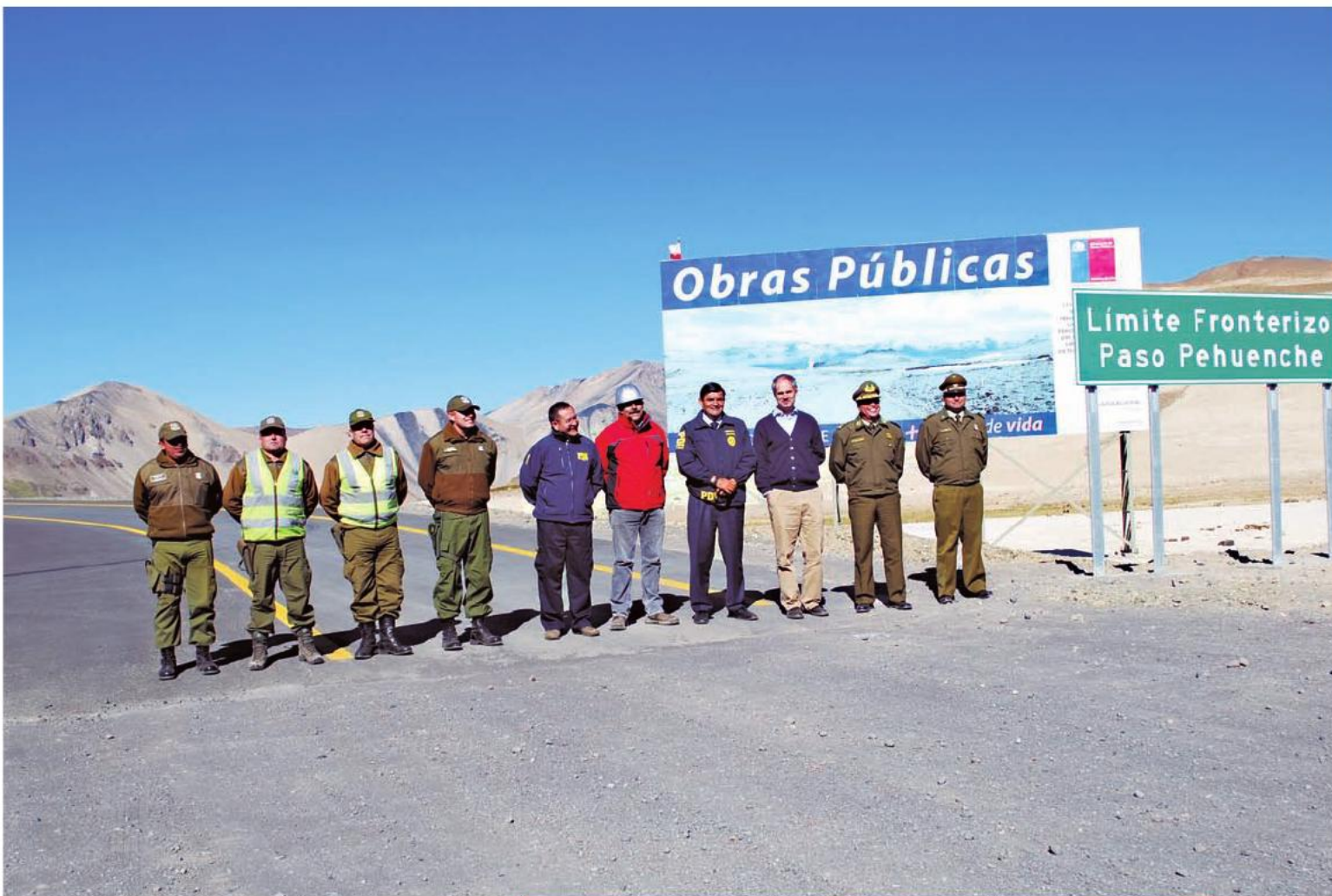
El intendente del Maule, Rodrigo Galilea, visita las obras de pavimentación de la Ruta 115-CH, Paso Internacional Pehuenche. 5 de abril de 2013.

En el mismo ámbito de infraestructura vial urbana, en enero de 2014 se entregaron los trabajos de mejoramiento vial del Par 6-8 Sur de Talca, iniciativa que consideró una inversión cercana a los siete mil millones de pesos y que permitió dar alternativas de movilidad y transporte a toda la gente que vive al sur de la ciudad.