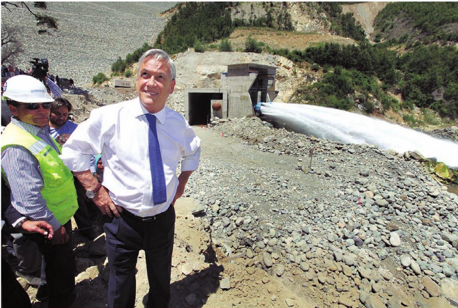
El Presidente Sebastián Piñera durante la inauguración del nuevo embalse Ancoa. 9 de enero de 2013.

este embalse que les va a permitir mejorar sus condiciones de riego. Han pasado casi cuatro años desde que comenzó la construcción de esta gran obra y hoy por fin podemos decir que nuestros regantes y todos los habitantes de la Región del Maule tienen un embalse como se merecen", dijo la ministra de Obras Públicas, Loreto Silva.