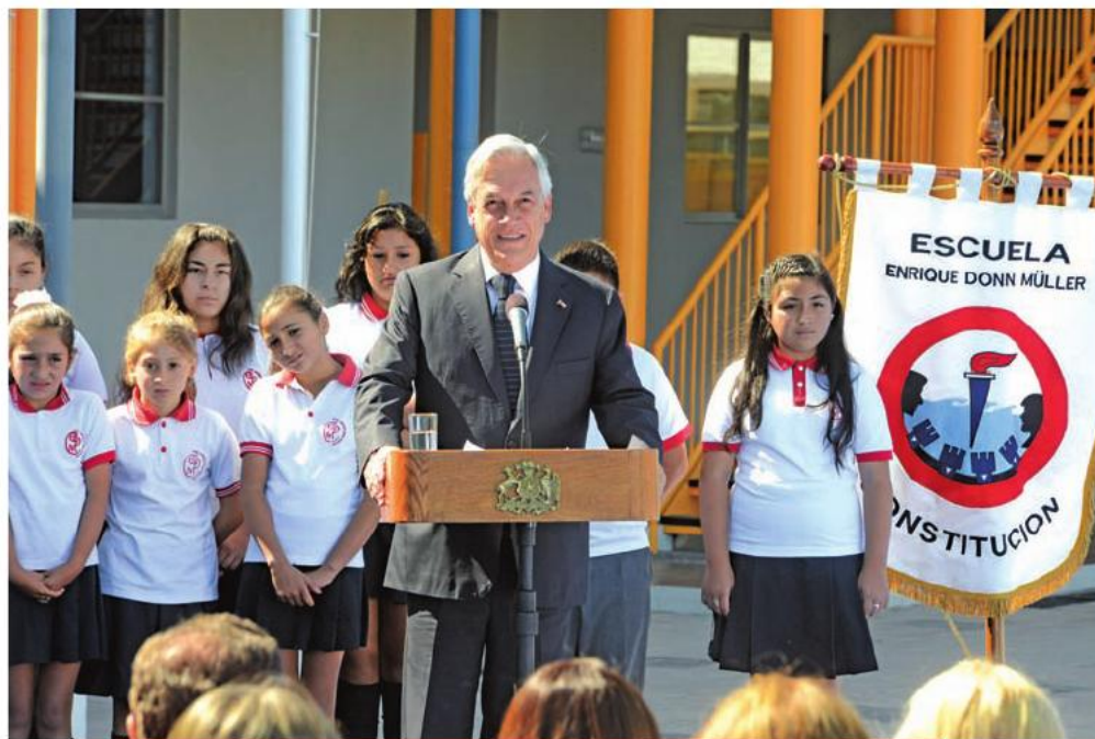
El Presidente de la República, Sebastián Piñera, encabezó la inauguración de la Escuela Enrique Donn Müller, de Constitución. 27 de febrero de 2013.

“Estamos abriendo una gran ventana de progreso académico, intelectual y cultural. Es hora de que los linarenses se crean el cuento y aprovechen las ventajas que tienen en comparación con otras zonas del Maule y el país. Esta es una gran oportunidad”.