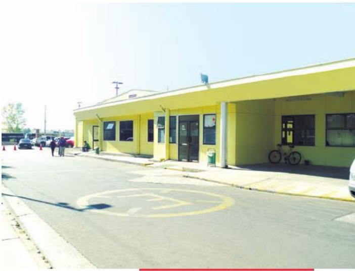
Nuevo hospital de construcción acelerada de Talca.