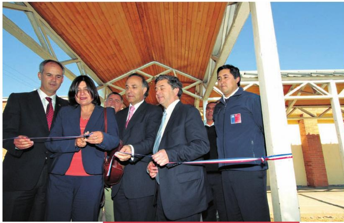
El ex ministro de Justicia, Teodoro Ribera, inauguró el Centro Semicerrado del Sename en Talca. 16 de octubre de 2012.

su modernidad y diseño a favor de la reinserción social. Para ello, se atraerá a empresas para que instalen sus operaciones al interior del recinto, pagando a los internos un sueldo digno por su labor. Este nuevo centro penitenciario se ubicará en el sector Panguilemo, tendrá una capacidad para mil 400 internos y considerará una inversión de 116 millones de dólares.