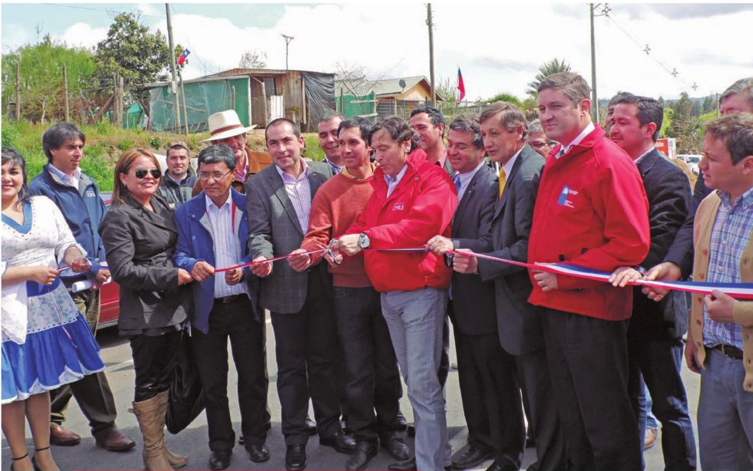
El ex ministro de Obras Públicas, Laurence Golborne, inauguró la Ruta K-40 San Rafael-Villa Prat, 21 de septiembre de 2012.

y del tramo entre el puente Tutuvén y la Reserva Nacional Los Ruildes, en la comuna de Chanco. La intervención en esta ruta, sumando ambos tramos, se traduce en 17,7 kilómetros. Las obras consideraron una inversión de siete mil 300 millones de pesos y culminaron en abril de 2013.