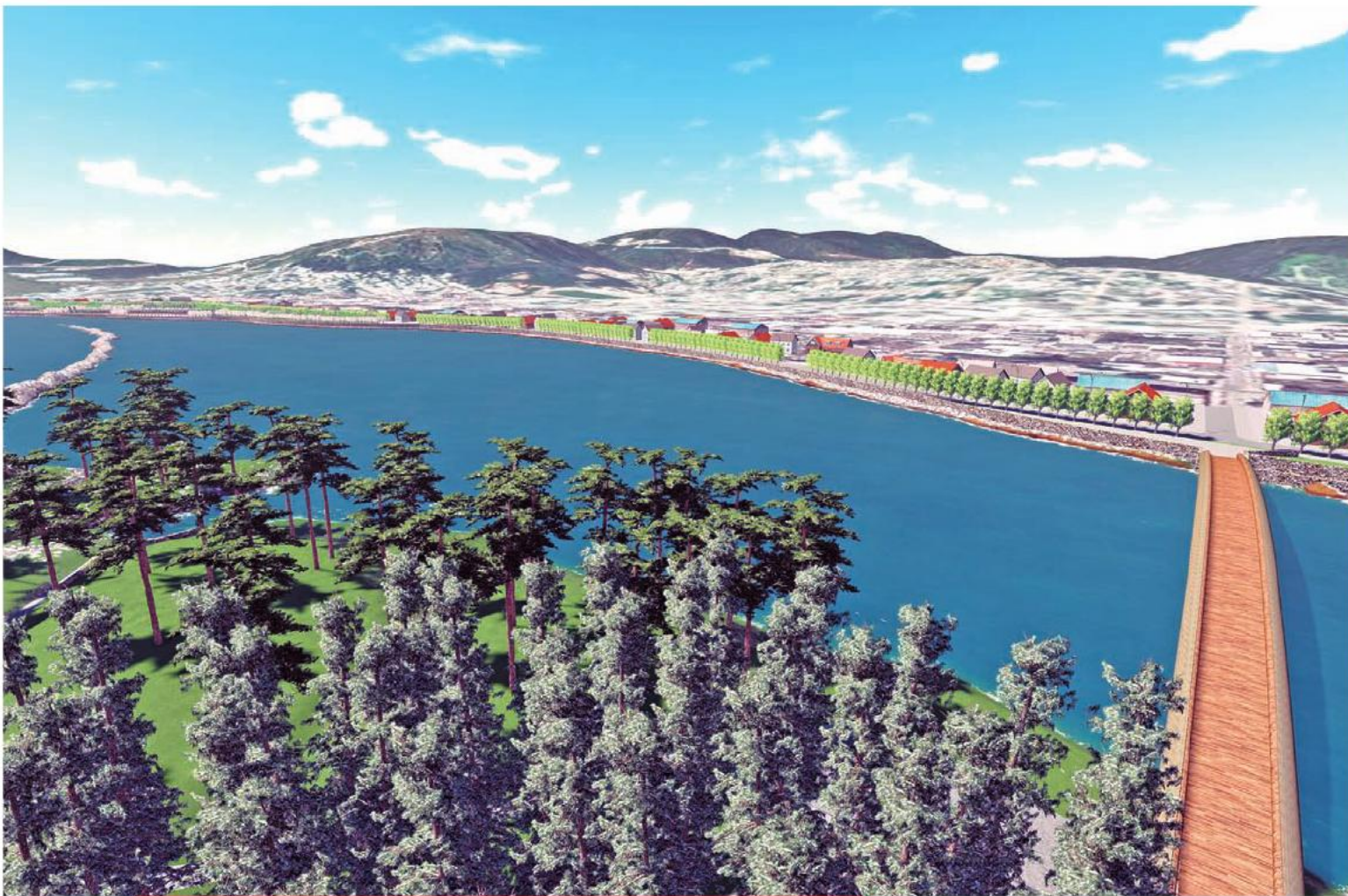
Futuro Parque Borde Fluvial, que contempla un puente peatonal desde Constitución a Isla Orrego, obra del Programa Legado Bicentenario.