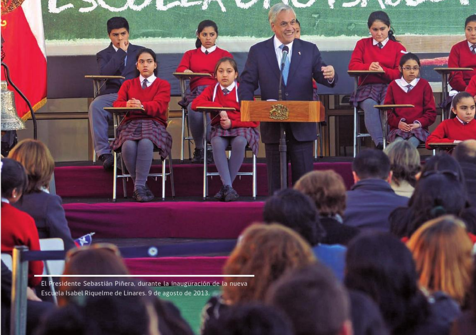
El Presidente Sebastián Piñera, durante la inauguración de la nueva Escuela Isabel Riquelme de Linares. 9 de agosto de 2013.

BIENVENID INAUGURACIÓ ESCUELA UNO ISABEL R