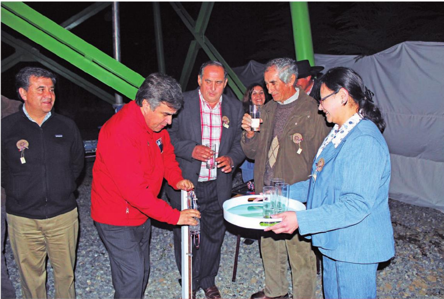
El subsecretario de Desarrollo Regional, Miguel Flores inaugura proyectos de agua potable en zonas rurales del Maule. 15 de junio de 2013.

sión de mil 54 millones de pesos y que beneficia a casi 500 familias del sector. Estas obras fueron inauguradas el 11 de marzo de 2013. Además, se invirtieron mil 464 millones de pesos en la construcción de soluciones sanitarias en la localidad de Santa Rita, comuna de Pelarco, trabajos que contemplaron la construcción de 101 soluciones sanitarias, nuevas redes y 174 arranques de agua potable, incluyendo la reconexión de 78 arranques existentes y una planta de tratamiento de aguas servidas. Las obras fueron inauguradas en abril de 2012.