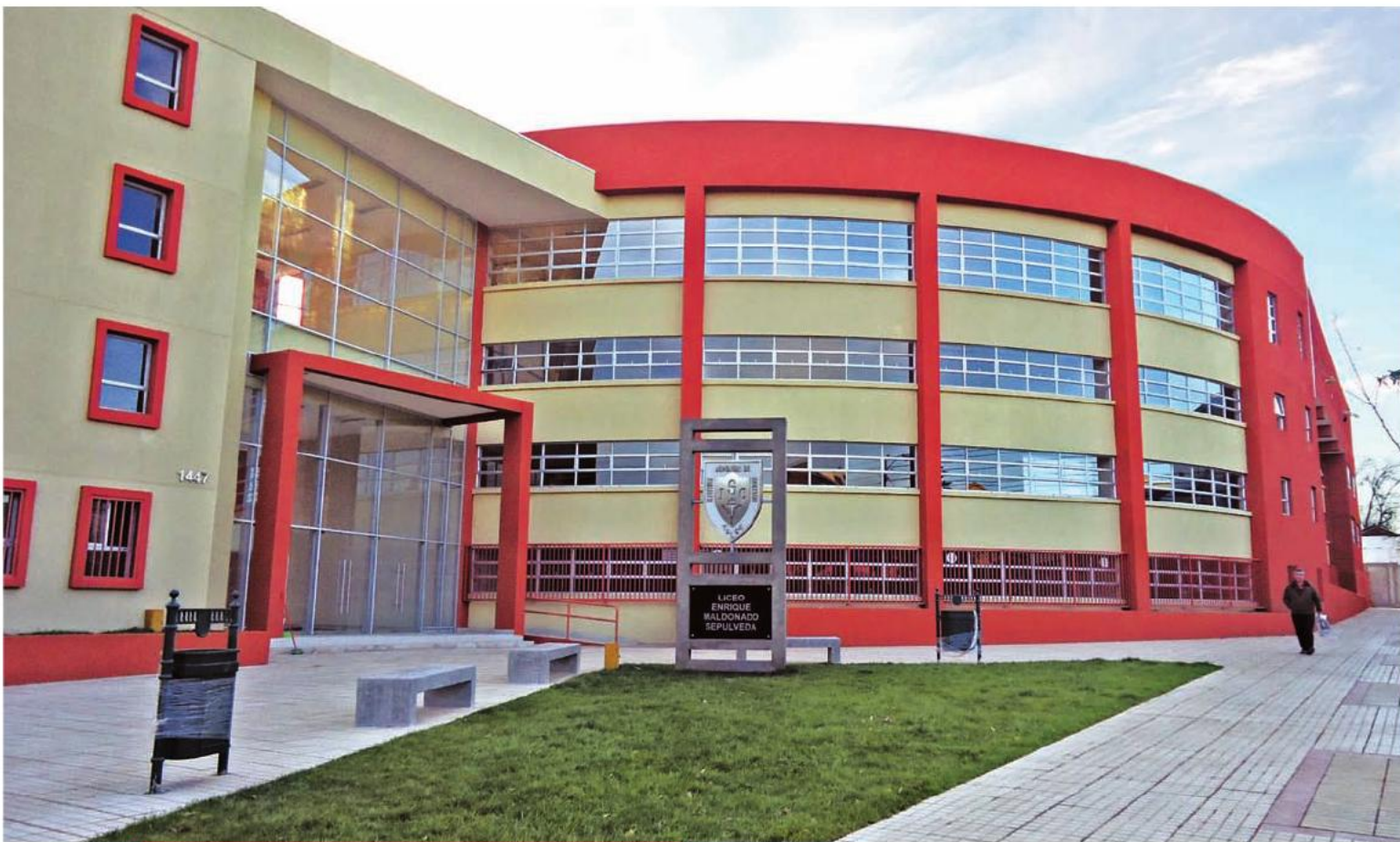
Frontis de las nuevas instalaciones del Instituto Superior de Comercio Enrique Maldonado de Talca. Las obras fueron terminadas en junio de 2013.

Para el inicio del año escolar 2014 se espera la entrega del Liceo Abate Molina y del Liceo Marta Donoso Espejo, ambos de la comuna de Talca, y del Liceo Federico Heise, de Parral, mientras que el Liceo Guillermo Marín Larraín, de Retiro, se entregaría a mediados de 2014.