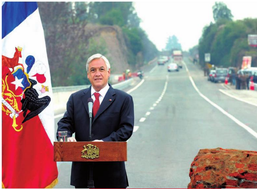
El Presidente Sebastián Piñera, durante la entrega del nuevo puente del río Claro. 1 de junio de 2012.

“Este puente simboliza muy bien lo que es el Chile que juntos estamos construyendo. Es un puente moderno, que está pensado para enfrentar los desafíos del presente, pero también para enfrentar los desafíos del futuro. Es un puente que representa lo mejor de nuestra ingeniería, lo mejor de nuestra tecnología, que está preparado para soportar en el futuro nuevos terremotos y, por tanto, simboliza muy bien lo que estamos construyendo”.