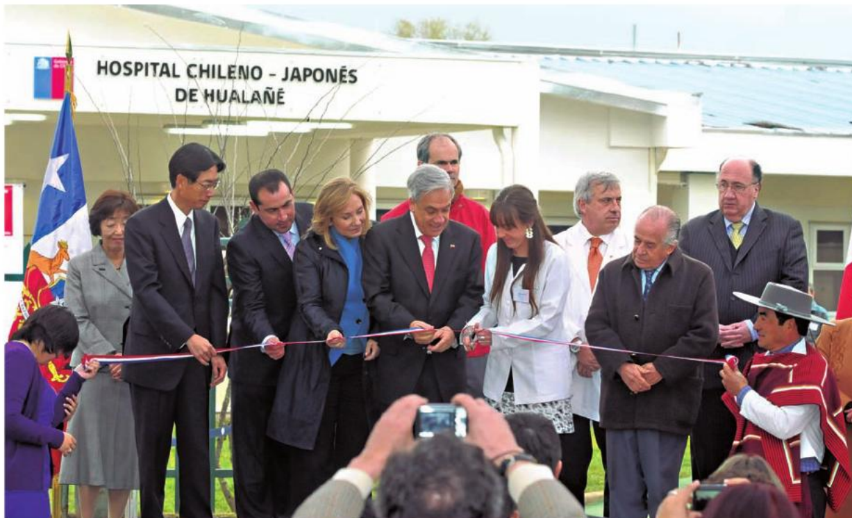
El Presidente de la República, Sebastián Piñera, y la Primera Dama, Cecilia Morel, durante la inauguración del nuevo Hospital Modular de Hualañé. 26 de agosto de 2011.

de intervención menor y cinco salas de parto integral, además de 400 estacionamientos y de un helipuerto, entre otros servicios, lo que implicará una inversión de 90 mil millones de pesos. Para febrero de 2014 estaba programado el término del proceso de licitación para la ejecución de las obras, por lo que se estima que el recinto sea inaugurado a fines de 2017.