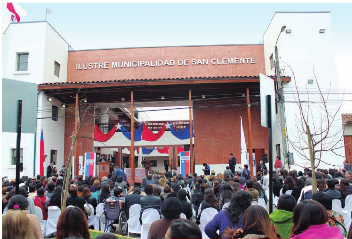
Inauguración del nuevo edificio consistorial de San Clemente. 26 de septiembre de 2013.

la Intendencia, el Consejo Regional, la Unidad Regional de la Subsecretaría de Desarrollo Regional (Subdere) y la Secretaría Regional Ministerial de Desarrollo Social. Contará con 11 pisos y seis mil metros cuadrados, para lo cual se invirtieron seis mil 400 millones de pesos. Se proyecta su entrega para 2014.