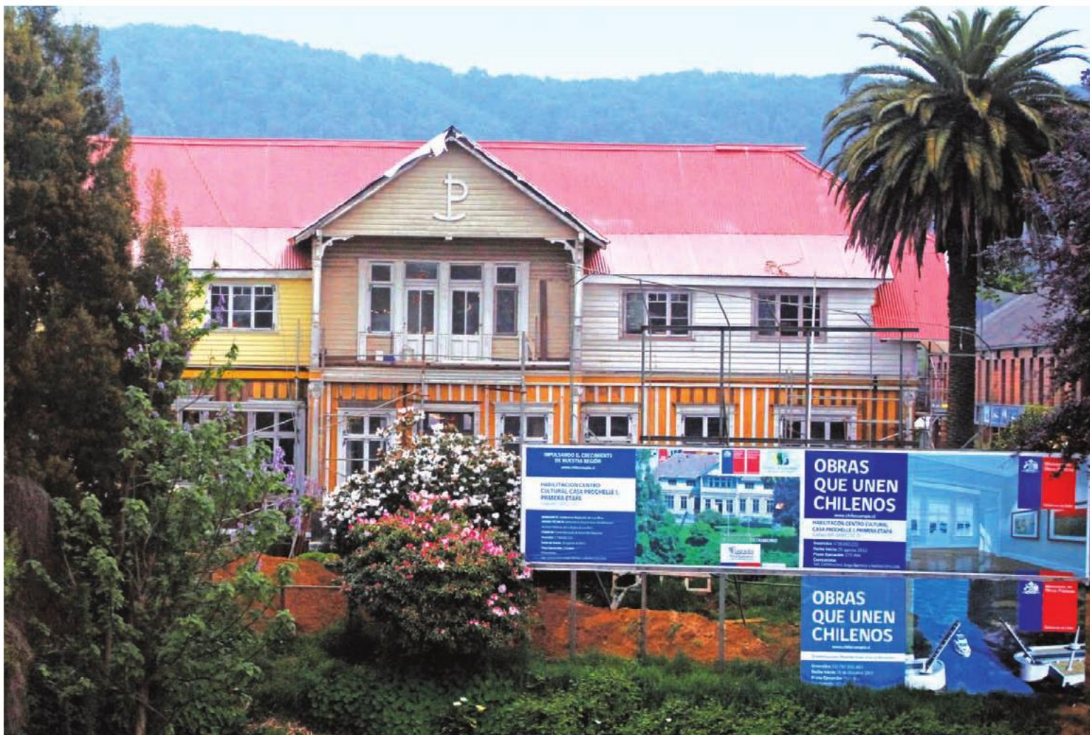
La histórica Casa Prochelle I de Valdivia está siendo restaurada, como parte del Programa Legado Bicentenario, para convertirla en centro cultural.

“Será la concreción de un anhelo para todos quienes reconocemos el valor patrimonial de nuestra región. Con esta inversión no sólo se está restaurando y hermoseando esta fortaleza (Fuerte Niebla), sino que, además, estamos perpetuando una de las obras más importantes de la historia de nuestra ciudad”.