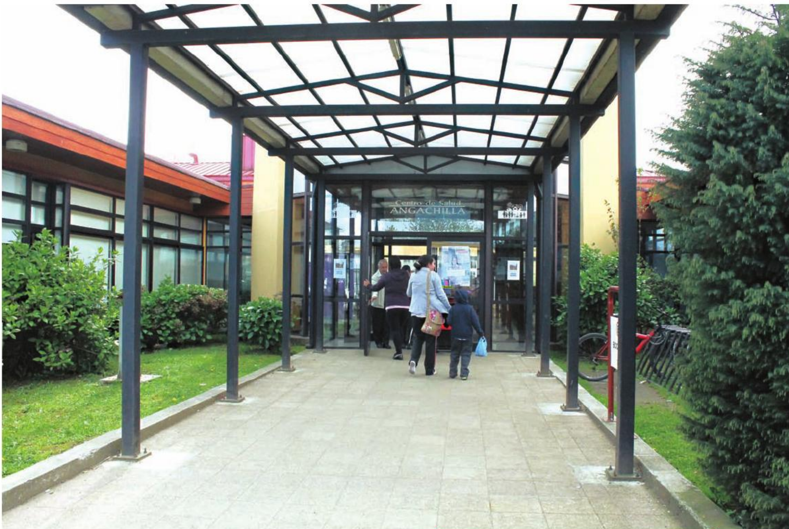
El Cesfam de Angachilla de la ciudad de Valdivia fue inaugurado el 10 de febrero de 2012.

logrando obtener la infraestructura necesaria para dar atención a los más de 21 mil habitantes del sector de Angachilla.