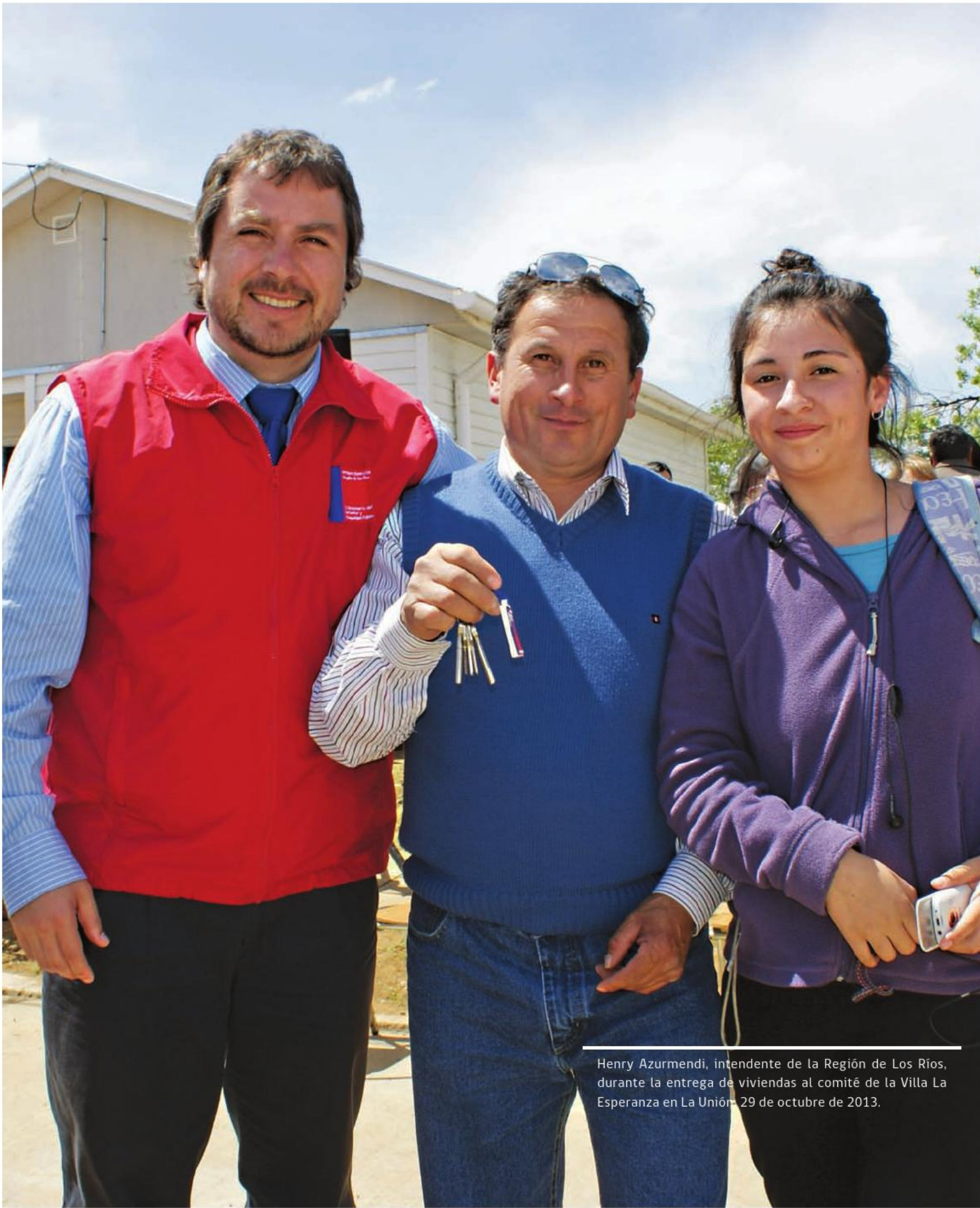
Henry Azurmendi, intendente de la Región de Los Ríos, durante la entrega de viviendas al comité de la Villa La Esperanza en La Unión. 29 de octubre de 2013.