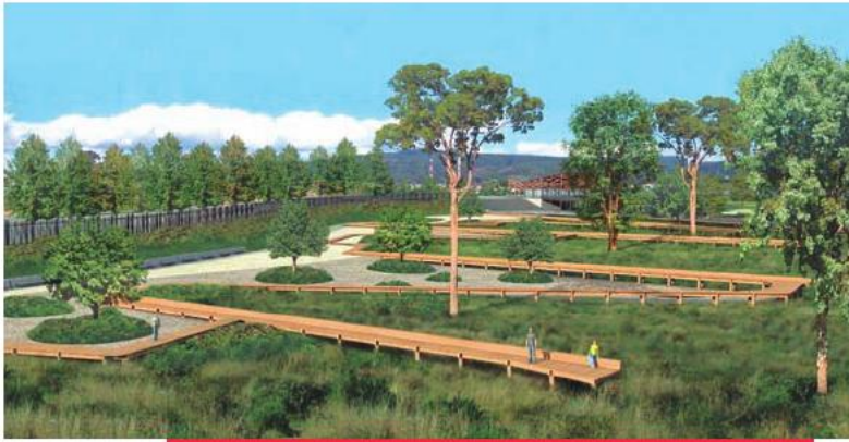
Diseño del futuro Parque Catrico de la ciudad de Valdivia.