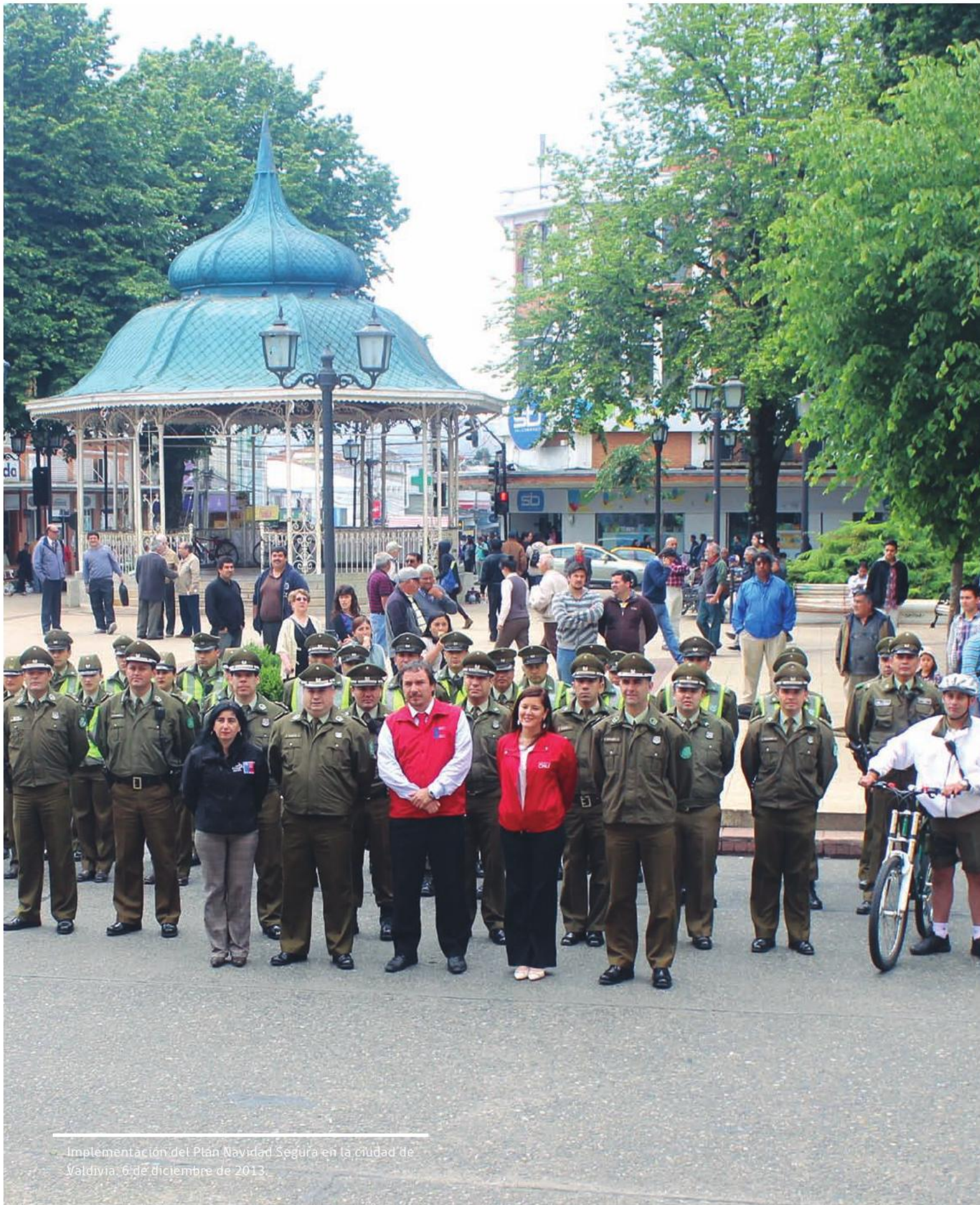
Implementación del Plan Navidad Segura en la ciudad de Valdivia, 6 de diciembre de 2013.