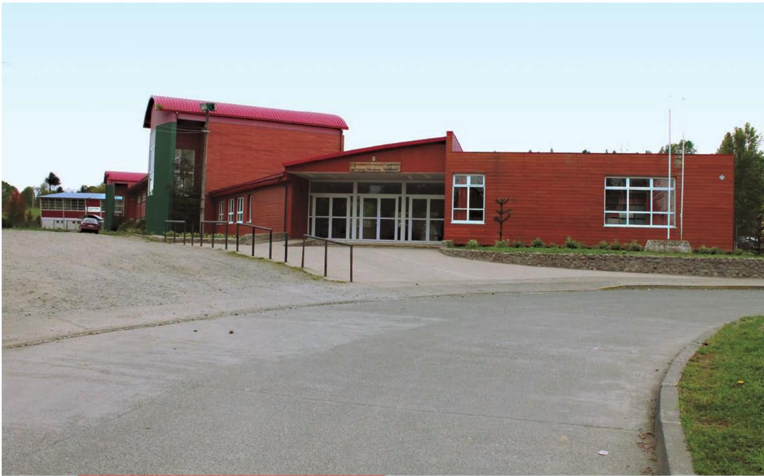
Las nuevas instalaciones del Liceo Bicentenario Altamira de Panguipulli benefician a más de 600 estudiantes.

Por su parte, la implementación del Liceo Bicentenario Polivalente Abdón Andrade, de La Unión, contó con una inversión de 470 millones de pesos para la reconversión de su infraestructura, mientras que en el Liceo Ciudad de Los Ríos, sus nuevas instalaciones, equipamiento y mobiliario consideraron una inversión de mil millones de pesos.