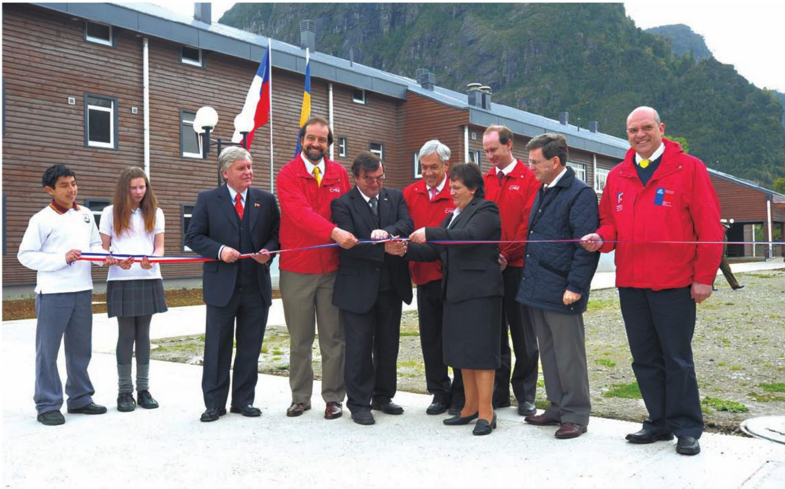
El Presidente Sebastián Piñera en la inauguración del nuevo Liceo e Internado de Llifén en Futrono. 11 de octubre de 2011.