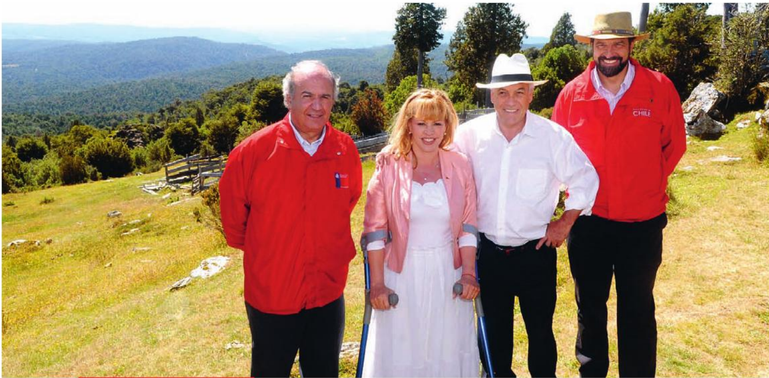
Parque Nacional Alerce Costero.