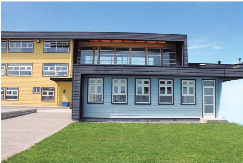
La Escuela e Internado de Antihue es una iniciativa que da solución integral a 185 alumnos de las localidades rurales de Los Ríos.

También se llevó a cabo el mejoramiento del Liceo Politécnico de Mehuín, en el que gracias a distintos convenios se invirtieron 500 millones de pesos en la implementación y obras de mejoramiento de la infraestructura para las especialidades de acuicultura y elaboración industrial de alimentos. Las obras fueron inauguradas el 31 de mayo de 2013.