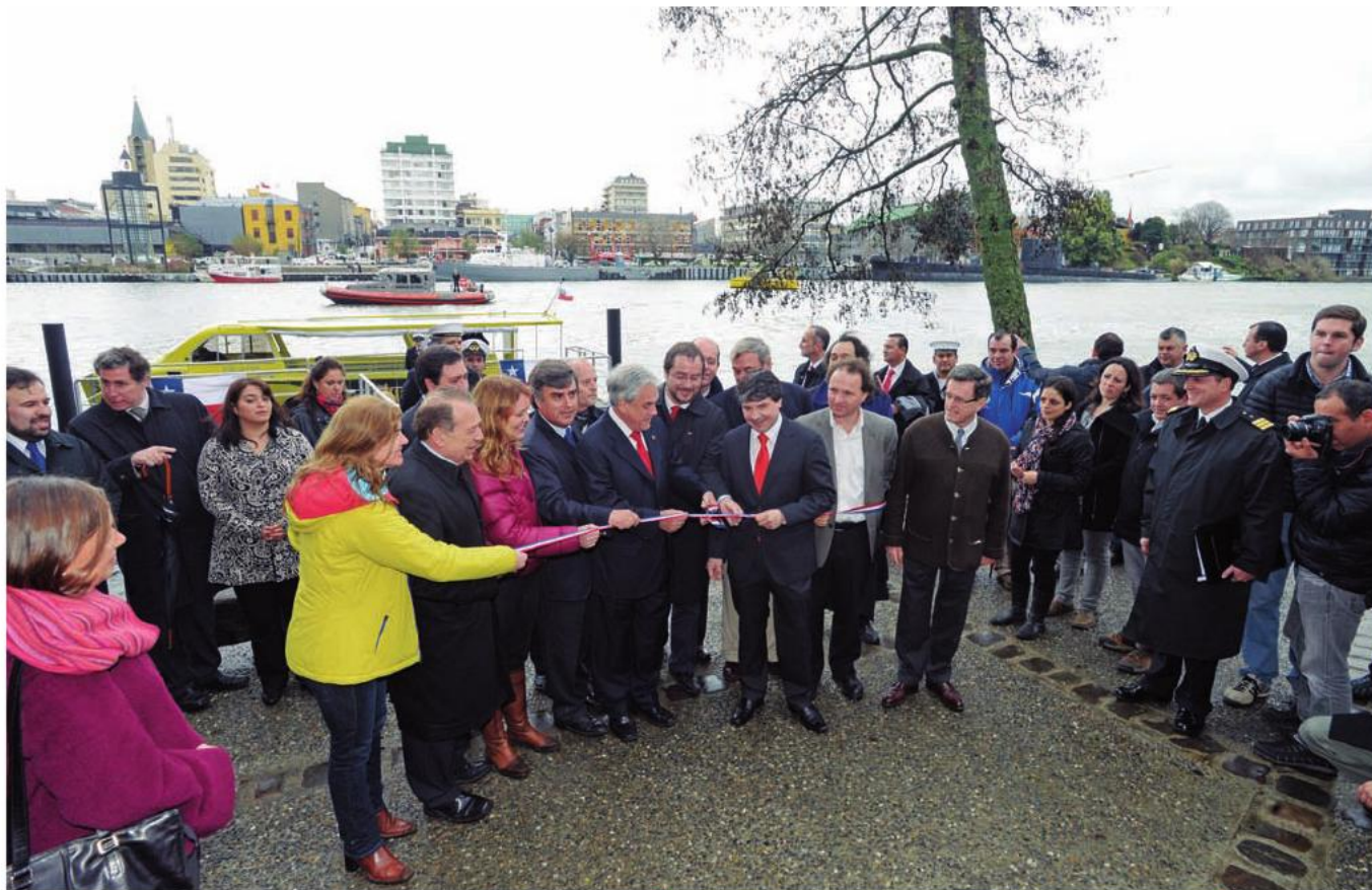
El Presidente Piñera inaugura el nuevo muelle fluvial Los Castaños. 6 de septiembre de 2013.

cada uno. La obra de este puente basculante también consideró la construcción de aceras, una ciclovía, zona de miradores y un recorrido peatonal, además de una serie de obras de paisajismo que incluyen el mejoramiento de las áreas naturales que rodean el proyecto, tales como el río y zonas aledañas a la Avenida Manuel Agüero.