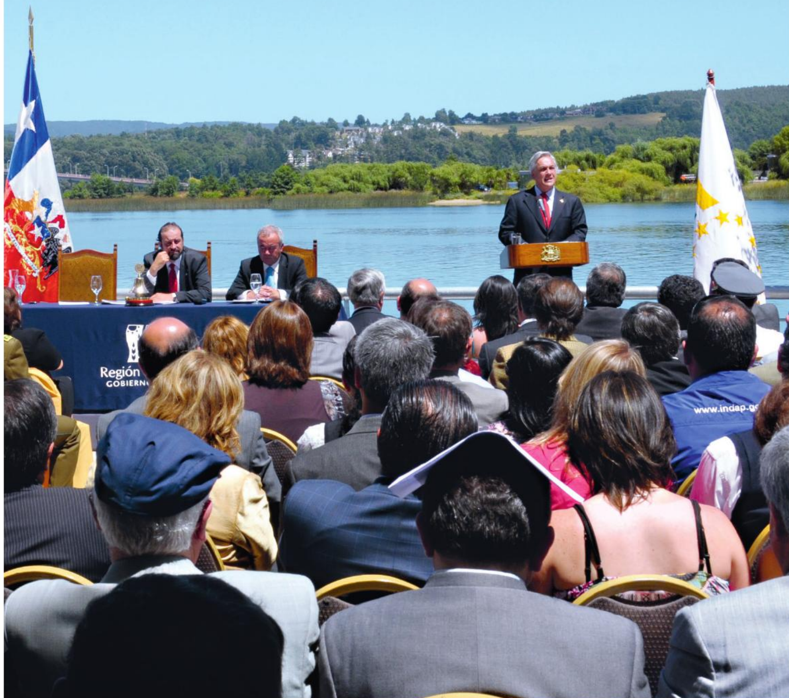
El Presidente de la República, Sebastián Piñera Echenique, dando a conocer el Plan Los Ríos 2010-2014. 14 de enero de 2011.