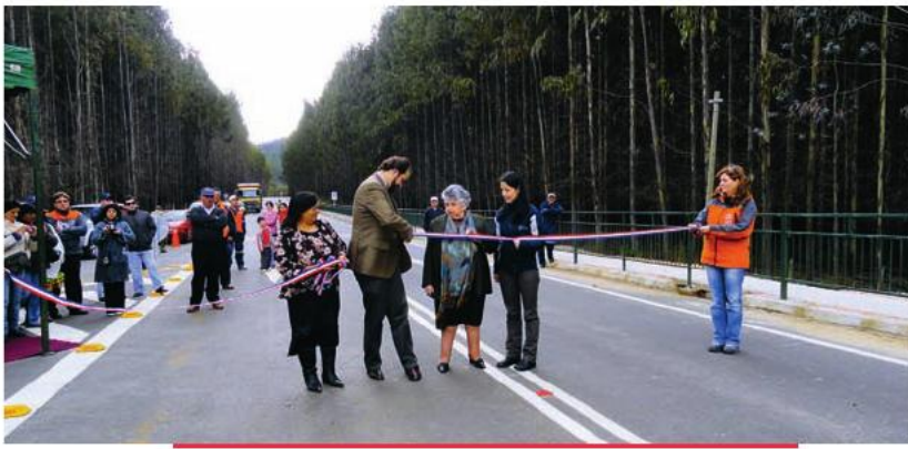
El tramo entre Las Ventanas y Los Tractores de la Ruta T-72, en la comuna de La Unión, fue inaugurado el 23 de septiembre de 2011.