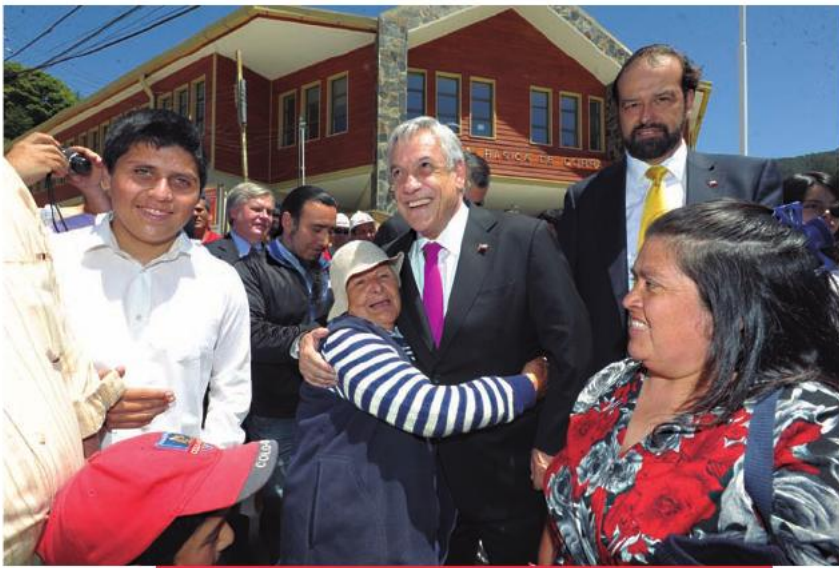
El Presidente Piñera realizó una visita a la Escuela Básica de Corral. 28 de diciembre de 2011.