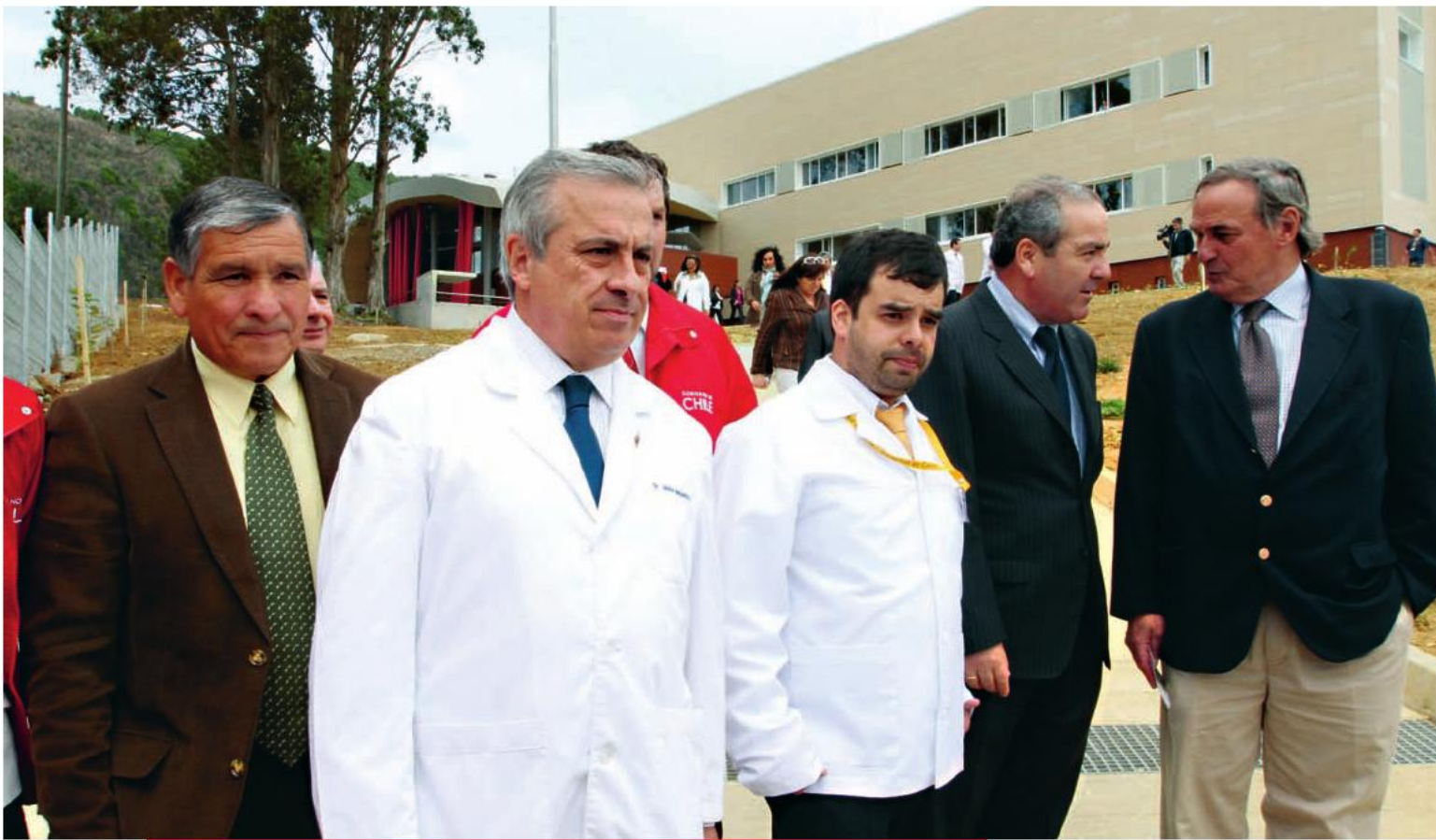
Inauguración del nuevo Hospital de Corral. El recinto atiende aproximadamente a seis mil beneficiarios, tanto de la misma comuna como de otras zonas rurales aledañas.

“Estamos contentos por haber podido terminar esta obra, de dotar a Corral de un centro de salud que atiende no sólo a pacientes que requieren ser hospitalizados, sino también a quienes necesitan cirugías de mediana complejidad, a través de operativos médicos y también toda la atención ambulatoria”.