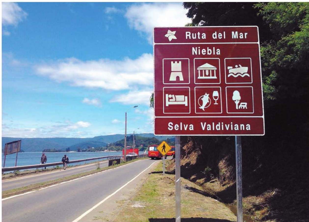
Con la nueva Ruta del Mar se podrán apreciar de mejor forma los atractivos de la Selva Valdiviana.

además de la nutria, el puma, el zorro y el pudú. También nos va a permitir convertir a esta Región de Los Ríos y a esta comuna de La Unión, en un verdadero santuario del turismo ecológico, del turismo de la naturaleza”.