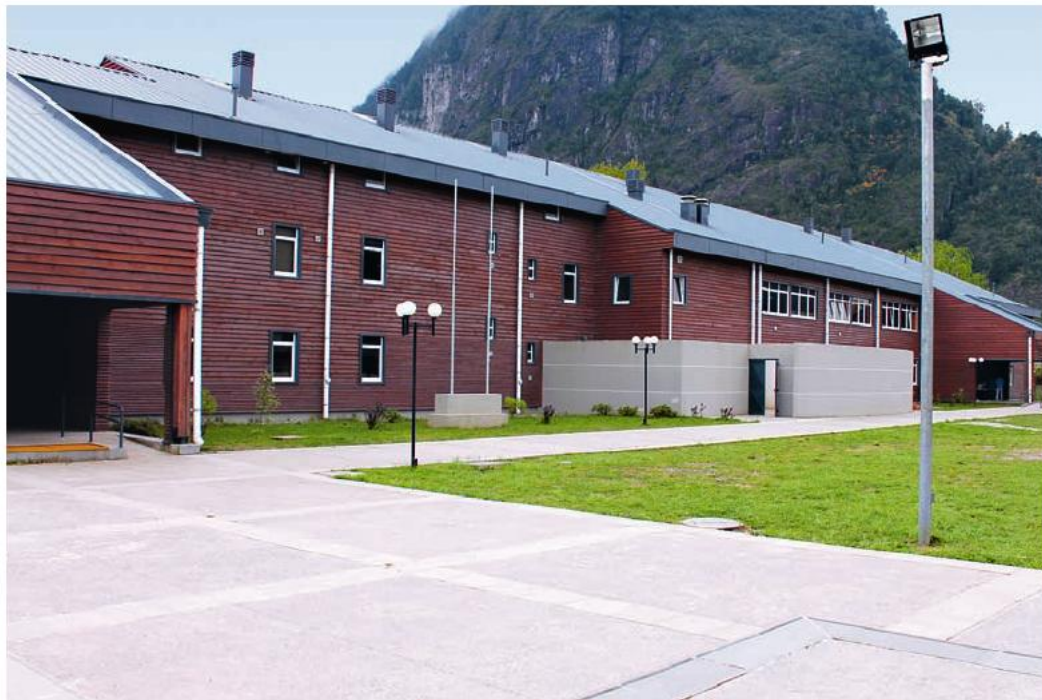
Nuevo Liceo e Internado de Llifén, en Futrono, operativo desde octubre de 2011.