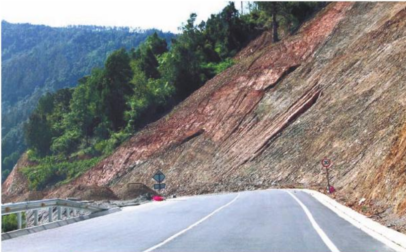
En la Ruta T-35, el tramo Antihue-Valdivia se entregaría a inicios de 2014.

En marzo de 2011 se iniciaron las obras de pavimentación de 27 kilómetros de la Ruta T-35 en el tramo Antihue-Valdivia. Este proyecto permitirá mejorar las condiciones de viaje de aproximadamente 140 mil personas, que cada año se desplazan entre Valdivia y Los Lagos. La obra, que finalizará a principios de 2014, implica una inversión de más de 11 mil 100 millones de pesos y considera, además, la construcción de dos miradores, paraderos y la reposición de los actuales puentes Cuiculelfu y Pishuinco por estructuras definitivas.