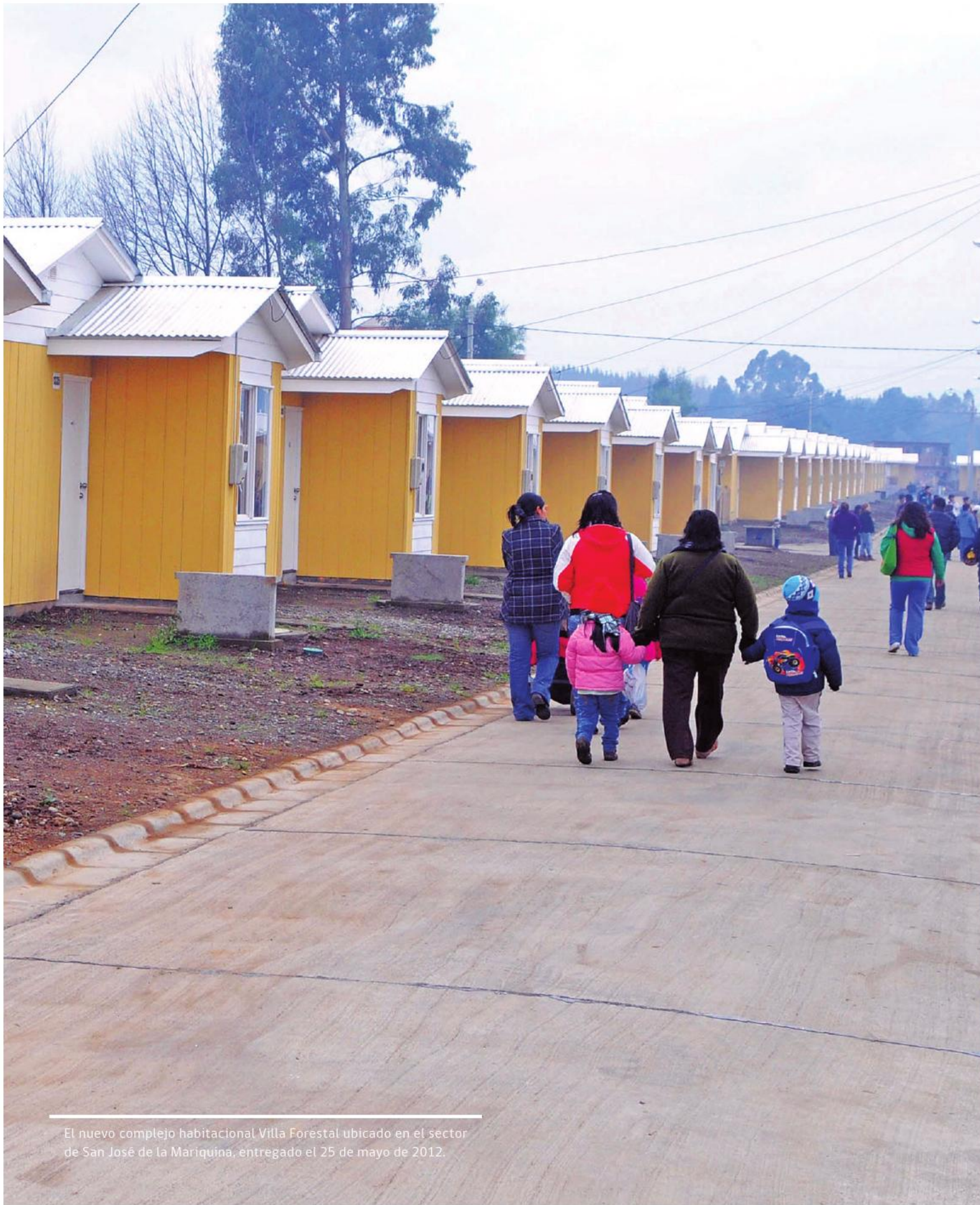
El nuevo complejo habitacional Villa Forestal ubicado en el sector de San José de la Mariquina, entregado el 25 de mayo de 2012.