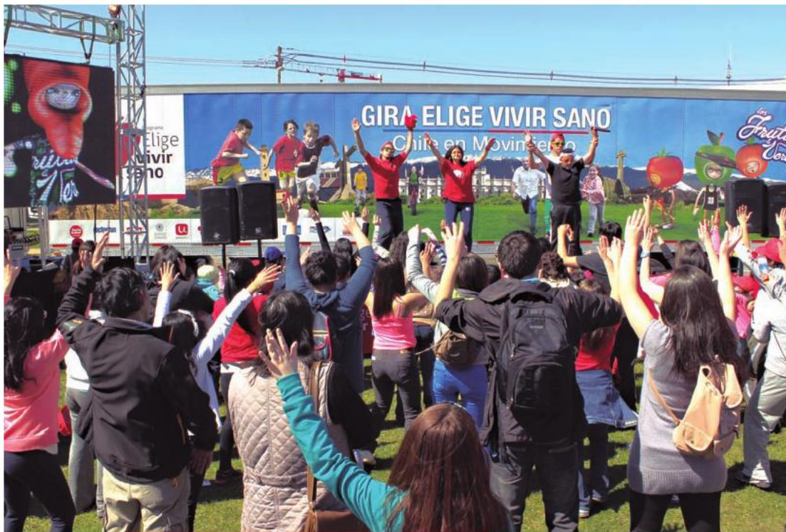
Gira "Elige Vivir Sano" de visita en la Región de Los Ríos. 8 de diciembre de 2012.