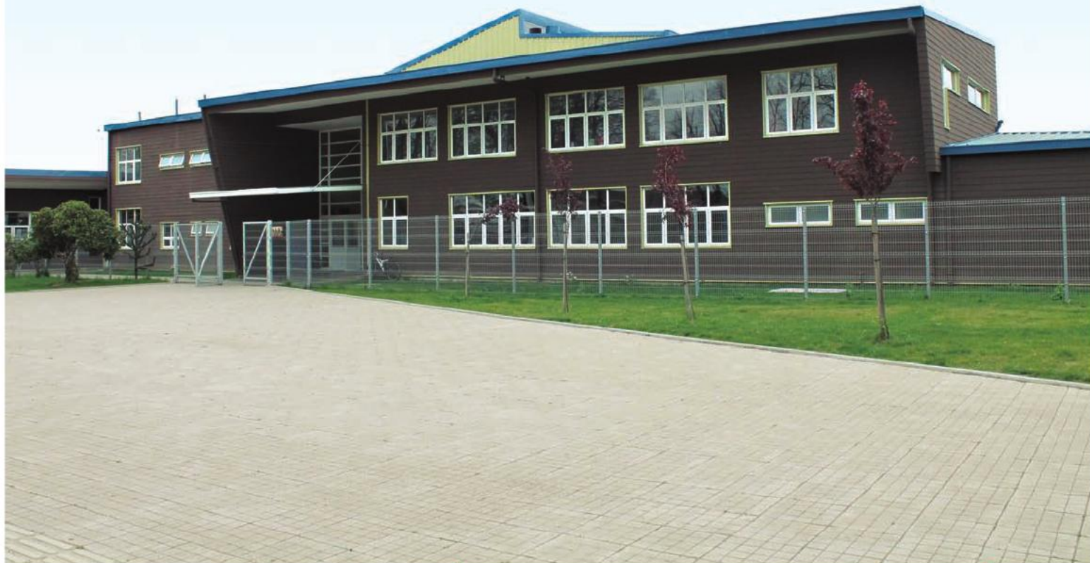
A la Escuela Básica de Río Bueno asisten diariamente 740 niños de escasos recursos, que cursan desde prekínder hasta octavo año básico.

Además, en junio de 2012 se iniciaron las obras de reposición de la Escuela Ernesto Pinto, de Panguipulli, la cual fue rebautizada como Escuela Manuel Anabalon Sáez. Los trabajos consistieron en la construcción de cuatro mil 555 metros cuadrados para recibir a los 500 alumnos, y la edificación de un gimnasio de mil 61 metros cuadrados. Casi tres mil millones de pesos fueron invertidos en estas obras, que según lo pronosticado, estarían listas para inicios de 2014.