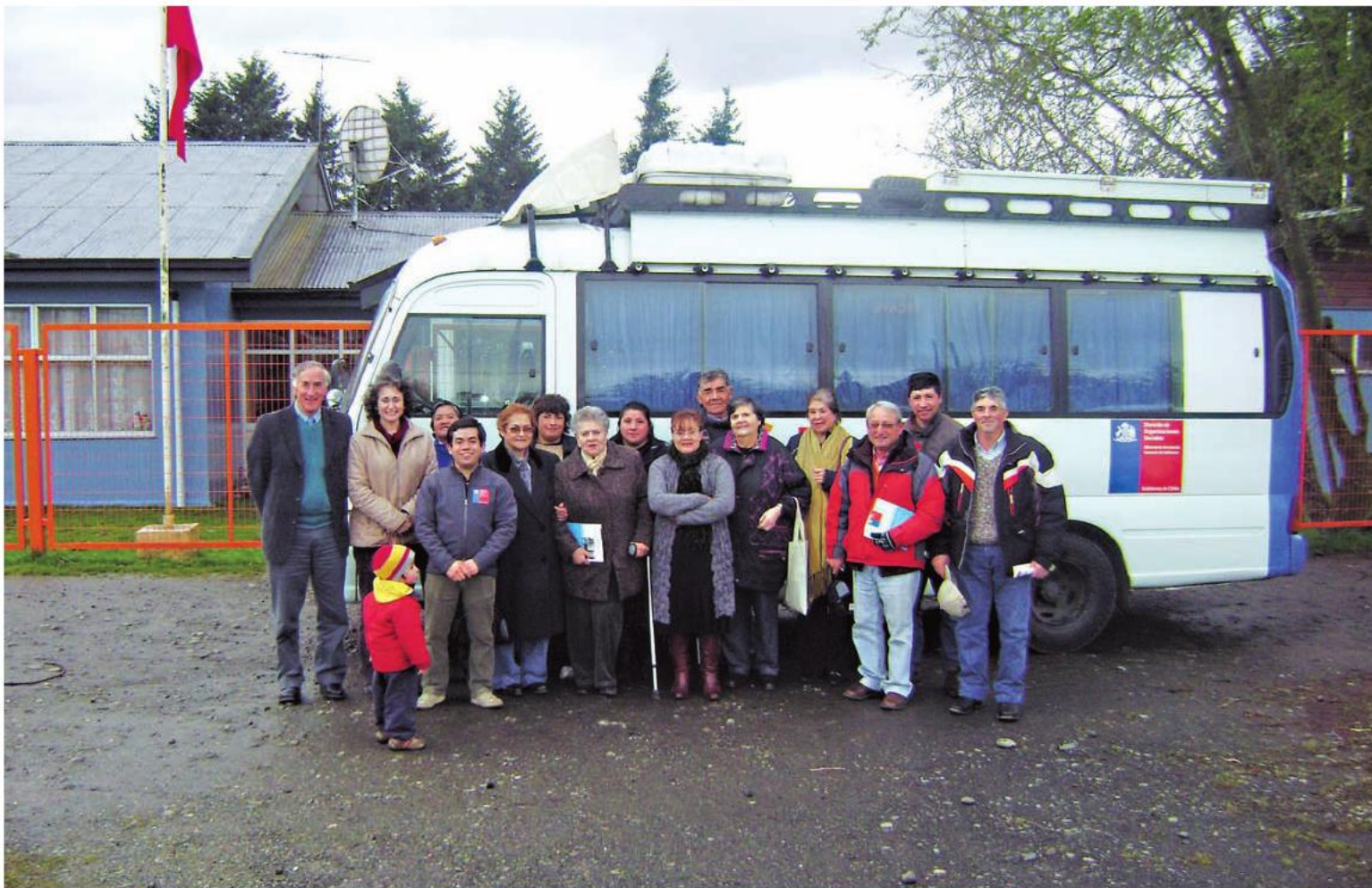
El Infobus Ciudadano recorrió la Región de Los Ríos para aclarar las dudas de los ciudadanos sobre los beneficios que entrega el gobierno a nivel nacional. 9 de septiembre de 2011.

En materia de vivienda, desde el 2010 a diciembre de 2013 se entregaron dos mil 519 viviendas para los sectores más vulnerables de la región, disminuyendo con ello el déficit habitacional, reduciendo la inquietud y fomentando la integración social. Por otro lado, a través del Programa de Protección al Patrimonio Familiar, se entregaron cerca de nueve mil 800 subsidios a vecinos y familias que han logrado mejorar sus viviendas y optimizar sus barrios y entorno.