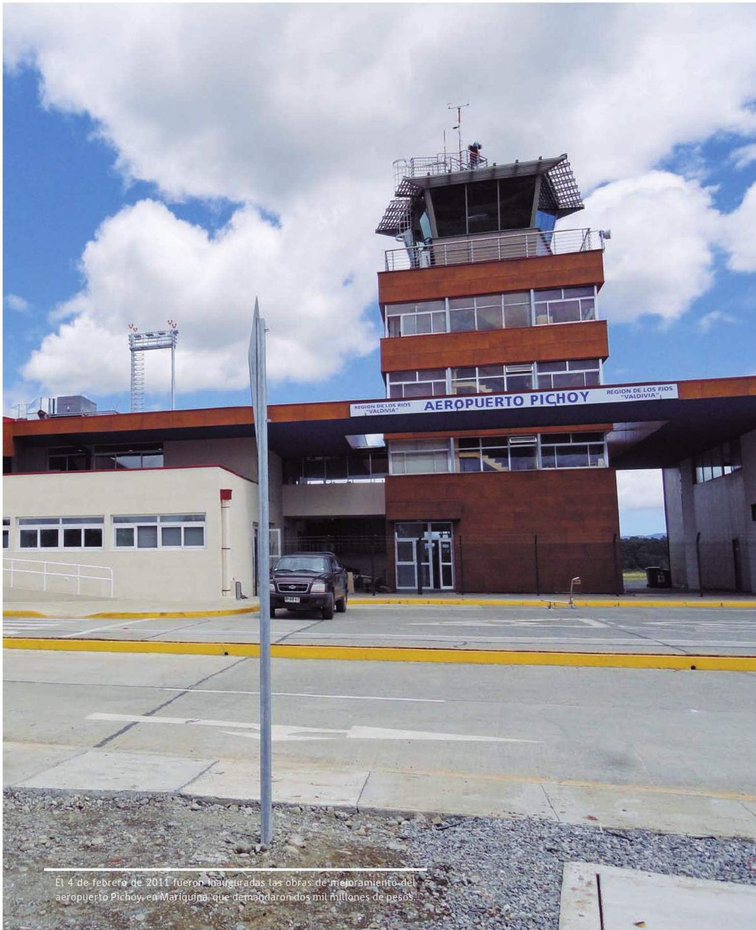
El 4 de febrero de 2011 fueron inauguradas las obras de mejoramiento del aeropuerto Pichoy, en Mariquina, que demandaron dos mil millones de pesos.