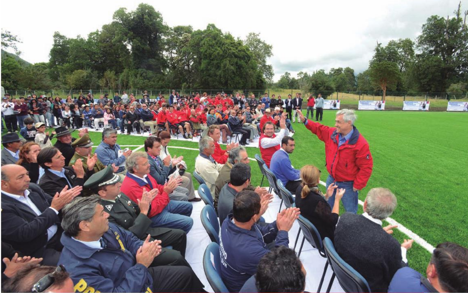
El Presidente Sebastián Piñera encabezó en la comuna de Lago Ranco la inauguración del Estadio de Riñinahue, en el marco del Programa Chilestadios. 13 de febrero de 2013.