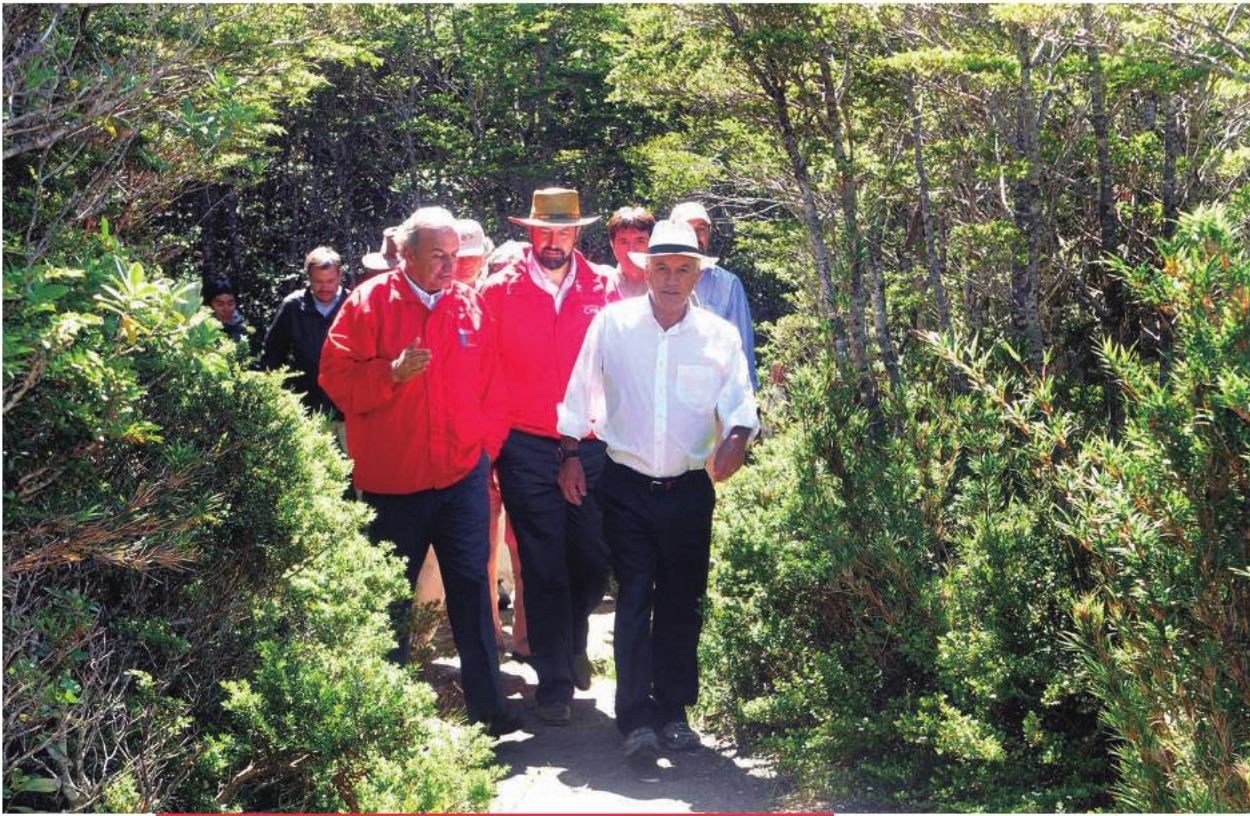
Presidente Sebastián Piñera recorriendo el Parque Alerce Costero, obra del Programa Legado Bicentenario. 3 de febrero de 2012.

“Este parque nos va a permitir muchas cosas. No solamente proteger, rescatar y conservar para las futuras generaciones este ecosistema que es único en el mundo, y que está habitado por muchas especies, desgraciadamente muchas de ellas en peligro de extinción, como el propio alerce, además de la nutria, el puma, el zorro y el pudú. También nos va a permitir convertir a esta Región de Los Ríos y a esta comuna de La Unión en un verdadero santuario del turismo ecológico, del turismo de la naturaleza”.