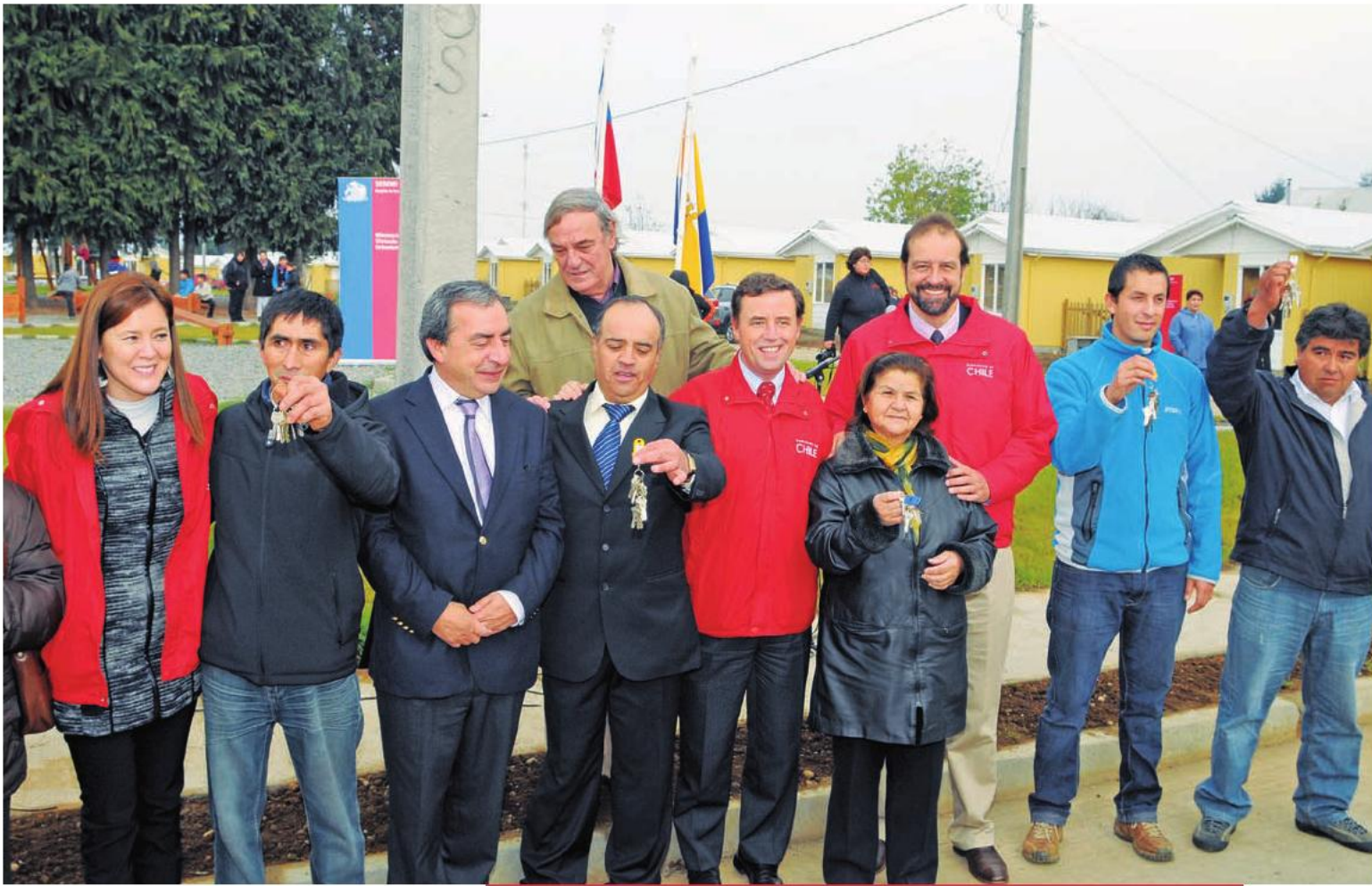
El ministro de Vivienda y Urbanismo, Rodrigo Pérez, inauguró el nuevo conjunto Villa Forestal, en Mariquina, destinado a 123 familias. 25 de mayo de 2012.

“Tal como lo dijo el Presidente ante el Congreso, requerimos avanzar hacia una vivienda digna y barrios más acogedores para nuestros ciudadanos”.