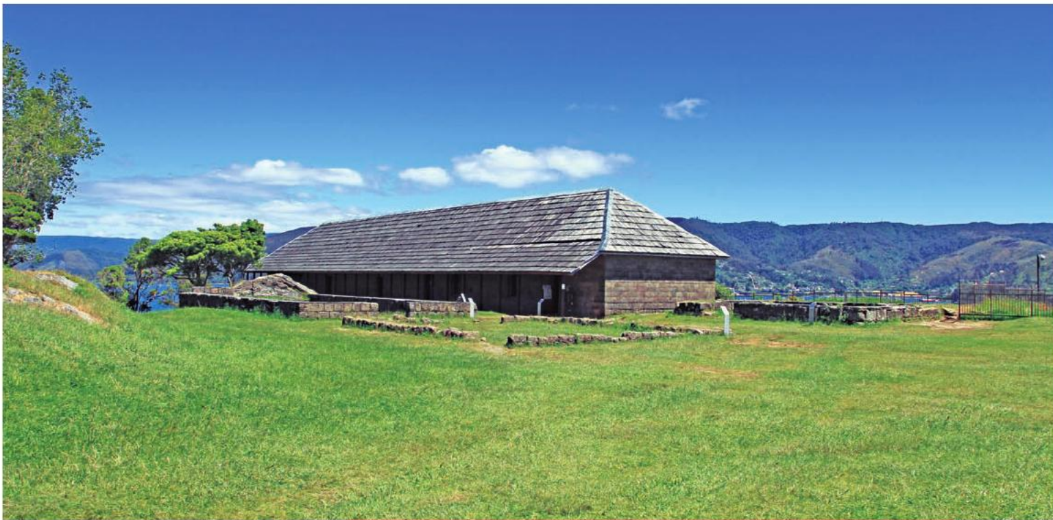
La restauración del Fuerte Castillo de Niebla finalizará en el segundo semestre de 2014.