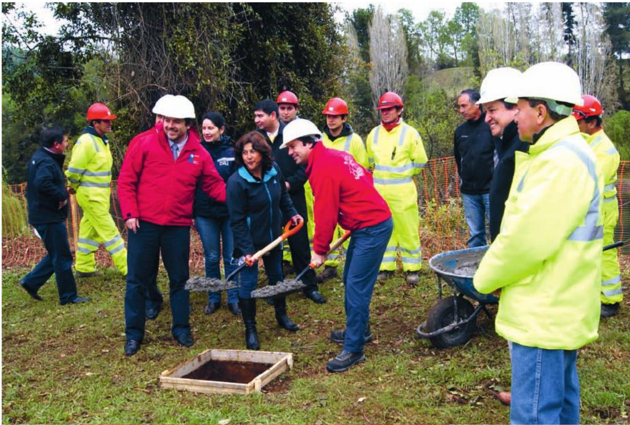
El subsecretario de Obras Públicas, Lucas Palacios, dio inicio a las obras de mejoramiento de la Ruta T-85 en el tramo Puerto Nuevo-Quillaico. 15 de octubre de 2013.

Con sus obras finalizadas se encuentra la pavimentación de la Ruta T-785, entre Coique y Puerto Nuevo, en la comuna de Futrono, que incluyó el reemplazo de los puentes de madera por estructuras definitivas. La pavimentación de la Ruta 203 CH, entre Rucatrehua y la bifurcación a Choshuenco, en Panguipulli, consideró la reposición de los puentes Huichalafquén, Pirinel y Blanco.