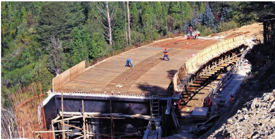
Construcción del nuevo puente La Piedra, cuya entrega está programada para el primer trimestre de 2014.

terrestre entre La Unión y Corral y, según lo pronosticado, su entrega se llevaría a cabo durante el primer trimestre de 2014.