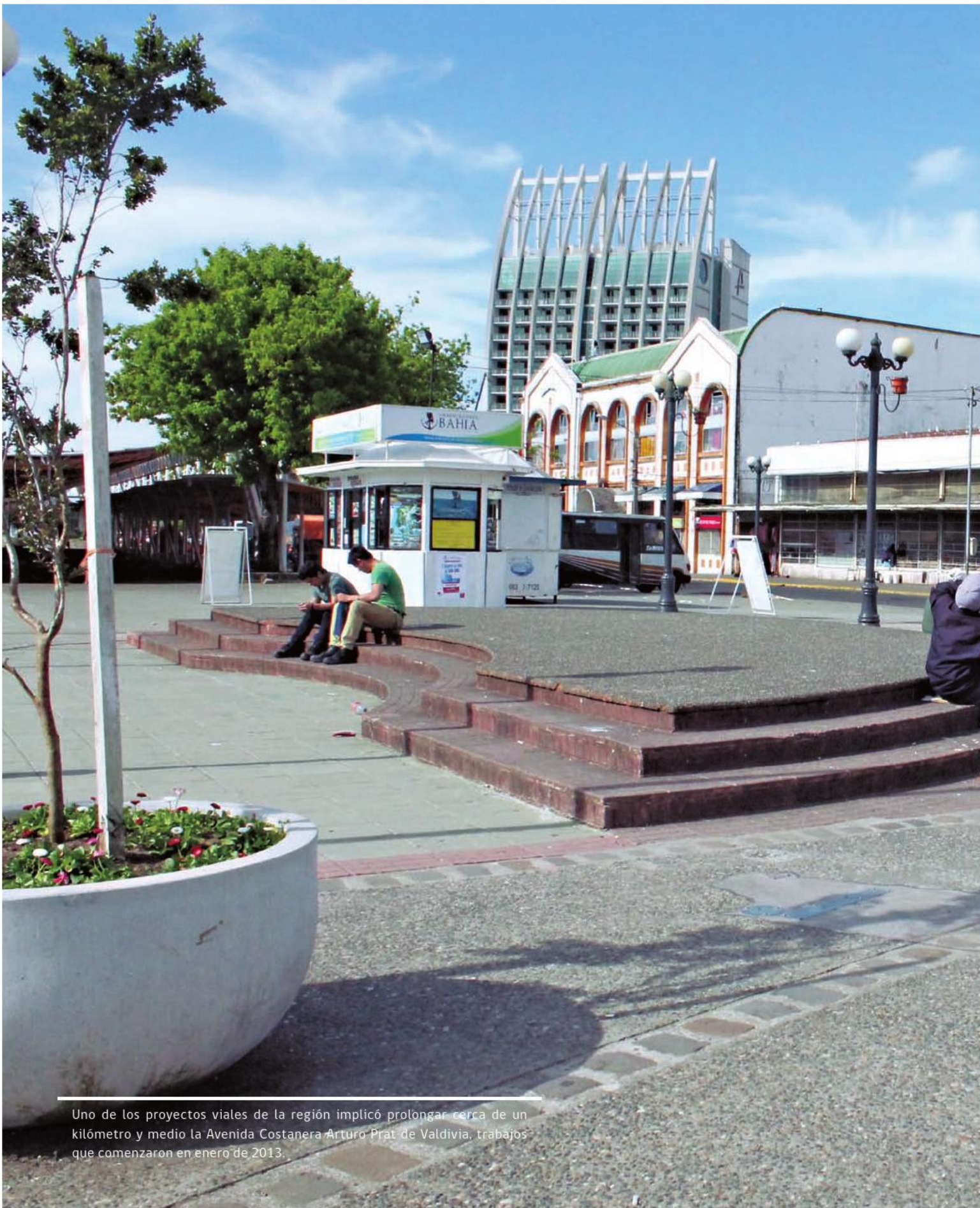
Uno de los proyectos viales de la región implicó prolongar cerca de un kilómetro y medio la Avenida Costanera Arturo Prat de Valdivia, trabajos que comenzaron en enero de 2013.