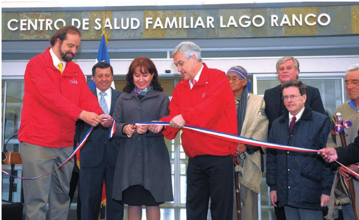
El Presidente Piñera inaugura el nuevo Centro de Salud Familiar (Cesfam) de Lago Ranco, que permite atender a más de 10 mil habitantes. 11 de octubre de 2011.

“Estoy seguro de que este nuevo Centro de Salud Familiar va a significar un cambio en la calidad de vida de las personas. Ahora, todos saben que van a poder tener una atención oportuna”.