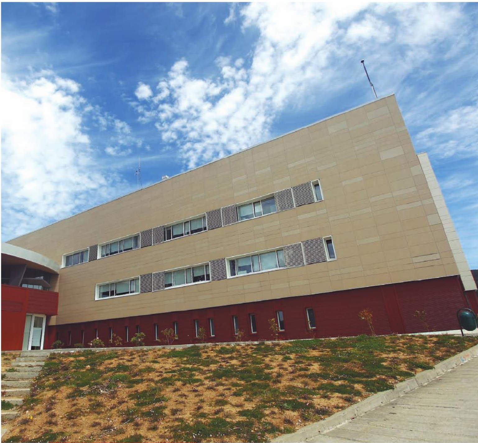
El nuevo Hospital de Corral fue inaugurado el 13 de diciembre de 2012.