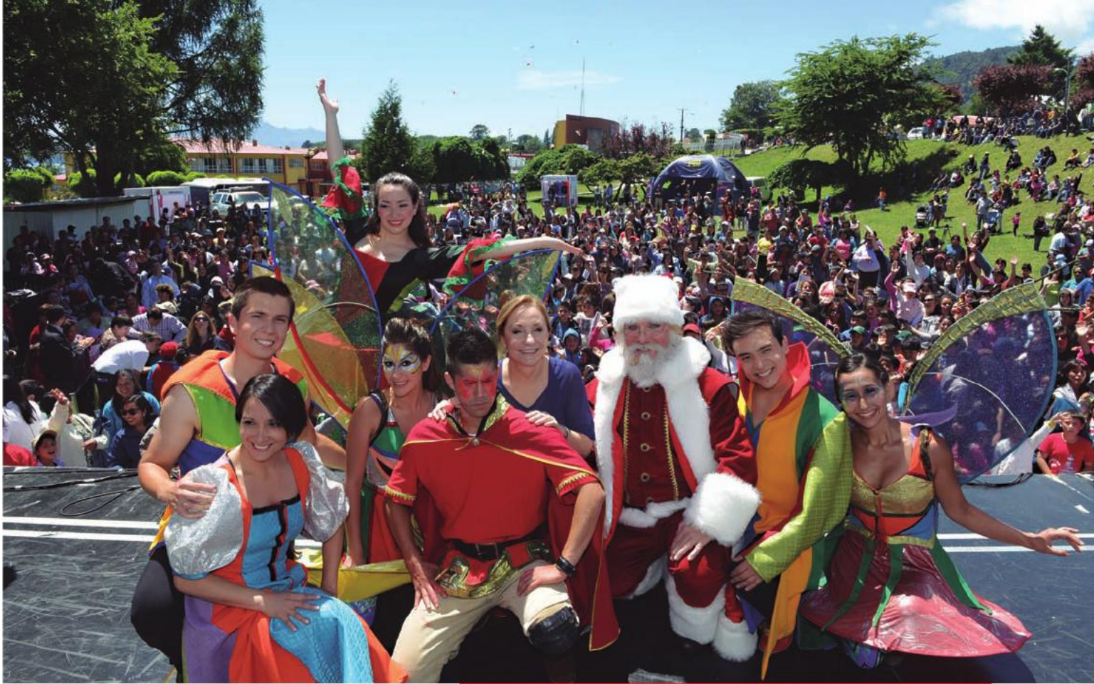
La Primera Dama en la celebración navideña del gobierno con las familias de Lago Ranco. 8 de diciembre de 2012.

“Mejorar la salud y los hábitos de vida de los chilenos fue uno de nuestros grandes objetivos, pasar desde una cultura del sedentarismo y la enfermedad a una cultura de la vida sana y la prevención. Con este mensaje llegamos a cada rincón de Chile, recorrimos el país de norte a sur y los chilenos supieron hacerlo suyo. Hoy son más las personas que se alimentan mejor, hacen actividad física, disfrutan del aire libre y de sus familias, en un camino que espero se profundice con el tiempo”.