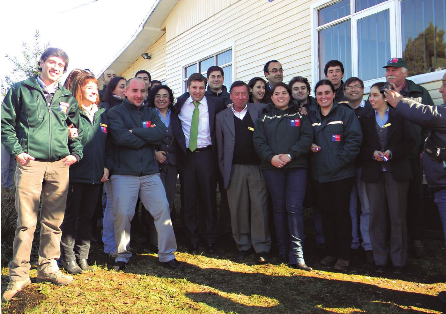
Personal del Servicio Agrícola y Ganadero (SAG) en la nueva oficina sectorial de Panguipulli, inaugurada el 20 de julio de 2013.

Asimismo, se creó la nueva oficina sectorial del Servicio Agrícola y Ganadero (SAG) en Panguipulli, la que fue inaugurada el 20 de julio de 2013 y que cuenta con 12 servidores públicos, lo que significa un apoyo concreto para atender a las comunidades de Panguipulli y Lanco, y la administración de los dos controles fronterizos terrestres de la región, ubicados en Carirriñe y Hua Hum.