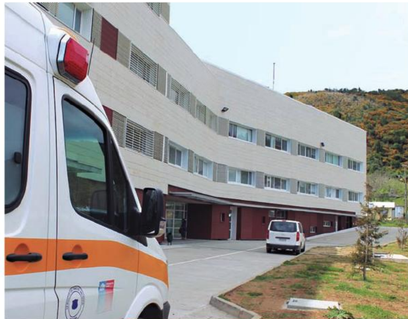
Nuevo Hospital de Corral, inaugurado el 13 de diciembre de 2012.