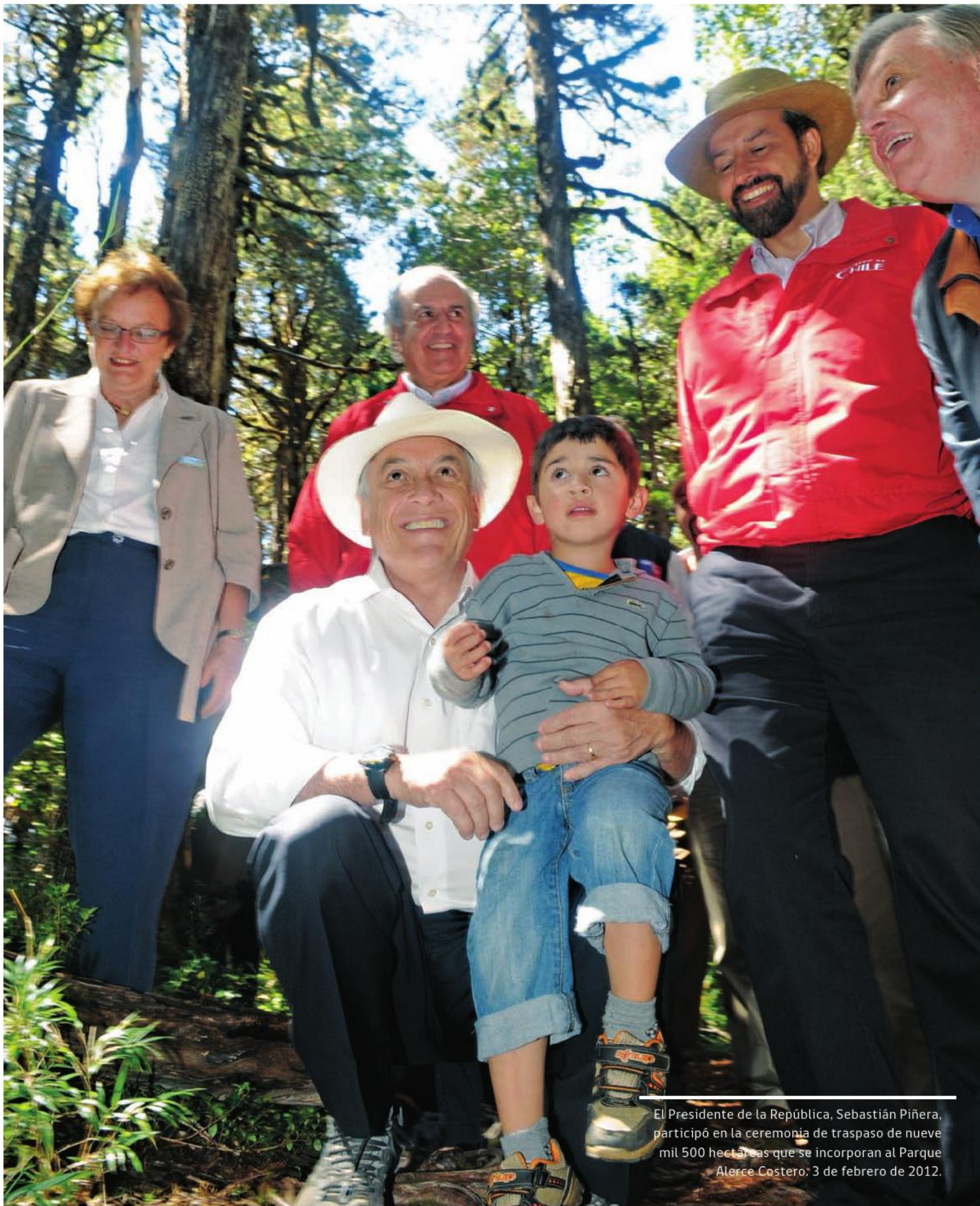
El Presidente de la República, Sebastián Piñera, participó en la ceremonia de traspaso de nueve mil 500 hectáreas que se incorporan al Parque Alerce Costero: 3 de febrero de 2012.