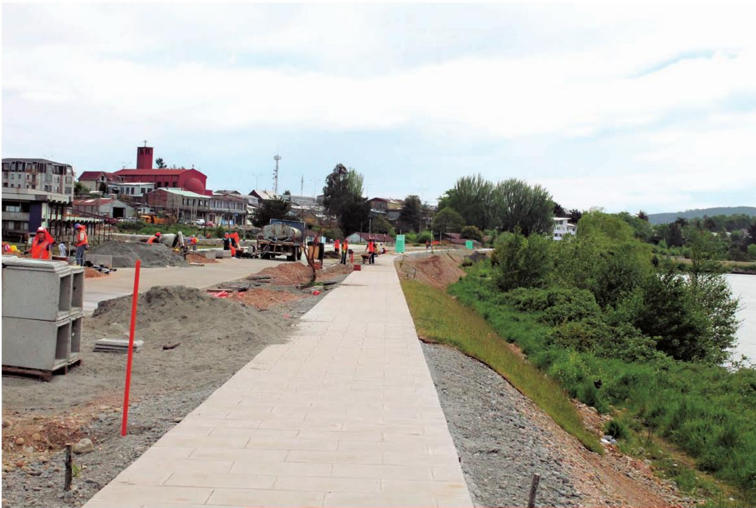
Estos son los trabajos de prolongación de la costanera y el mejoramiento de las avenidas Argentina y Ecuador de la ciudad de Valdivia, iniciados en enero de 2013.

recién iniciada, permitirá el acceso directo al Barrio Industrial de Chumpullo sin pasar por el centro de Valdivia. Esta gran obra de conexión y descongestión para la ciudad comprende dos tramos; el primero va desde Pedro Aguirre Cerda hasta ruta a Antihue y el segundo, desde la ruta a Antihue hasta Avenida Picarte. El presupuesto para dichas obras y expropiaciones es de 25 mil millones de pesos.