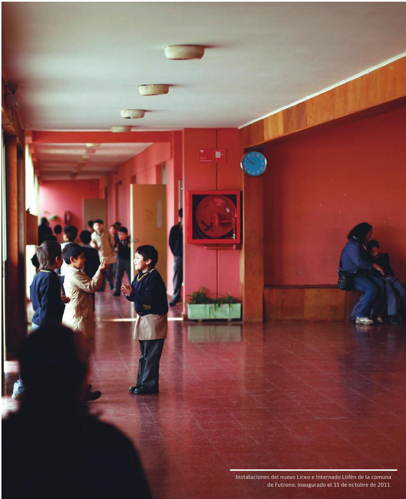
Instalaciones del nuevo Liceo e Internado Llifén de la comuna de Futrono, inaugurado el 11 de octubre de 2011.