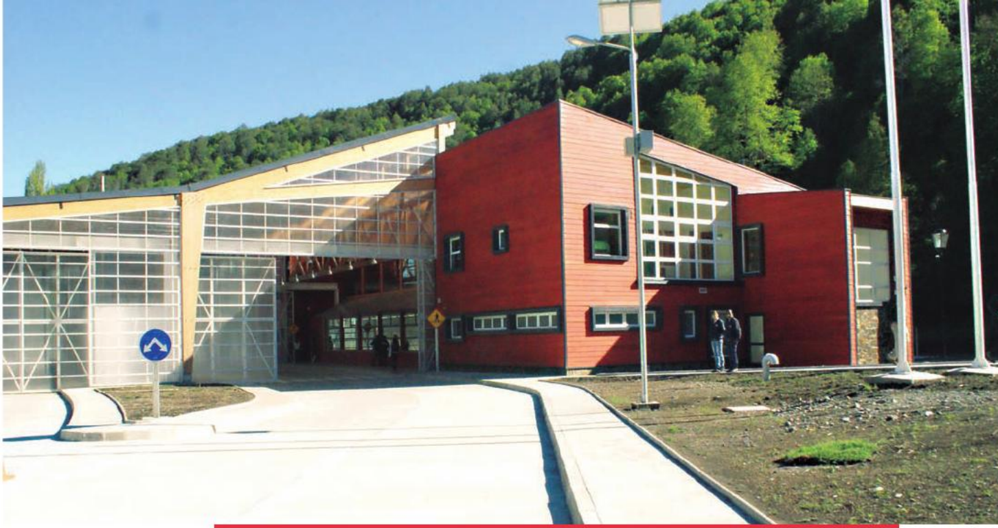
El nuevo Complejo Fronterizo Hua Hum cuenta con oficinas del Servicio Agrícola y Ganadero (SAG) y Policía Internacional, además de un hall de acceso acorde al flujo de pasajeros. 8 de noviembre de 2013.

“Esta obra significa un fomento e impulso al turismo. Esperamos que los turistas de América Latina, especialmente de Argentina, vengan a conocer las maravillas de la comuna de Panguipulli y de la región. El complejo, junto al fortalecimiento del puerto de Corral, serán un importante impulso para el sector productivo”.