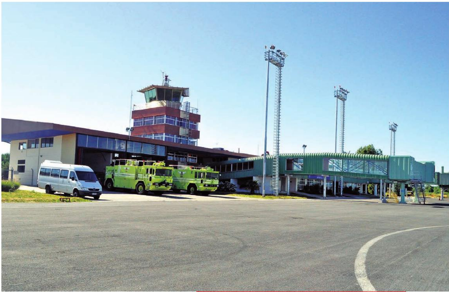
En el Aeropuerto Pichoy se implementó el nuevo Sistema de Aterrizaje Instrumental (ILS), el que estará operativo en abril de 2014.

También es relevante mencionar los avances en conectividad aérea. Se llevó a cabo el mejoramiento del Aeropuerto Pichoy, en la comuna de Mariquina, que fue inaugurado el 4 de febrero de 2011 y significó una inversión de dos mil millones de pesos para la ampliación de la sala de embarque, reparación del hall, construcción de un nuevo puente de acceso para los aviones y la implementación de una nueva "manga", para que dos naves puedan ser abordadas simultáneamente.