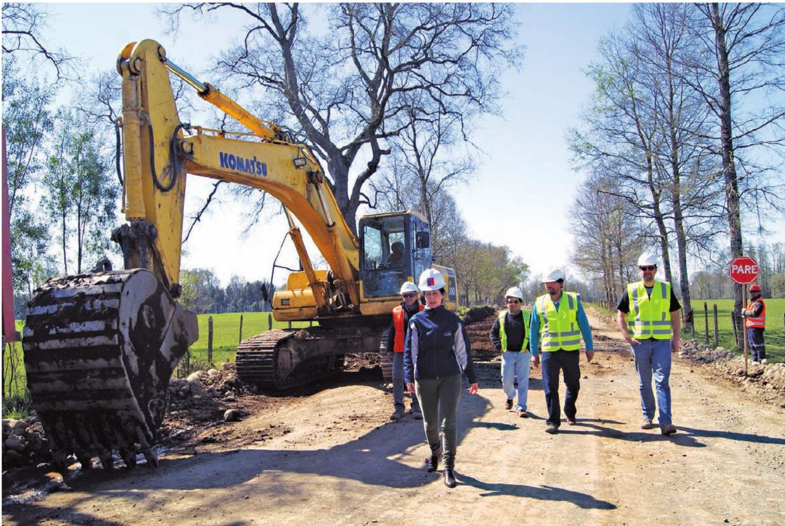
Obras de mejoramiento en las rutas T-835 y T-905, que unen las localidades de Cayurruca, Trapi y Crucero, en Río Bueno. 29 de septiembre de 2013.

iniciativa busca mejorar la conectividad y beneficiar a los sectores lecheros y ganaderos de la zona.