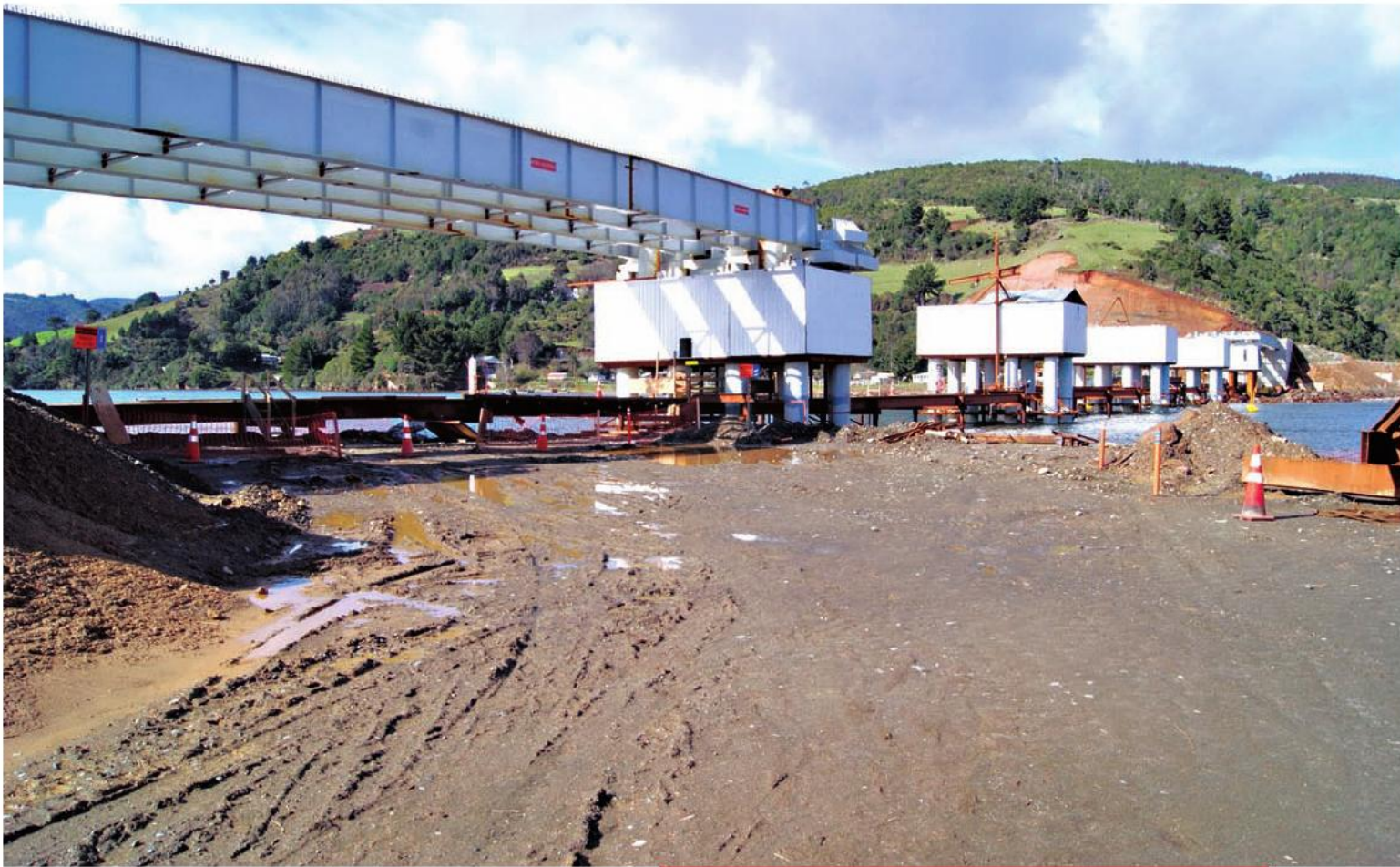
Construcción del nuevo puente Río Lingue, comuna de Mariquina, obra que se contempla entregar el primer trimestre de 2014.

lleguen hasta nuestras comunidades y ahora con estas obras y otras que ya se han hecho vemos que esta lucha es exitosa y por fin nos sentimos considerados para terminar con el aislamiento en el que vivimos".