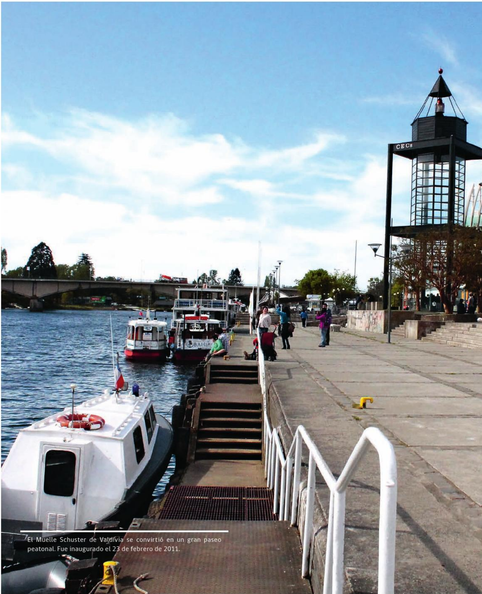
El Muelle Schuster de Valdivia se convirtió en un gran paseo peatonal. Fue inaugurado el 23 de febrero de 2011.